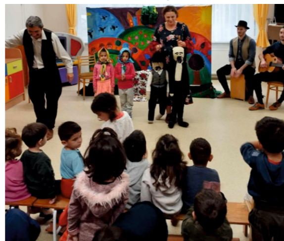
A Paramisi Társulat meseelőadása