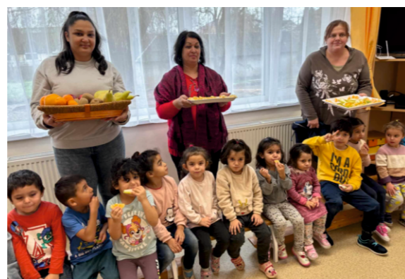
Gyümölcsözés a Máltásokkal

Előző lapszámunkból kimaradt felterjesztés