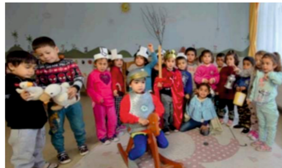
Szent Márton legendája