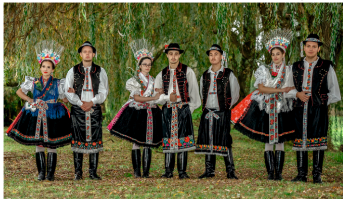
A hintón ülő párok és a kisbíró