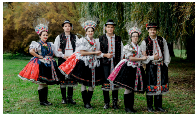
A hintón ülő párok