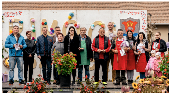
A főzőverseny résztvevői