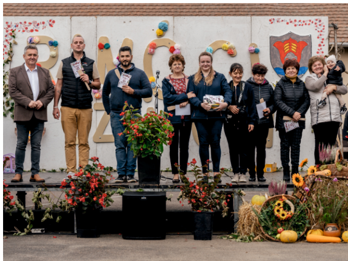
A lektárverseny résztvevői