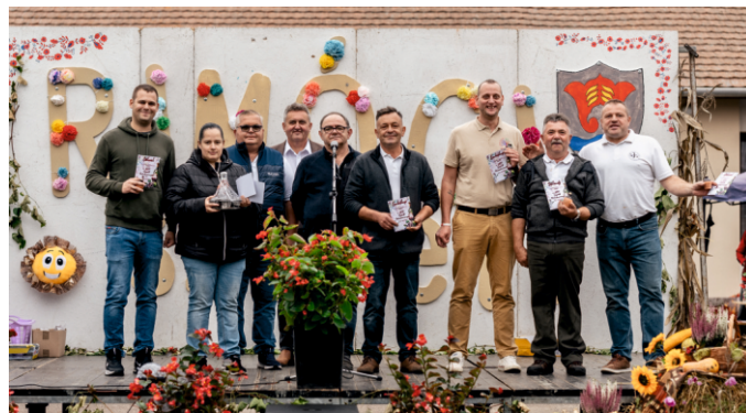
A bor és pálinkaverseny résztvevői