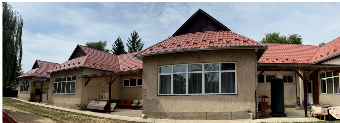
A felújítás folyamatában...