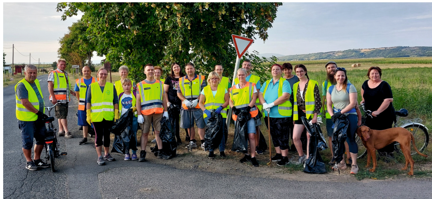
A szemétszedésben résztvevők