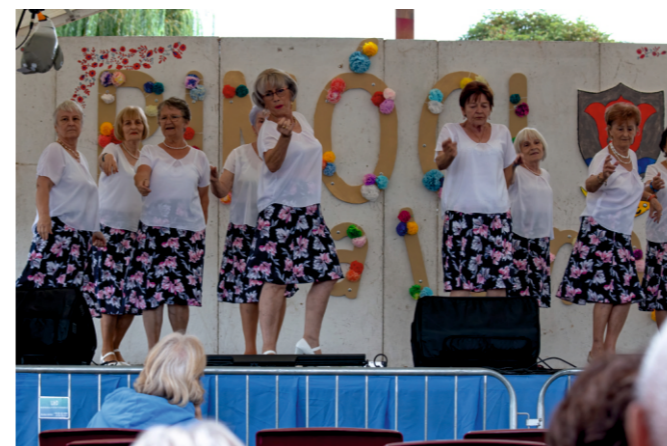
Szécsényi Derűs Asszonyok Nyugdíjas Klub