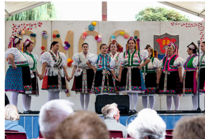
Rimóci Folklor Manufaktúra