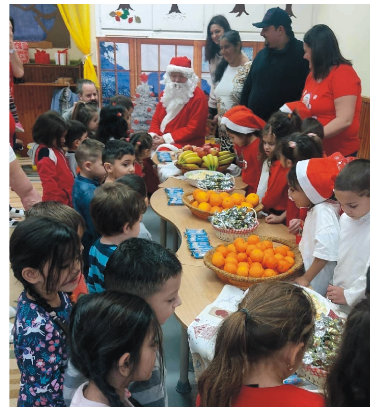
Mikulás várás a Máltai Szeretetszolgálat munkatársaival