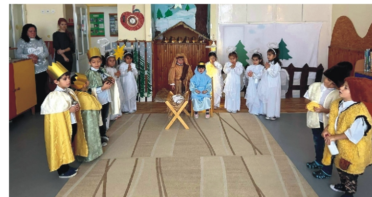
Gyermekeink karácsonyi hangulatban