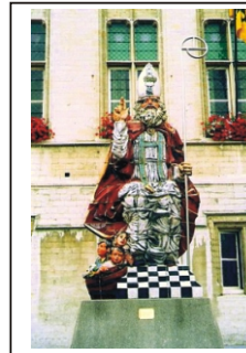
Szent Miklós szobra - Brüsszel

Régen volt akkora szükség a megbékélő kéznyújtásra, mint most!