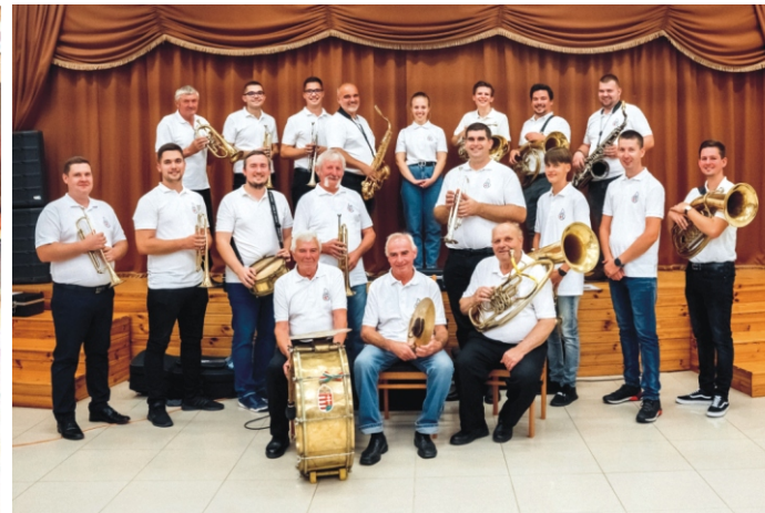
Rimóci Rezesbanda 2022