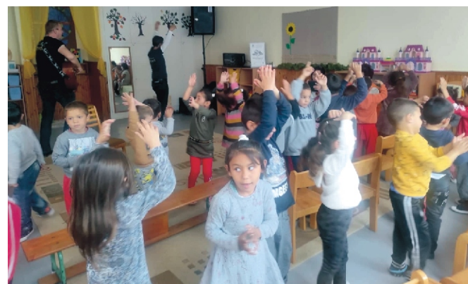
Képzelt kirándulás a Mosolyra Hangolókkal