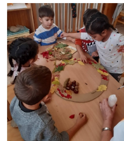
Készül az őszi koszorú