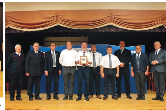
Rimóc Községért Kitüntető díj: Szent József Katolikus Férfiszövetség

Ruháit számos hagyományőrző csoport viseli. 1990-ben pedig a Hímző és Népviselet Készítő Iparművész kitüntetését kapott.