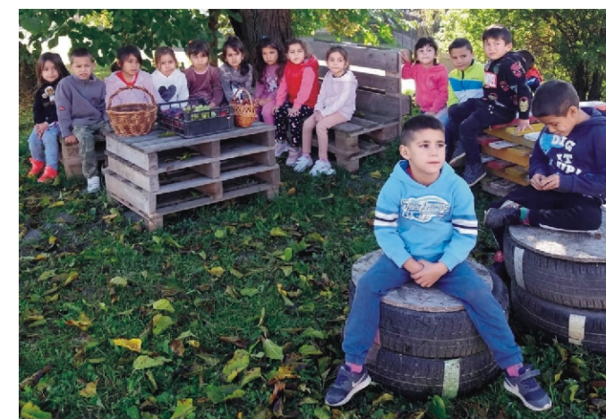
A „Kurázs Domb”... innen néztünk szerte szét