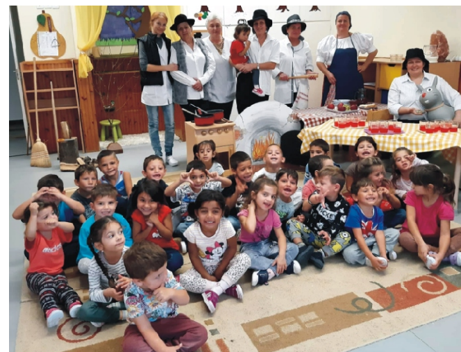
Együtt a szereplők és a közönség