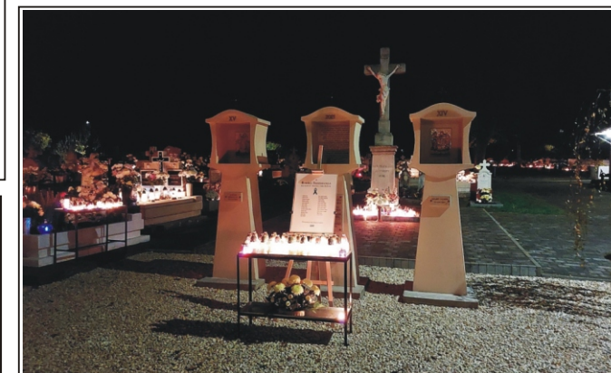
A kereszt a stációk és a Rezesbanda elhunyt tagjainak emlékhelye Mindenszentekkor