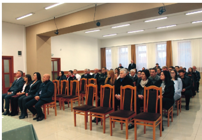
A megemlékezésen résztvevők