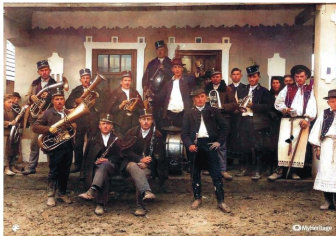
Rimóci Rezesbanda 1922

Este felé a Közösségi Házban a családtagokkal együtt folytatódott az ünneplés. A vacsora után zenéléssel régi