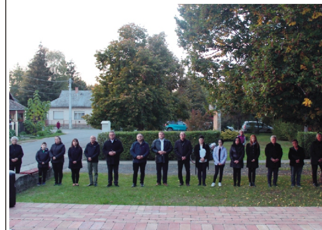
A megemlékezésen résztvevők

Őszi napnak csendes fénye, Tűzz reá a fényes égre, Bús szívünknek enyhe fényed Adjon nyugvást, békességet; Sugáridon szellem járjon S keressen fel küzdelminkben Az aradi tizenhárom.