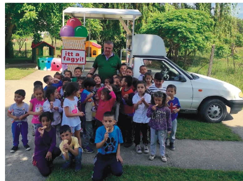
„Megjött a fagyaltos!”

A májusi napfény, a hús szellő csalogatja gyermekeinket a szabadba. Ezért is terveztünk egy egész délelőtt tartó kirándulást a „Vedd fel a nyúlcipőt!” napunkon. A sportpályán sok - sok mozgással, versenyfutással, labdázással töltöttük az időt. Közben megfigyeltük a tavaszi határt, hallgattuk a madarak énekét, gyűjtöttük az elhullott kincseket. Bizony minden gyermek megéhezett, jóízűen falatozott a csomagolt csemegéből, majd fáradtan, de élményekkel telve értünk vissza az óvodába.