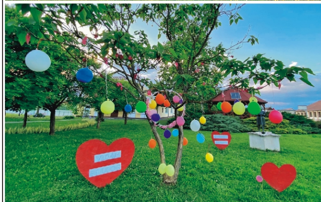
Ünnepi díszben a tér Anyák napján és Gyereknappor