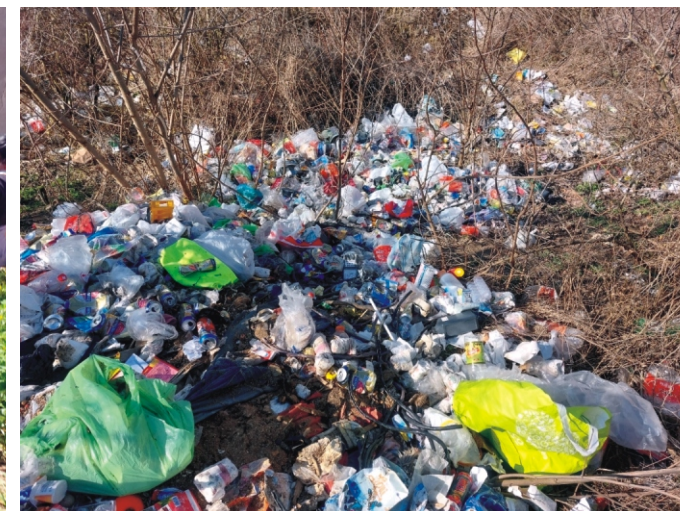
Ha valaki így akar élni tegye ezt a saját udvarával