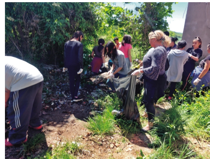
Egy óra alatt egy fél konténer szemét gyűlt össze csak erről a helyről

A Rimóci Kobak Egyesület a Magyar Máltai Szeretetszolgálat rimóci részlegével együttműködve május 18-án, szerdán szemétszedést tartott Rimócon, a Rákóczi út- Hunyadi út találkozásánál. Sajnos valaki, de inkább valakik, a romos ház udvarát és hátsó részét illegális személerakónak használta, így nagy mennyiségű szemét keletkezett, amely nem csak csúnya látványt nyújt, hanem emberre és állatra is veszélyt jelent, ezért fel kell számolni! A Máltai Szeretetszolgálat éppen azon a héten kapott konténereket, ezért abban állapotunk meg, hogy közös erővel megpróbáljuk összeszedni a szemetet. Egy dologgal sajnos nem számoltam, hogy időközben megnő a fű, ezért csak a töredékét tudtuk eltüntetni a felhalmozott hulladéknak.