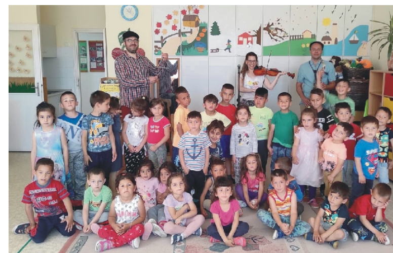
„Leültünk a lócára”

A tavasz utolsó hónapja mindig mozgalmas óvodánkban. Május elseje a majálisok napja, a munka ünnepe. A fiúk csodaszép májusfát díszítettek a lányoknak az óvoda udvarán, amit körbetáncoltunk, vidám énekkel köszöntöttünk. Utána a fűben igazi majális hangulatot élhettek meg óvodásaink, virslivel, üdítővel, édességgel, sok játékkal. Előző héten nagy titkolózás folyt mindkét csoportunkban. Az év legszebb vasárnapja közeledett, az anyák napja. Nagy odafigyeléssel készültek a gyermekek, hogy megtanulják a verset, éneket, készítsék el az ajándékot. Így köszönték meg az életüket, a féltő gondoskodást, szeretetet anyukájuknak, nagymamájuknak.