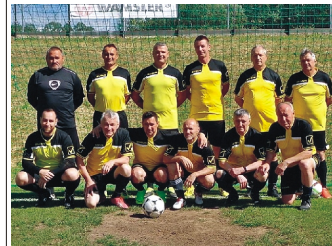
Rimóc Senior csapata