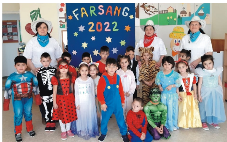
Az Alma csoportosok