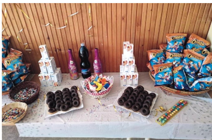
Sok finomság a büfében