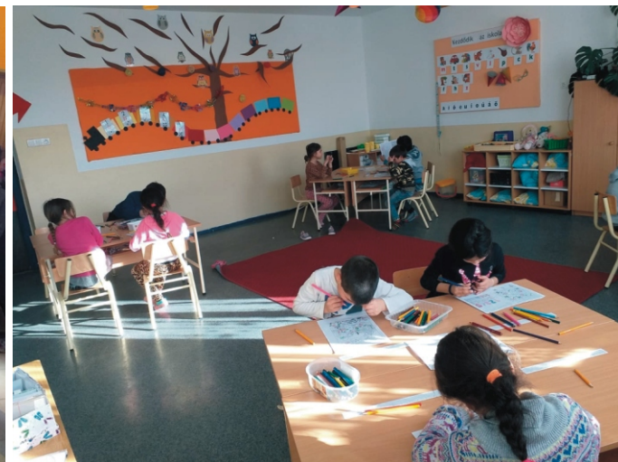
Rejtvényfejtő 1. osztályosok