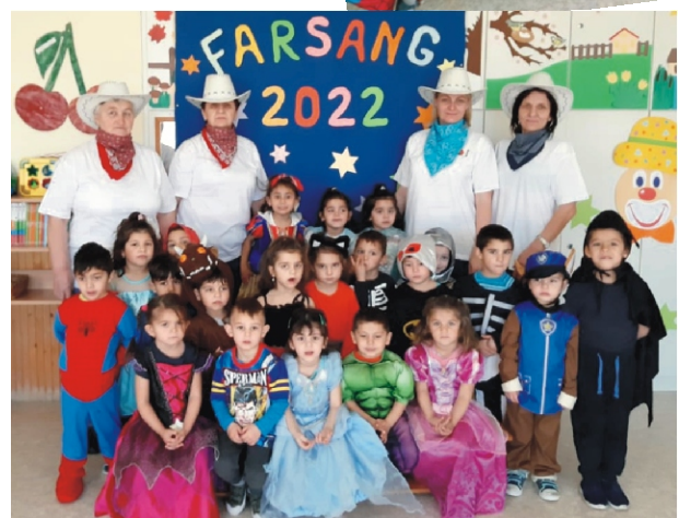
A Körte csoportosok