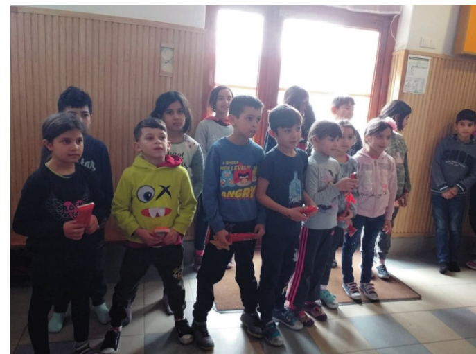
Rejtvényfejtő verseny győztesei