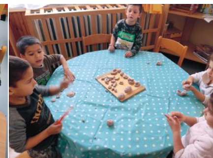
és a péksütemények