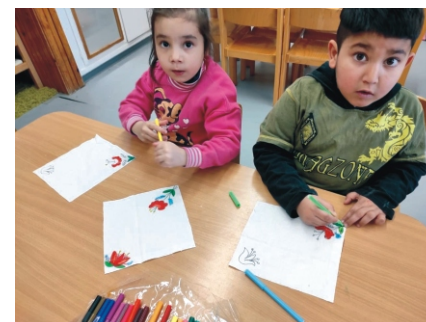
Készülnek a keszkenők

A Máltai Szeretetszolgálat jóvoltából a pótszilveszteri partin gyerekpezsgővel koccintottunk a sikeres, eredményes újévre. Bízunk benne, hogy valóban elmondhatjuk az év végén, hogy sikereket értünk el, eredményeket tudunk felmutatni.