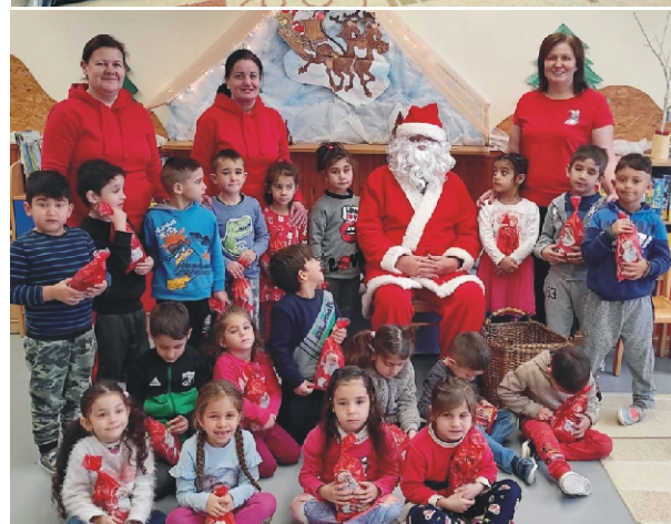
Reméljük, hogy jövőre is eljön hozzánk az „igazi” Mikulás