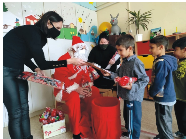
Jobb adni, mint kapni