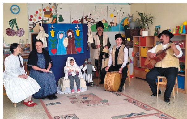
Az előadásban a gyerekek szívesen vállalnak szerepet is