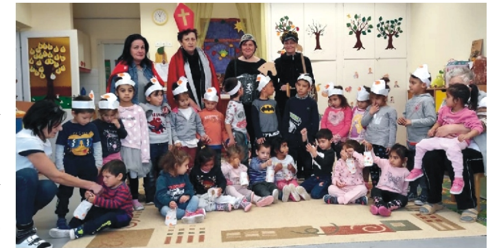
A nagycsoportosok libás fejbábokkal, a kicsik pedig lámpásokkal érkeztek az előadásra

A Máltai Szeretetszolgálat minden óvodás gyereket egy szeretetsomaggal ajándékozott meg. A csomagok átadására óvodánkba került sor, melynek gyerekek és szülők egyaránt örültek.