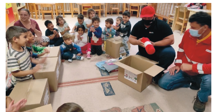
A csomagbontás boldog pillanatai