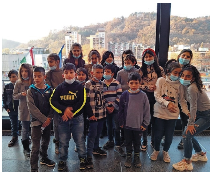
A Zenthe Ferenc Színházban

A másfél órás előadás után indultunk haza. A visszaút ugyanúgy történt, mint az oda vezető, de már sötétben érkezünk haza. Kicsit elfáradva, kicsit éhesen, de élményekkel gazdagodva szálltunk le a buszról. Mindannyian azon a véleményen voltunk, hogy jól éreztük magunkat, tetszett az előadás, és szeretnénk majd máskor is színházba, esetleg cirkuszba eljutni.