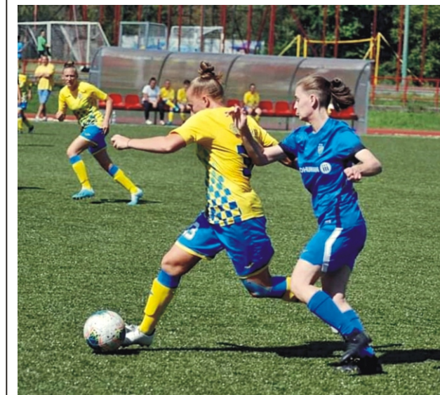
A Hatvan színeiben