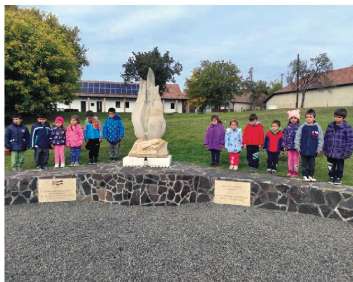
Megpróbáltunk egy kicsit szépen állni a Himnuszt hallgatva