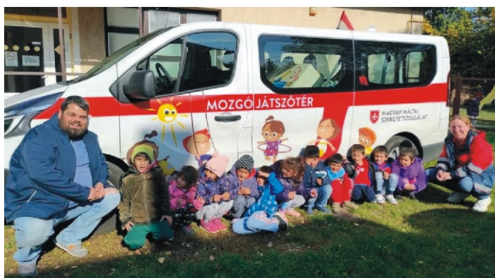
A játék mindig öröm, különösen ha új eszközöket fedezhetünk fel