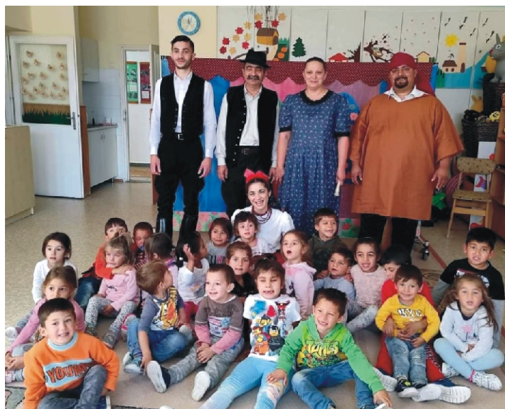
Nagyon szeretjük a Paramisi Társulatot