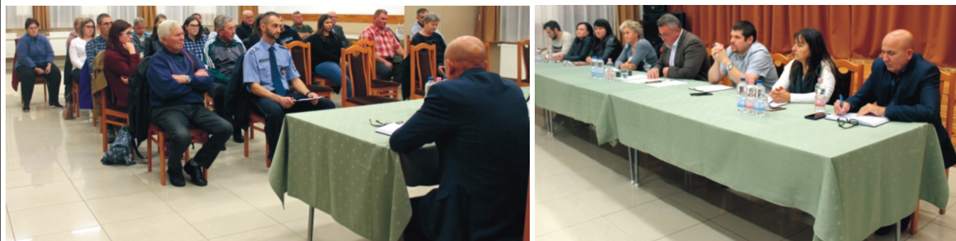
A közmeghallgatáson résztvevők