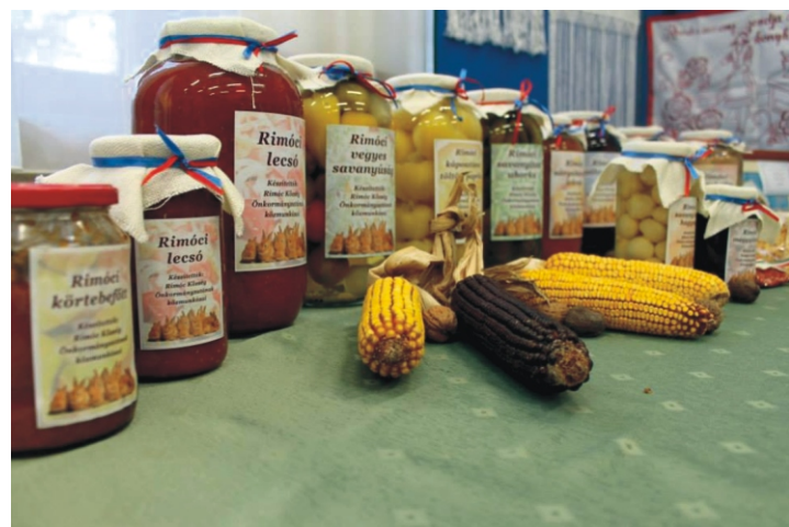
Települési Értéktár Bemutató és Kiállítás (2014)