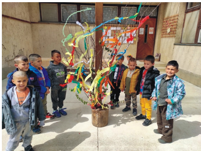
Májusfa a szép lányoknak