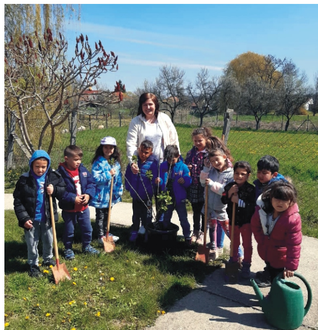
Igérjük, hogy vigyázunk az elültetett orgona fáinkra