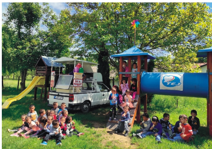
A várva-várt fagyis nap