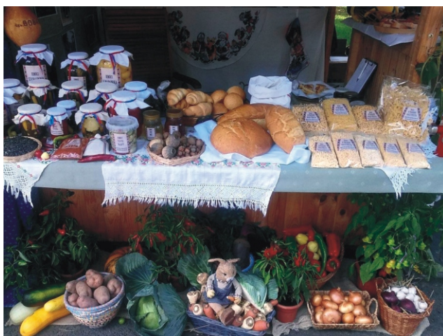
Országos Közfoglalkoztatási Kiállítás Budapesten (2016)