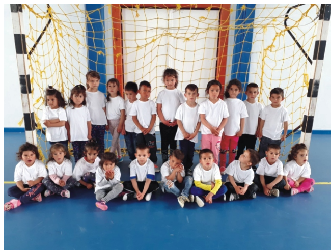
Felvettük a nyúlcipőt