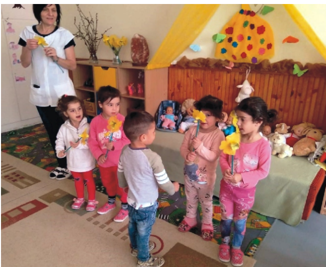
Egy szál virág többet mond ezer szónál