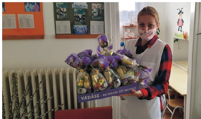
Ez a meglepetés csomag várja a gyerekeket