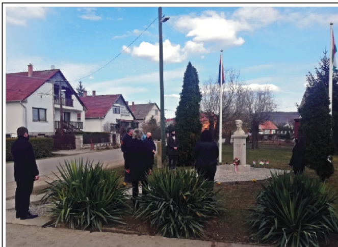
Rendhagyó koszorúzás a Petőfi szobornál

A polgármesteri döntés megtekinthető a Rimóci Közös Önkormányzati Hivatal hivatali helyiségében (3177 Rimóc, Madách tér 1.), illetve Rimóc Község honlapján ( www.rimoc.hu ).