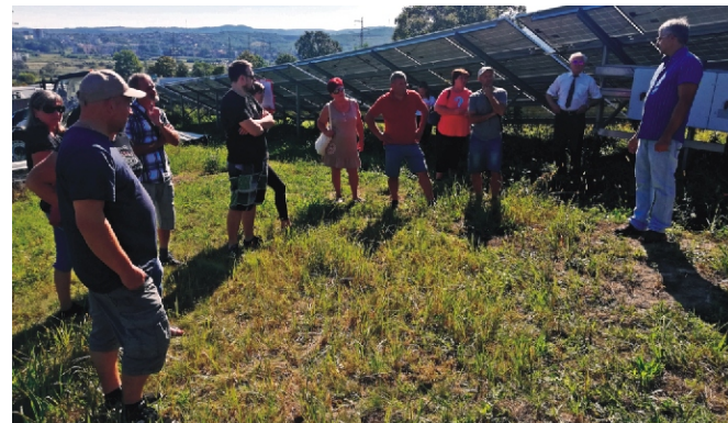
Bemutatták az energia átalakításának folyamatát

Sok új információval gazdagodtunk a tanulmányi út alkalmával. Reméljük a jövőben a megújuló energiák hasznosítása minél szélesebb körben el fog terjedni az emberiség és a bolygónk védelmé érdekében. BVÁ