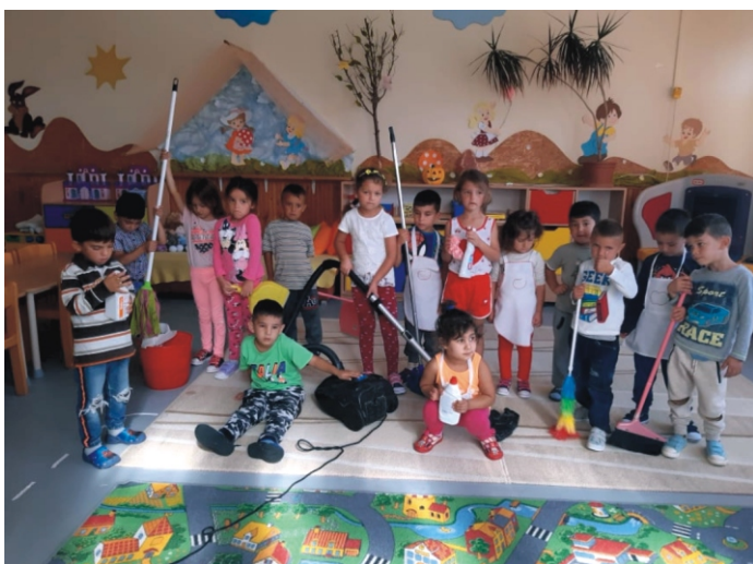
Munkára kész a nagycsoport!