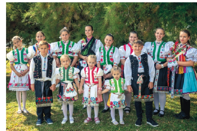
Népviseletbe öltözött gyerekek egy része