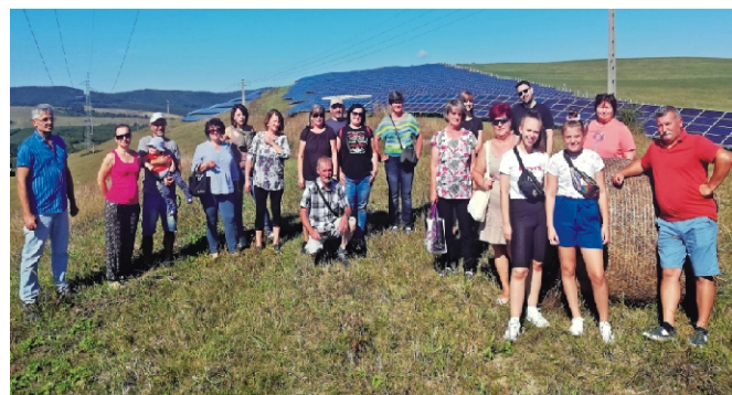
A Bátorterenyre-Mátraverebély napelemparkban