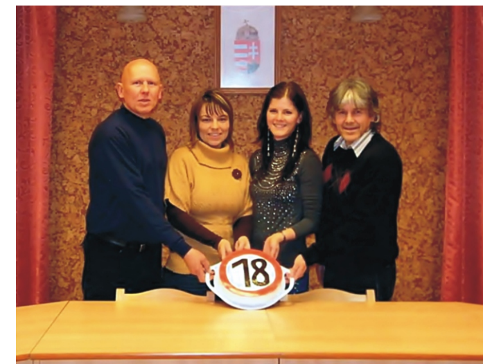
Nagykorú lett az Újság