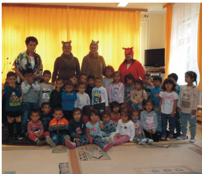
Együtt a mesebeli kerek erdőben