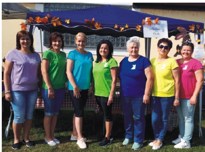
„Főzésre fel!” - csak vidáman