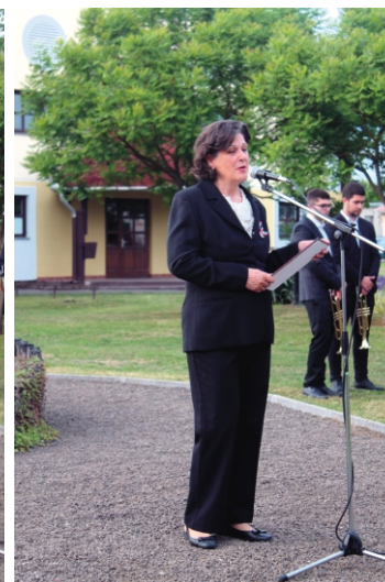
Hartmann Teréz színművész versmondás közben