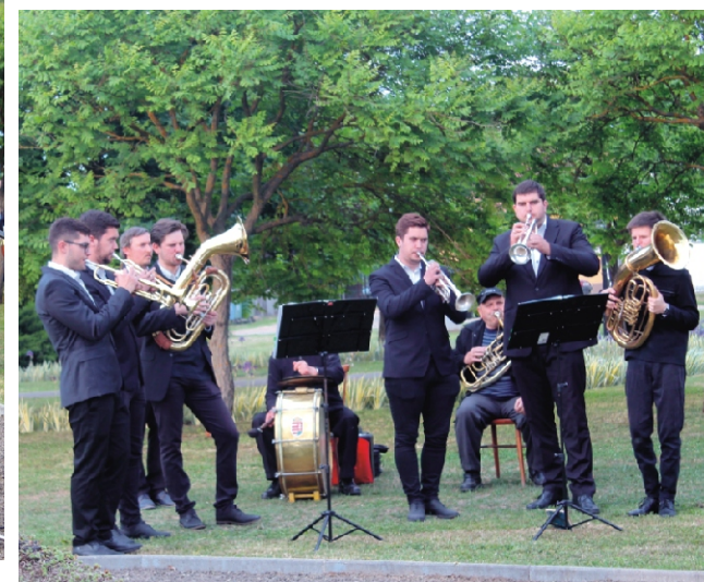
A Rezesbanda játékaival színesítette a műsort