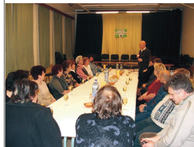
A Rimóci Újság 10. születésnapja