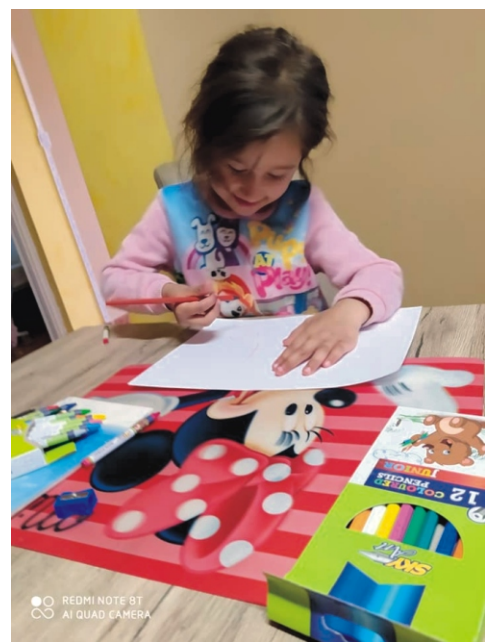
Készül az anyák napi meglepetés