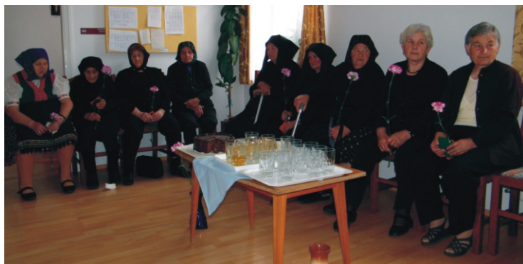
Az idősek meghatódva fogadták a gyerekektől a virágot