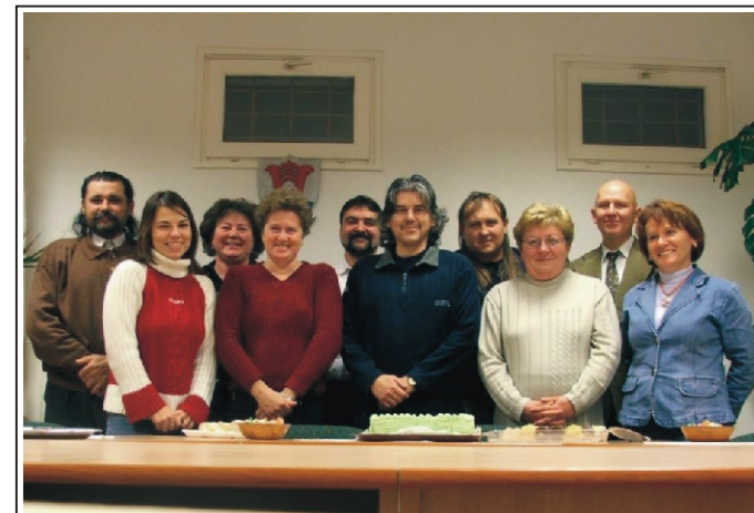
2005. 11. 20. - A Rimóci Újság 10. születésnapján