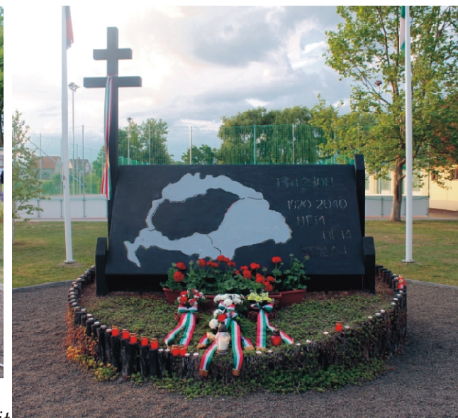
A 10 éves Trianoni Emlékmű