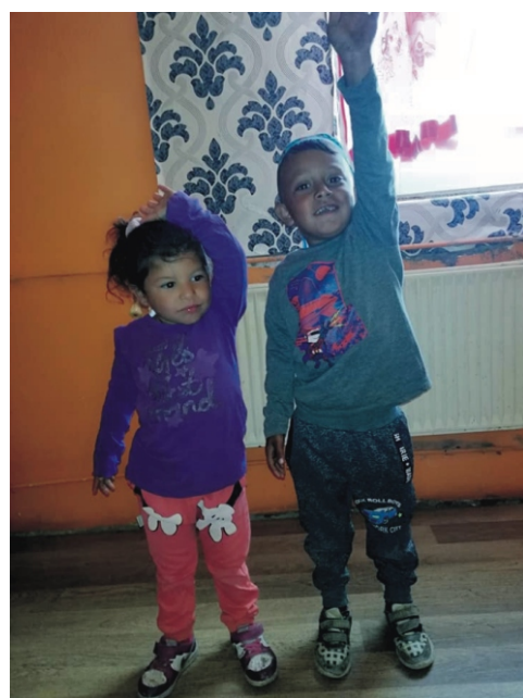
„Vedd fel a nyúlcipőt”