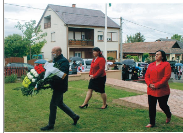
A Képviselő-testület tagjai elhelyezték az emlékezés koszorúját