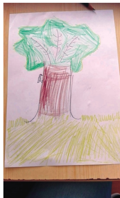
Madarak és fák napja