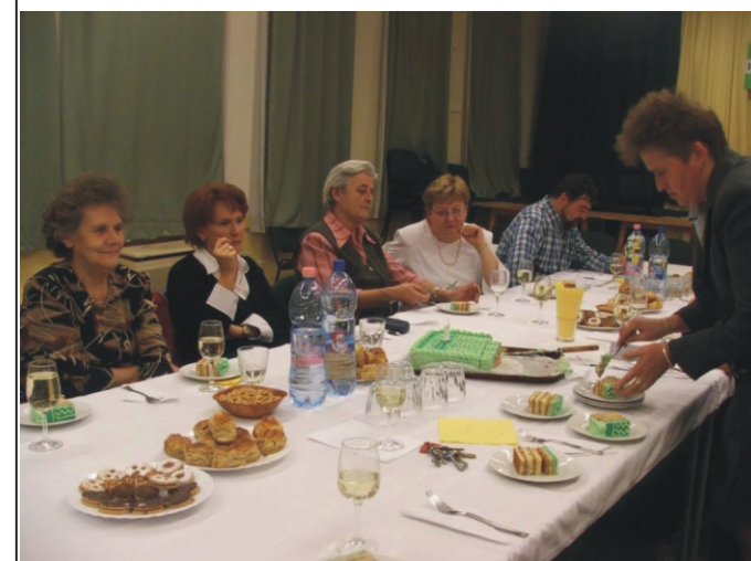
2005. 12. 09. - A Rimóci Újság 10. születésnapja alkalmából megrendezett ünnepségen