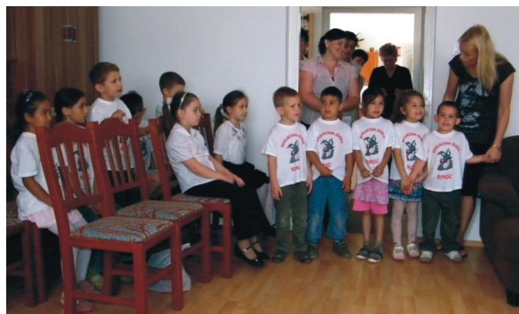
A gyerekek műsor közben