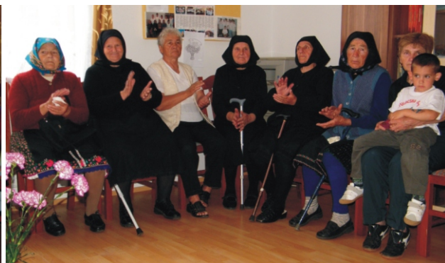
A műsor is könnyeket csalt a szépkorúak szemébe