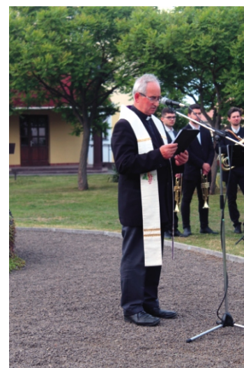
József atya imádkozott hazánkért