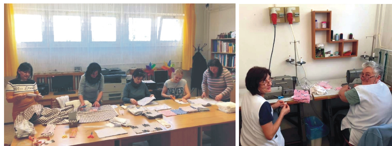
Készülnek a maszkok