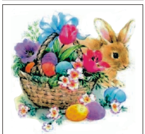
Áldott, békés húsvéti ünnepeket kíván a Rimóci Újság szerkesztősége!

Határozd el, kérlek: – Mától szebben élek, önmagam teremtek, s jövőmtől nem félek, újra magam leszek, mihelyt feltámadok, s minden kihívásra méltó választ adok!