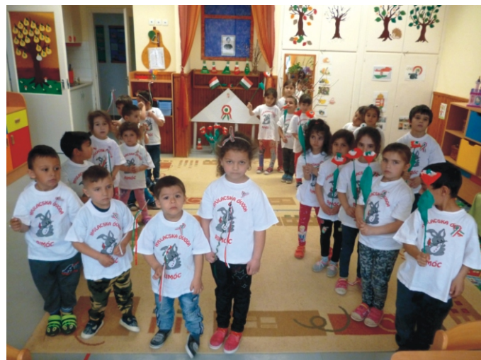
Az ünnepi hangulat komolysága tükröződik a gyerekek arcán

A koronavírus okozta veszélyhelyzet miatt a tervezett programjaink, témaheteink megvalósítása sajnos, a továbbiakban elmaradt. Óvodánkban ügyeleti rendszer van. Az Önkormányzat kérését, hogy vegyünk részt a védőmaszkok varrásában a község lakói részére, az óvoda dolgozói örömmel és készséggel fogadták. Ezek készítése folyamatban van, és hamarosan mindenkire eljutnak. A techni-