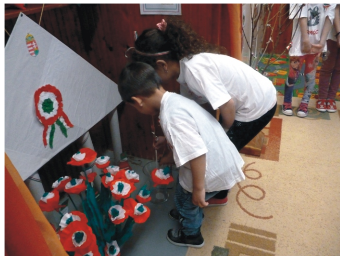
Tisztelet a hősöknek!