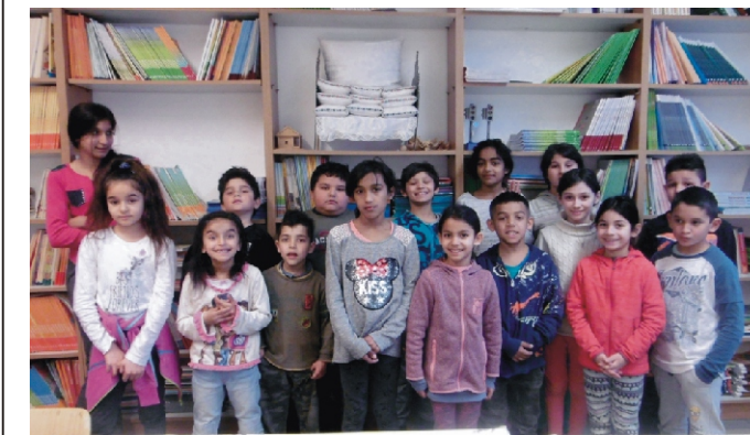
A rejtvényfejtőn részt vevő gyerekek