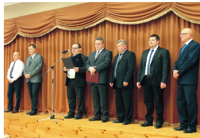
Komoly műsor a férfiaktól