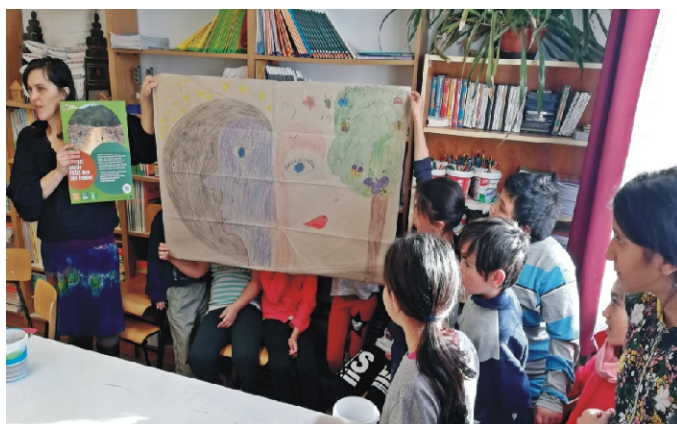
Tanulmányi verseny az iskolában Te hogyan véded Földünket?