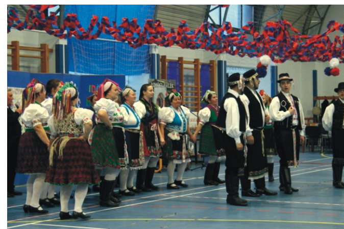
Beszkid Andor Folklor Manufaktúra és Faluszépítő Egyesület