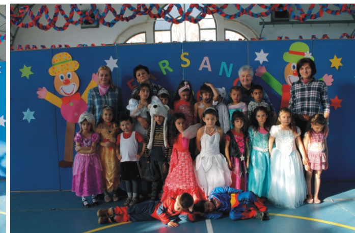
A nagyok szinte kivétel nélkül ott voltak a mulatságon