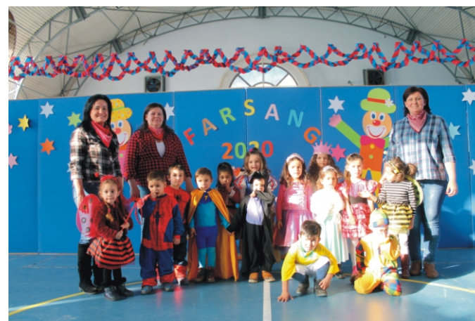
A legkisebbek a farsangi bálón