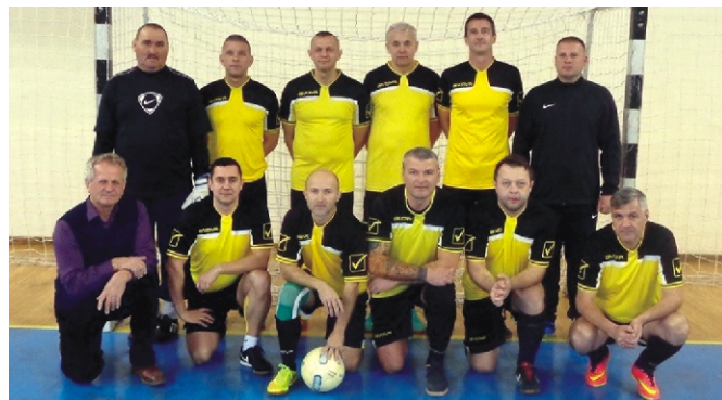
I. helyezett Rimóc csapata

A többi mérkőzések időpontjait megegyezések után közöljük.