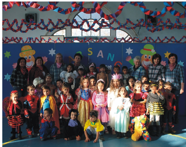
„Helye-hulya vigalom, habos fánk a jutalom...”