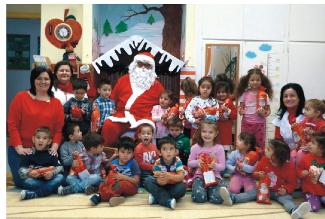
A kisebbek sem ijedtek meg a Mikulástól

Köszönjük a Rimóci Roma Nemzetiségi Önkormányzatnak a figyelmességüket, hogy a műsor végén minden gyermeket megajándékoztak egy-egy szaloncukorral!