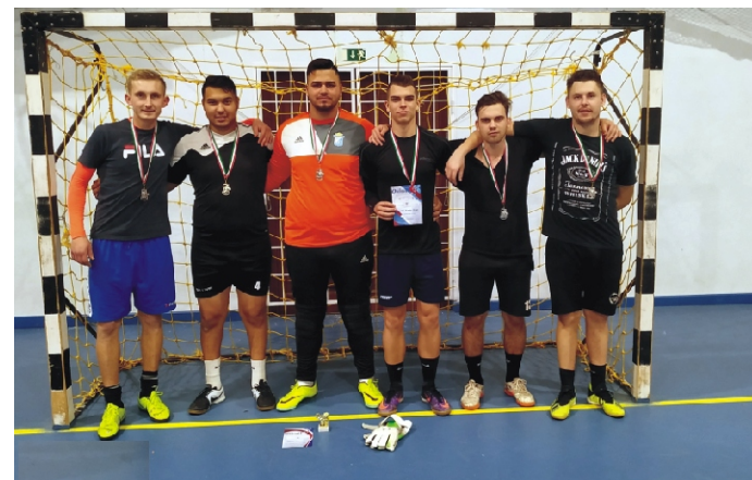
Profi Kupa II. helyezett Egy Gólt SE