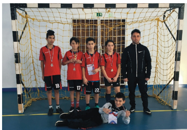
Tapsi Hapsi Junior Kupa II. helyezett Rimóc