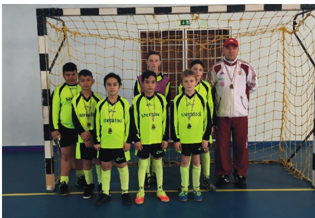
Tapsi Hapsi Junior Kupa III. helyezett Magyargéc