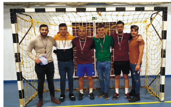
Profi Kupa III. helyezett Csibészek