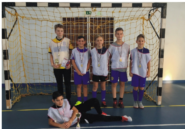
Tapsi Hapsi Junior Kupa I. helyezett Fúrge Nyuszik