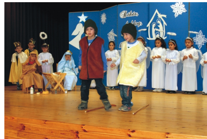
A pásztorok vidáman ropták a botos táncot!

A karácsonyi várakozásunkat a dr. Manga János Községi Házban tartottunk meg december 17.-én. A kisebbek ünnepi verssel, énekkel lepték meg a vendégeket, a nagycsoportosak pedig pásztorjátékot adtak elő. A szereplőkkel való azonosulást segítik számukra a megfelelő jelmezek, amelyekkel óvodánk rendelkezik. Nagyon szívesen veszik fel ezeket a ruhákat a gyerekek és a szülők is mindig rájuk csodálkoznak, amikor meglátják őket a színpadon.