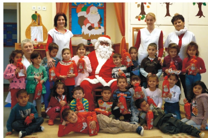
Jó lenne, ha a gyerekek még sokáig hinnének a csodákban!