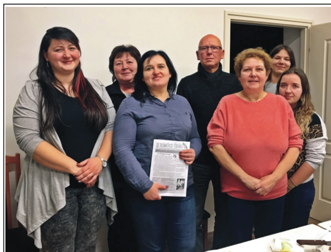
2019-ben 24 éves a Rimóci Újság!