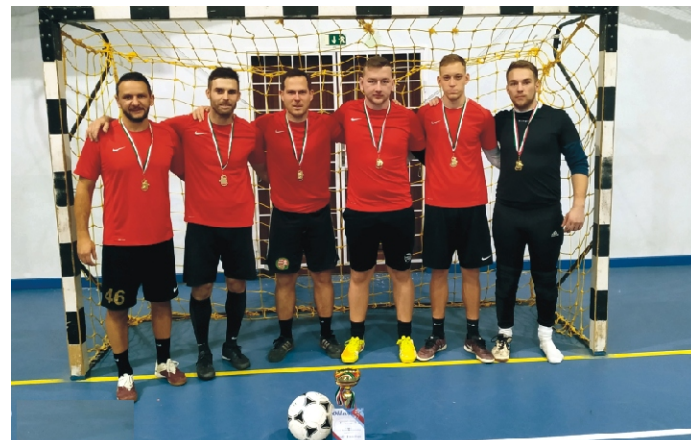
Profi Kupa I. helyezett Dolce Vita