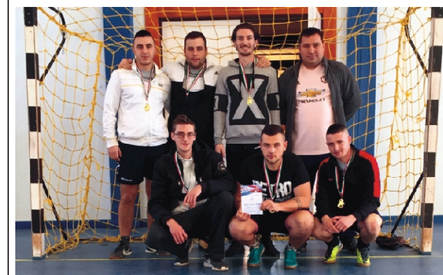
Tapsi Hapsi Kupa I. helyezett Nyúl-York