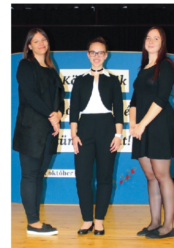
Az év aktív fiataljai

Aktívan részt vesz a település kulturális életében. Rendezvényeken számos alkalommal közreműködik versmondással, konferálással, szervezéssel egyaránt. Mindemellett egyházi ünnepeken büszkén magára ölti a rimóci népviseletet, ezzel elkötelezettségét mutatva szülőfaluja felé. A település iránti odaadása, aktivitása és szorgalma példaértékű lehet a többi fiatal számára, ezért érdemesnek tartottuk őt „Az év aktív fiatalja” díjra.