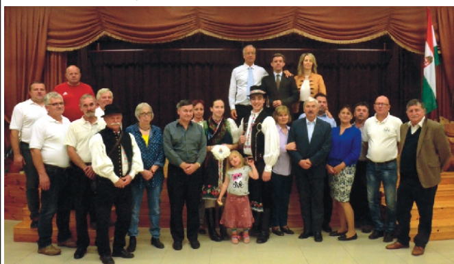
A konferencia résztvevői és közreműködői az SZJSZ tagjaival