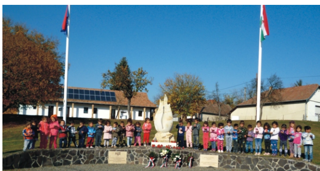
Kicsi méces kezünkben, így emlékeztünk a hősökre