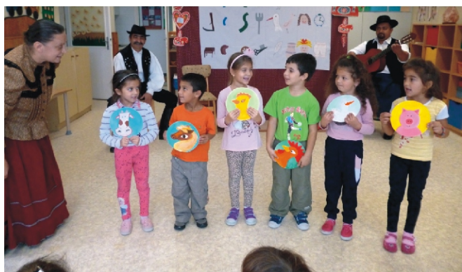
A meseelőadásban a gyerekek is részt vettek