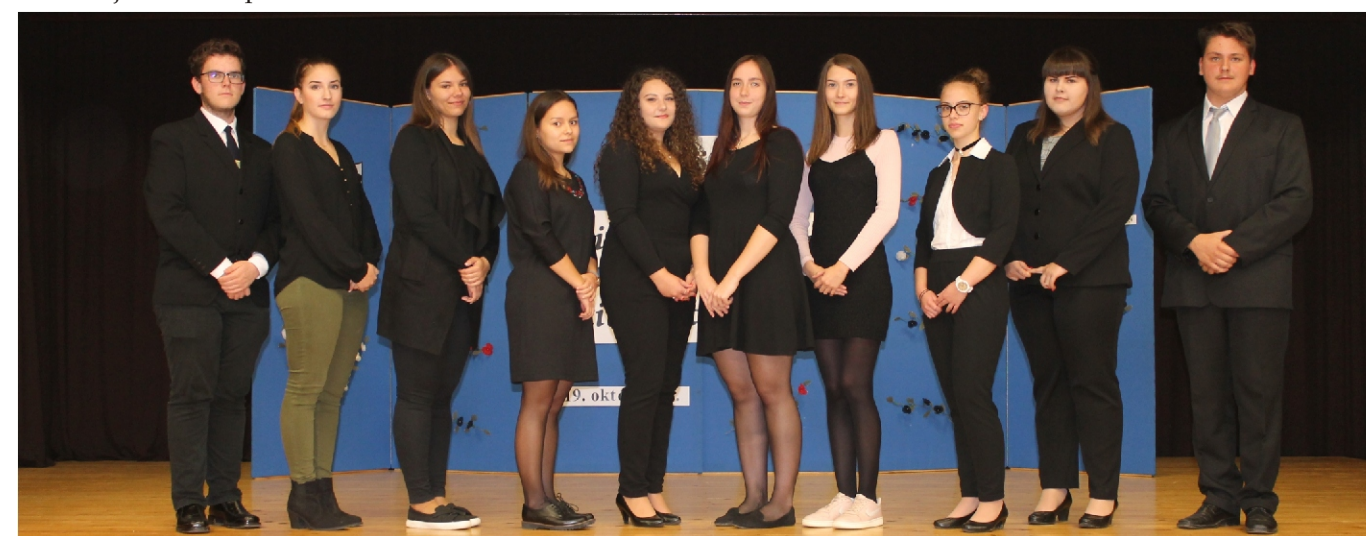
Rimóc Község díjazottjai