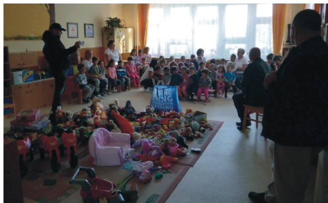
Első találkozás az örökbe fogadóinkkal