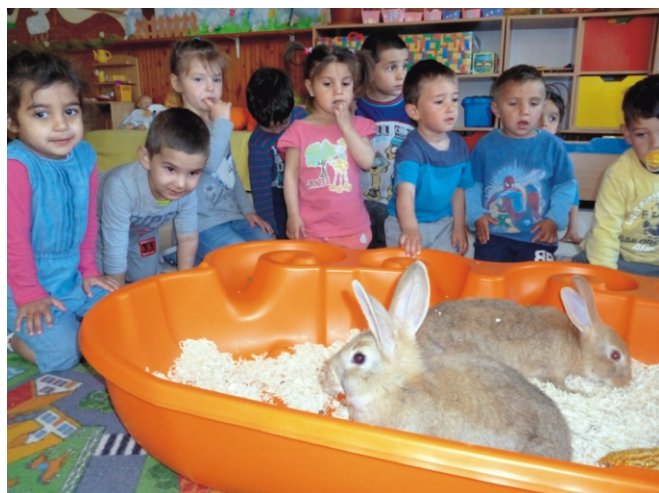
Barátaink az állatok