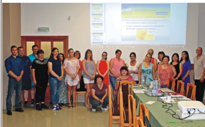
A májusi interaktív előadás résztvevői