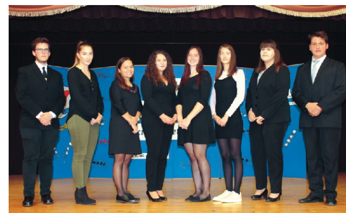
Rimóc Község Jó Tanulói