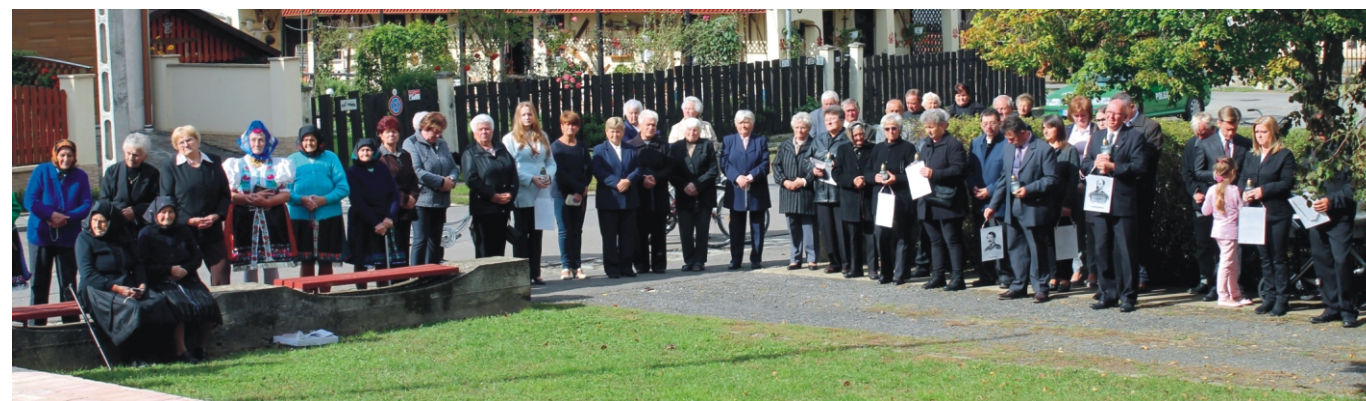
A résztvevő megemlékezők