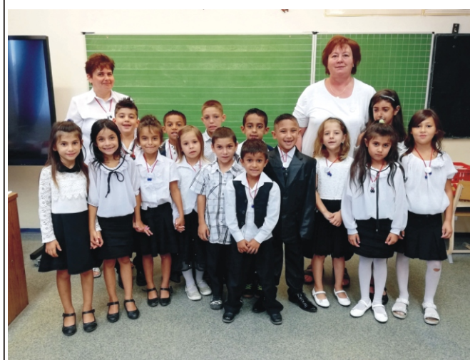
Az 1. osztály Ági tanító nénivel és Gizike tanító nénivel

A MédiaTanács Magyar Média Mecenstúra programjának támogatásával az IKON STÚDIÓ bemutatója