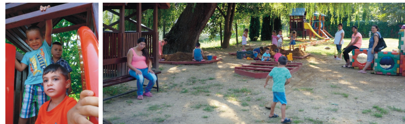
Játék közben könnyebben alakulnak ki a barátságok