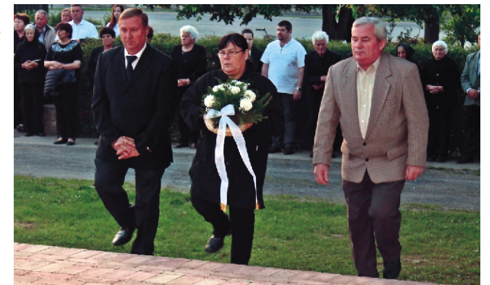
Az Egyházközség Képviselő-testülete koszorút helyez el az Emlékműnél