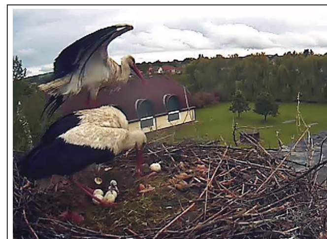
Kelnek a kis gólyák a rimóci fészekben

„Elcsitult a szív, mely értünk dobogott, Pihen a kéz, mely értünk dolgozott. Számunkra Te sosem leszel halott, Örökké élni fogsz, mint a csillagok.”