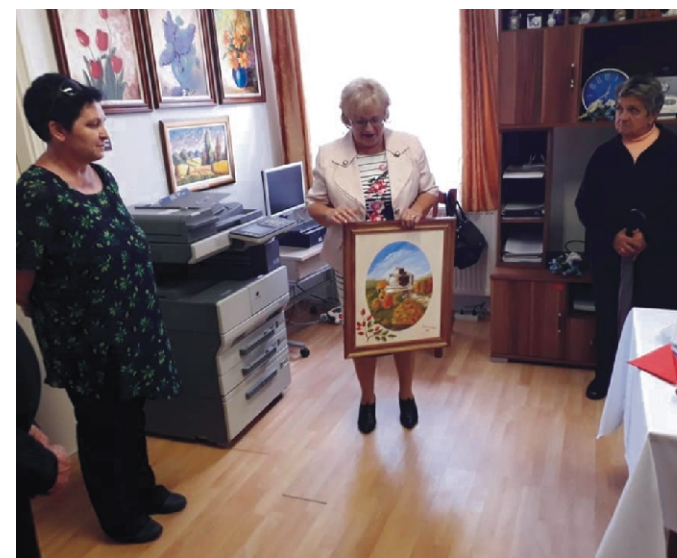
Képes beszámoló a kiállítás megnyitóról