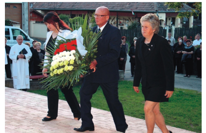
Az Önkormányzat koszorúval tisztelgett a Hősök előtt