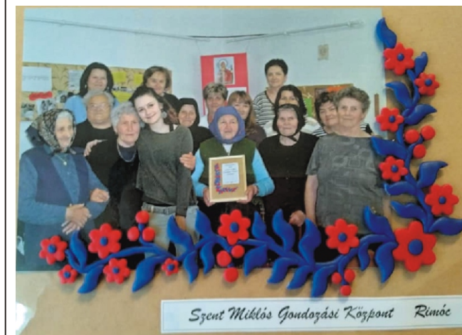
Szent Miklós Gondozási Központ Rimóc