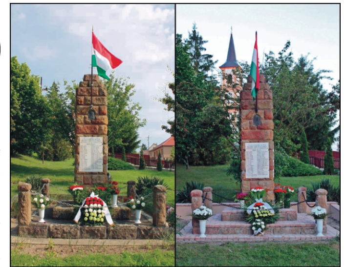
Régi és felújított Emlékmű