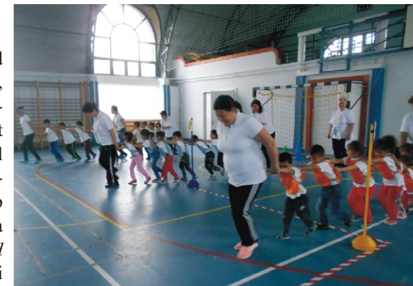
Indulhat a csapatverseny!