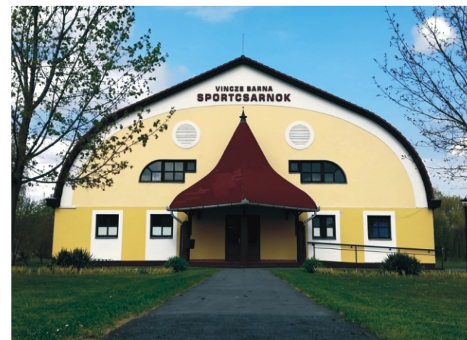
Nevet kapott a rimóci sportsarnok