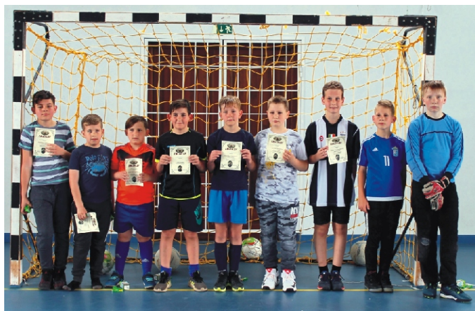
Gyermek labdarúgó mérkőzésekkel indult az emléknep