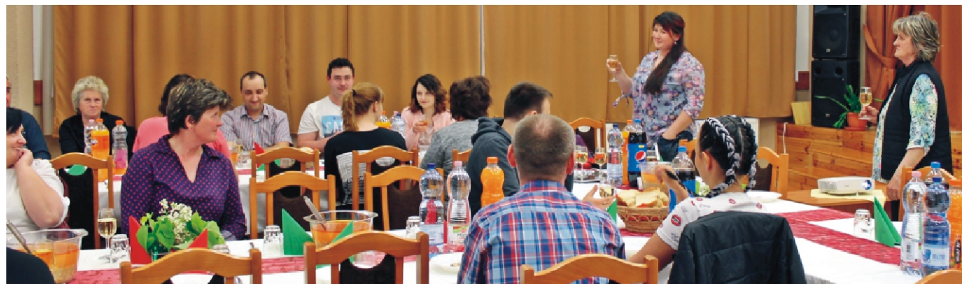
Pezsgővel ünnepeltük a születésnapot