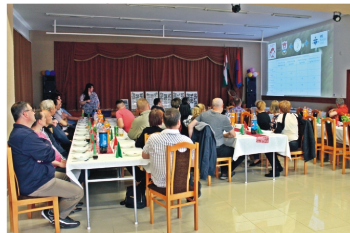
Az 5 éves visszatekintő közben