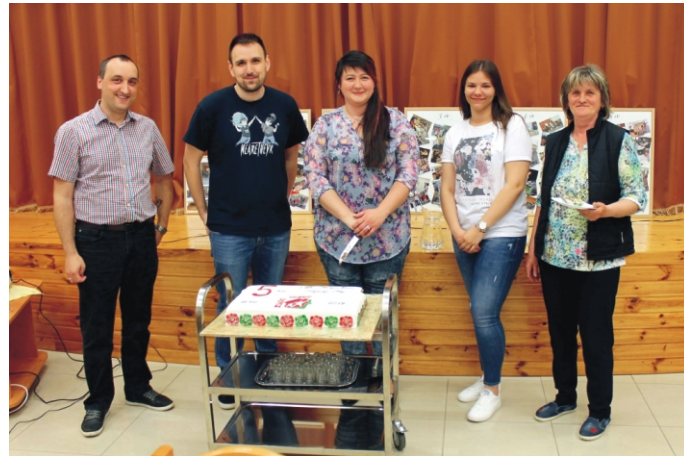
A mindenkori IKSZT dolgozók