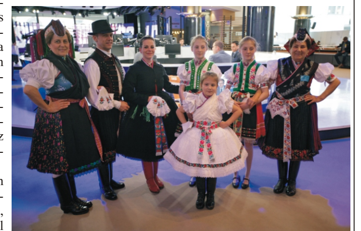
Palócok az EU Parlamentben