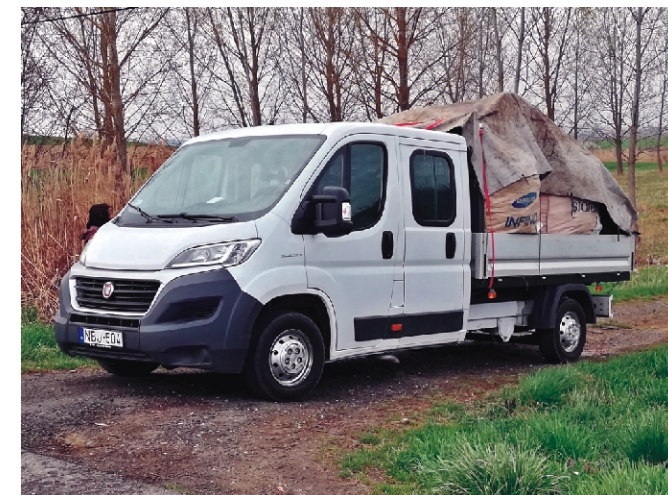
Az Önkormányzat új gépjárművel gazdagodott a Közfoglalkoztatási-programnak köszönhetően