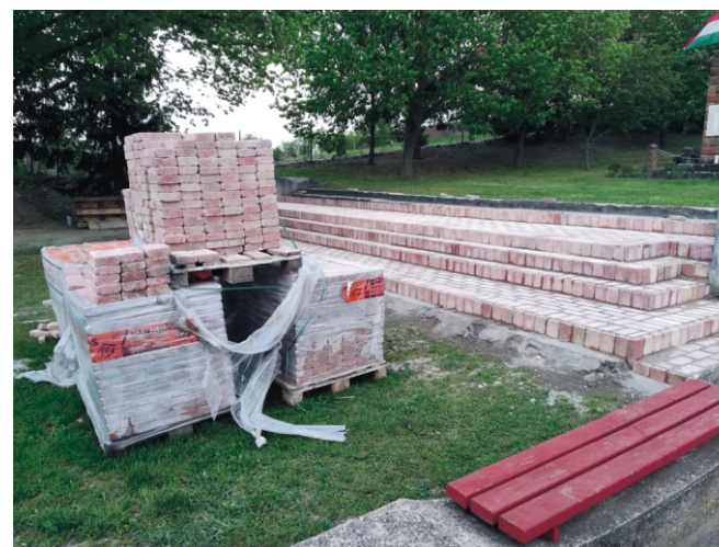
Hősök Tere felújítás