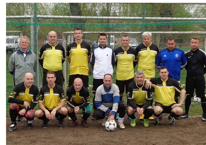
Győztes csapat - Rimóc Senior