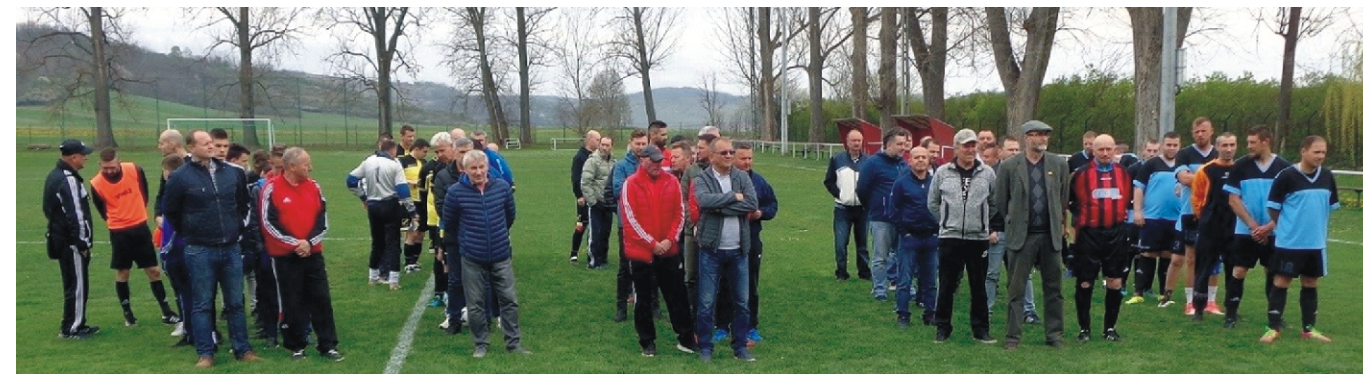
Az Emléktornán résztvevő csapatok

Barna egészségi állapota további romlásával sportsteretete, munkája nem csökkent, szinte mindeneként végezte a labdarúgás ügyeit. Nem szerette a sok beszédet, a tettek embere volt. Nagy türelemmel, megértéssel, jó közösségi vezetéssel nevelte ifjú focistáinkat.