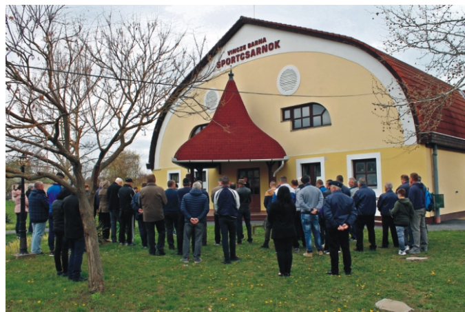
A névadó ünnepség résztvevői