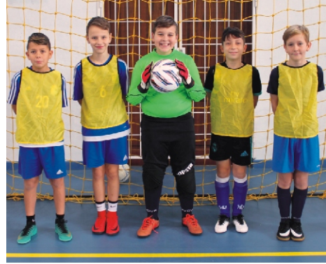
Junior Tapsi-Hapsi Kupa 2. helyezett: Chelsea