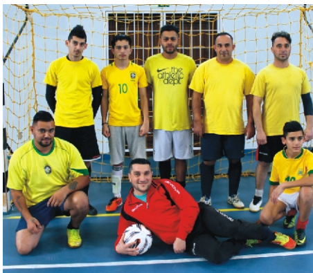
Tapsi-Hapsi Kupa 1. helyezett: Brazilok