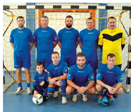
Profi Rimóc Kupa 3. helyezett: Vaszelo