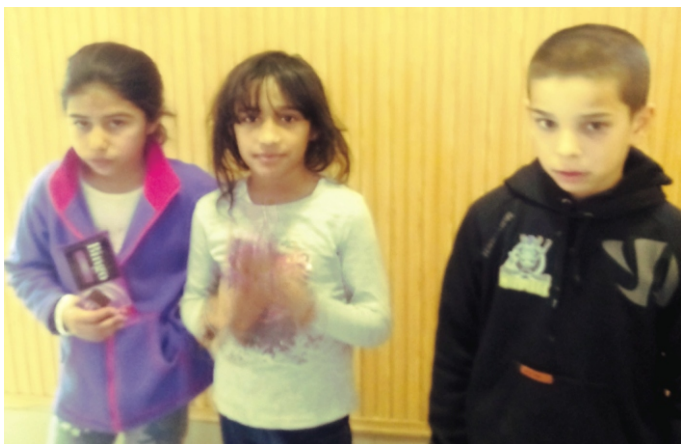
Rejtvényfejtők győztes csapata