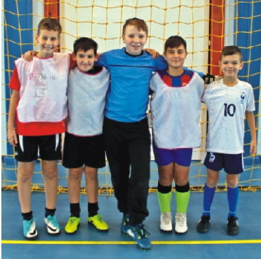
Junior Tapsi-Hapsi Kupa 1. helyezett: Juventus