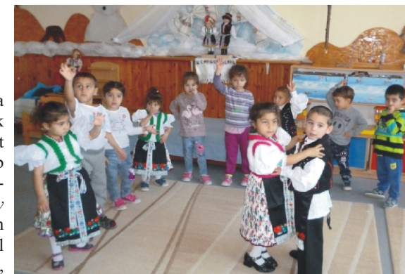
A legkisebbek is megismerték a rimóci csárdás alaplépéseit