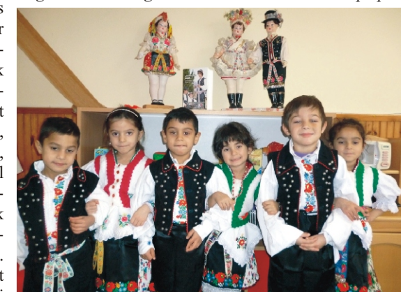
Mindig rácsodálkozunk a rimóci népviselet szépségére