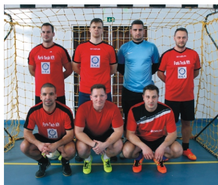
Profi Rimóc Kupa 2. helyezett: Royal Guards