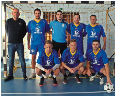
Profi Rimóc Kupa 1. helyezett: Dolce Vita