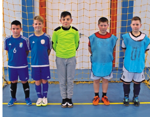
Junior Tapsi-Hapsi Kupa 3. helyezett: Argentína