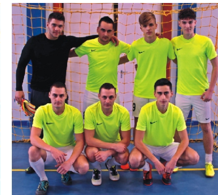
Tapsi-Hapsi Kupa 2. helyezett: Duracell