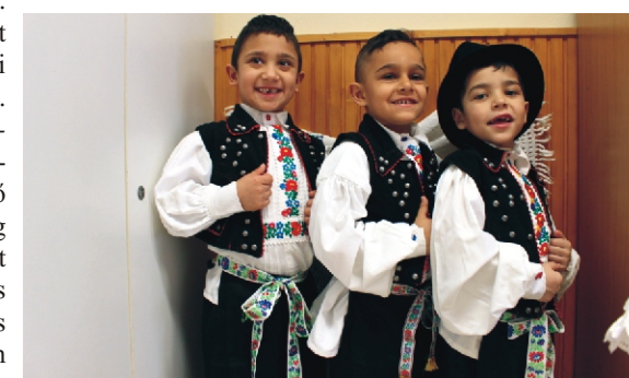
Célunk, hogy pozitív érzelmi kötődés alakuljon ki bennük a néphagyomány iránt