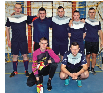
Tapsi-Hapsi Kupa 3. helyezett: Nyúl York