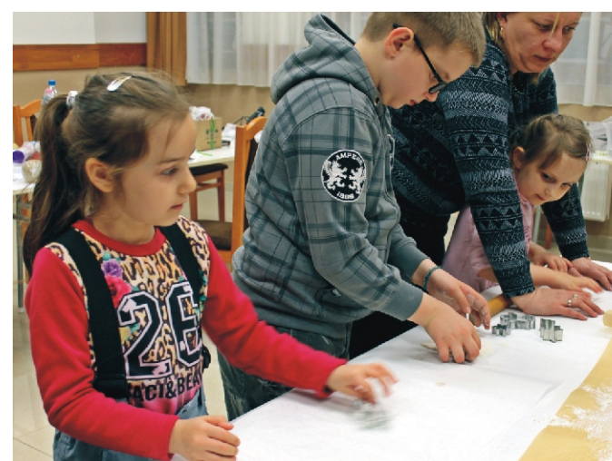
Készülnek a karácsonyfa díszek