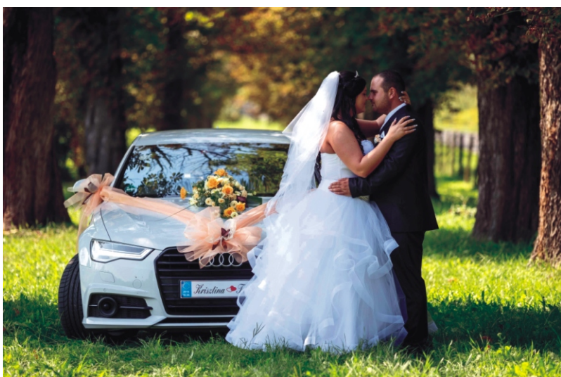
Rigó Krisztina és Rein Tamás 2018. szeptember 8.