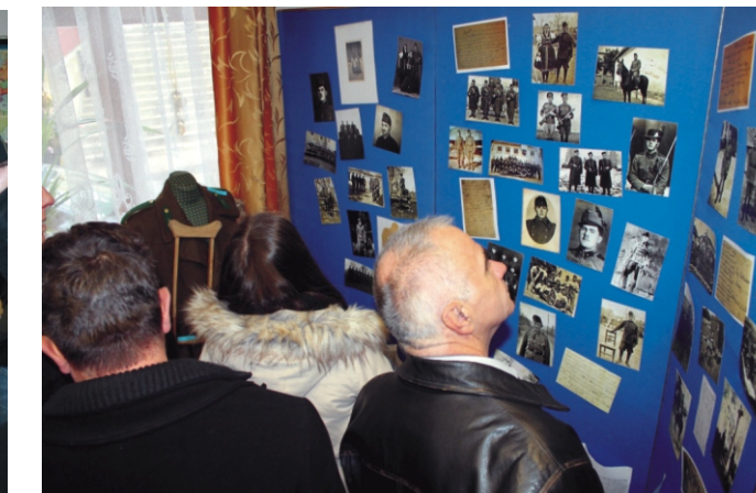
A kiállítás érdeklődői