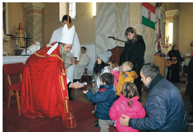
A templomba megérkezett a Mikulás