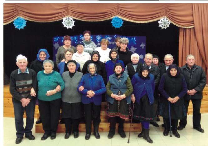
A Szent Miklós Gondozási Központ karácsonyi műsora