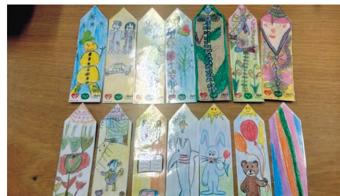
Boldog iskola - a kész ajándék könyvjelzők