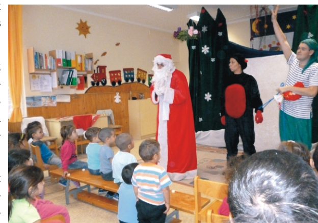
A gyerekek nagy meglepetésére megérkezett a „mesebeli” Mikulás