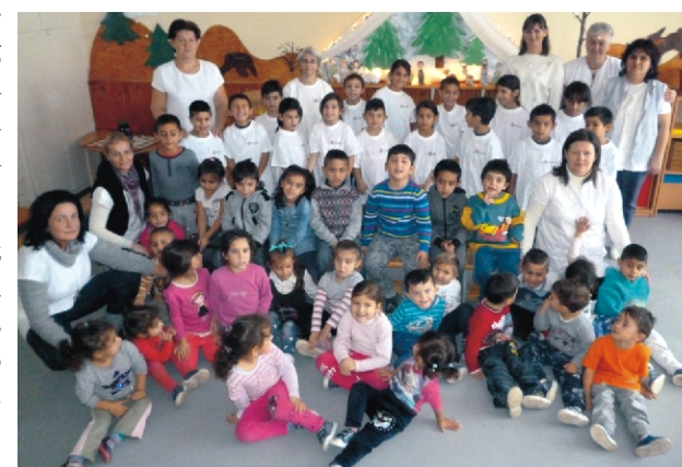
Karácsonyváró délelőtt az iskolásokkal