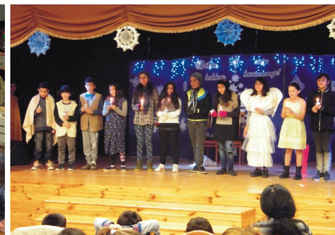
Iskolai karácsonyi műsor