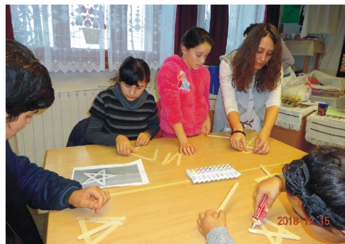
Karácsonyváro kézműves foglalkozás