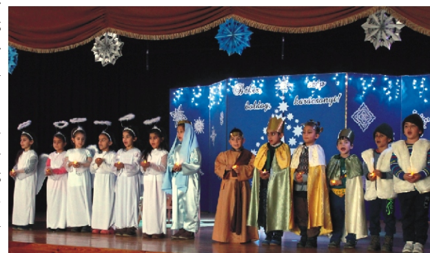
Az ünnep fénypontja a nagycsoportosok betlehemes műsora