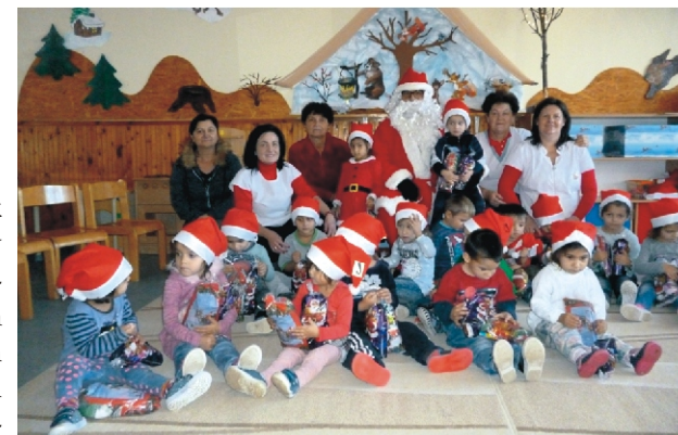
„Krumplucukor, csokoládé, jaj de jó, de a virgács jó gyereknek nem való...”

Nagyon örültünk, hogy a hagyományokat tovább ápolva az első osztályos gyerekek adventi hangulatú versekkel, dalokkal lepték meg az óvodásainkat. Hálánk jeléül meleg teával és mézespuszedlivel kínáltuk meg őket. Köszönjük a felkészítő tanárainknak a színvonalas előadást, amivel még meghittebbé, szeretetteljesebbé tették számunkra az ünnepet.