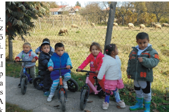
De jó, hogy ilyen közel jönnek a báránykák!