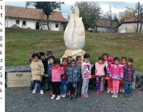
A középsős gyerekek mécses gyűjtanak az emlékműnél