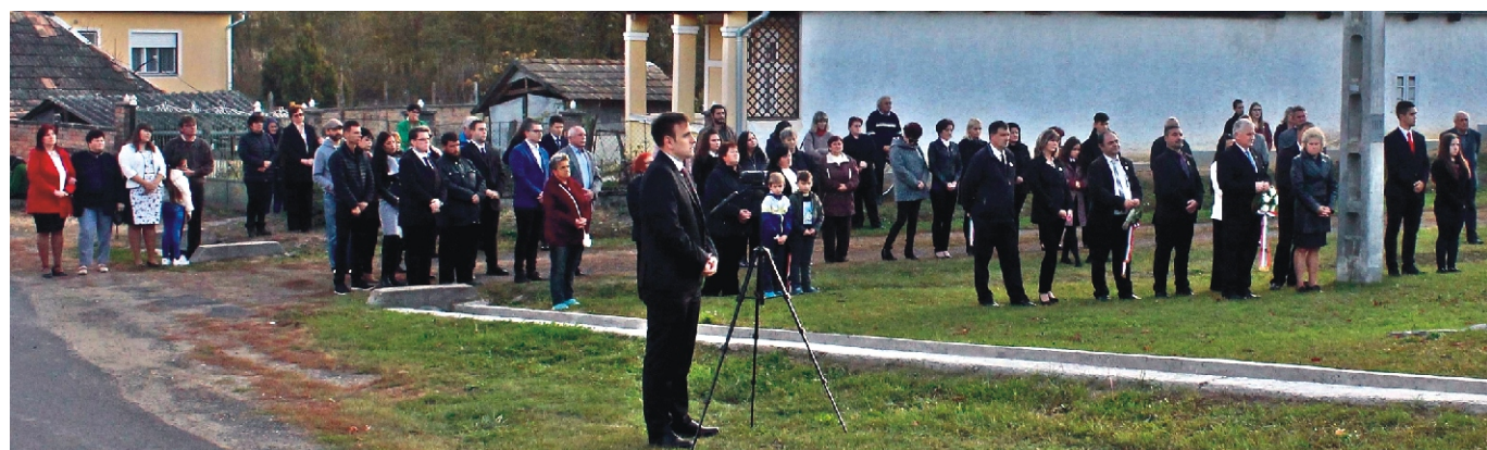
A résztvevő megemlékezők