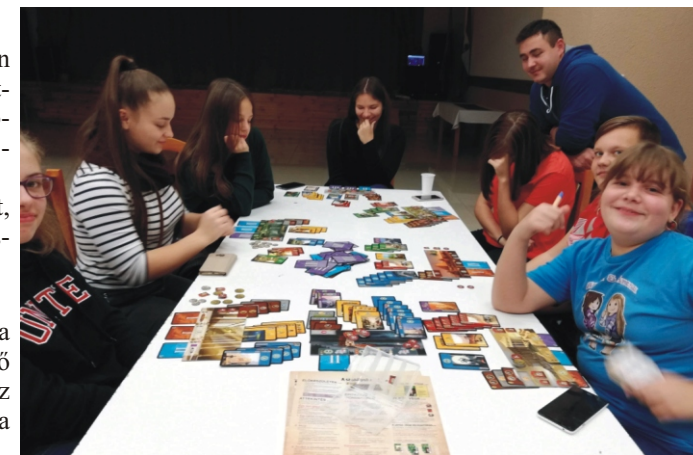
Ha őszi szünet akkor társasjáték

Már most fut a TV programja, megy benne a képűtség, viszont sajnos Salgótarjából még nem küldik vissza hozzánk az adást. Erre még várunk kell, reméljük már nem sokáig. A Rimóc TV minőségéről annyit kell tudni, hogy jelenleg a digitális átállás előtti (áprilisi) minőséget tudjuk produkálni, de már erre is folynak tárgyalások, hogy javítani tudjuk ezen. A javítás érdekében (ne ugráljon, élesebb legyen a kép, stb.) ismét több százezer forintot kell kifizetnie az Önkormányzatnak, ami tovább növeli a már amúgy sem alacsony Rimóc Tv beüzemelésének költségét. Bízunk benne, hogy hamarosan mindenkinél, jó minőségben lesz fogható a Rimóc TV. A TV beüzemelését és működését Ön is támogathatja a Rimóc Községért Alapítványon vagy az Önkormányzaton keresztül. BVÁ