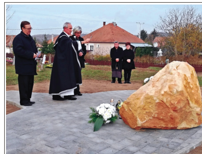
Az Emlékmű megszentelése