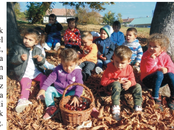
Mennyi gesztenyét szedtek a kicsik!