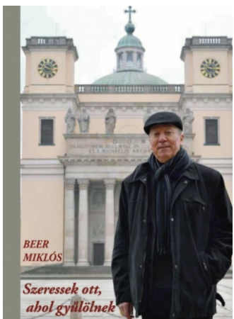
Az interjúkötet első,