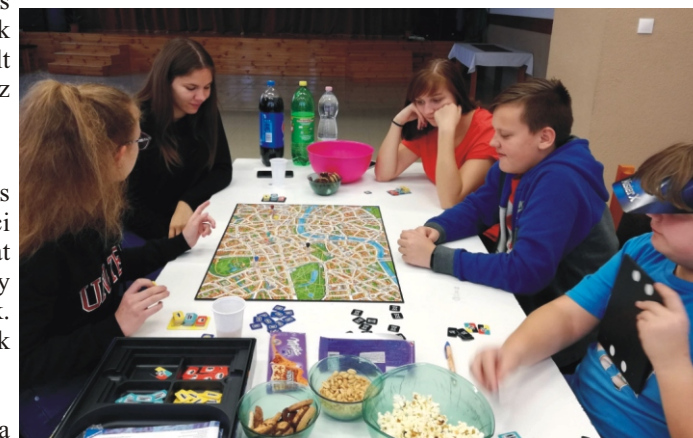
Scotland Yard - Végül meglett Mr X