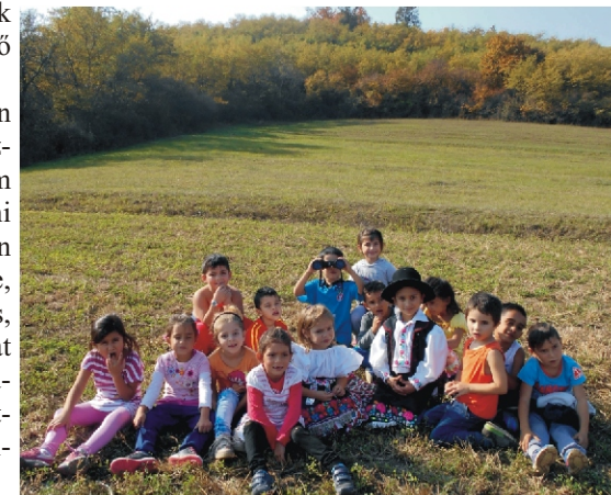
A nagycsoportosok hallgatják mit üzen az erdő