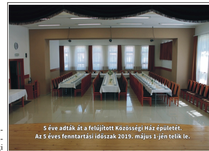
5 éve adták át a felújított Közösségi Ház épületét. Az 5 éves fenntartási időszak 2019. május 1-jén telik le.