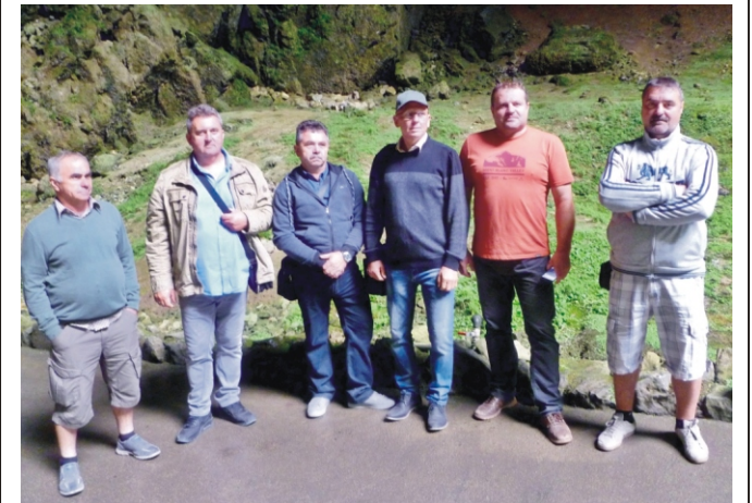
A rimóci delegáció