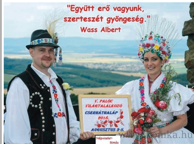
"Együtt erő vagyunk, szerteszét gyöngeség." Wass Albert