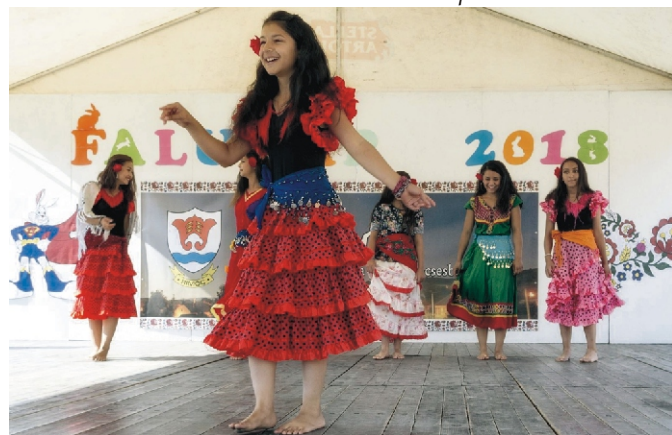
Rimóci Vadrózsa Cigány Táncsoport