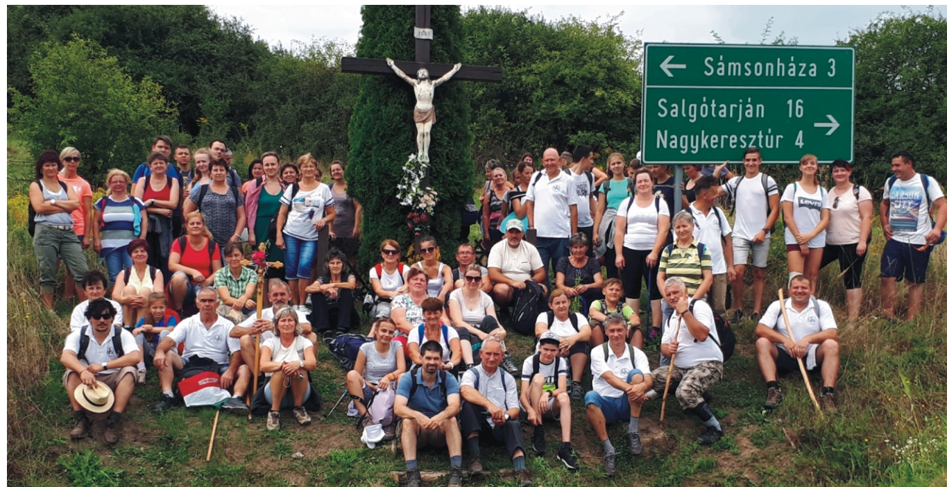
A szentkúti gyalogzarándokok „szokásos” csoportképe Márkházánál