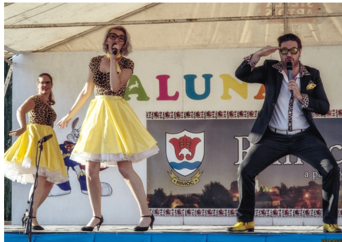
Miki Niki és a Csibabák