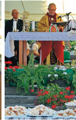
József Atya megáldja az új kenyeret