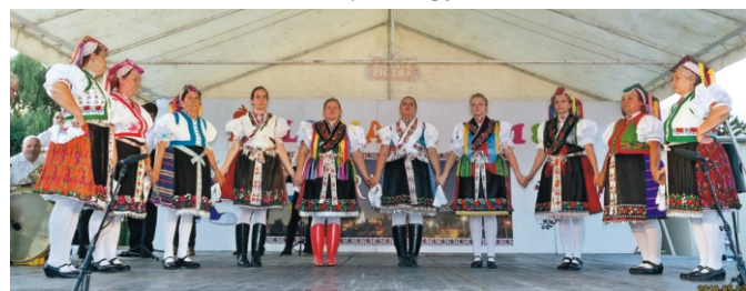
Rimóci Hagyományörző Együttes