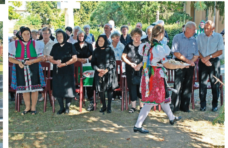
Az új kenyér körbekínálása