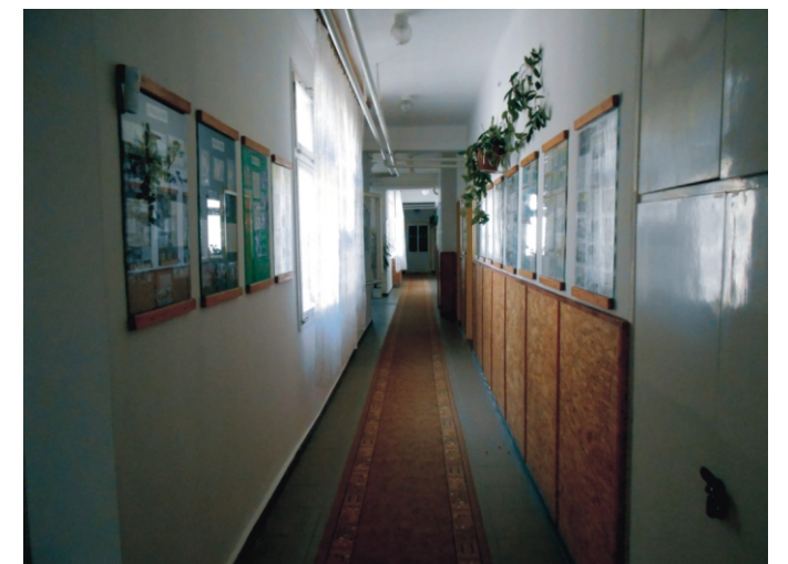
Szükség van az épületünk folyamatos karbantartására