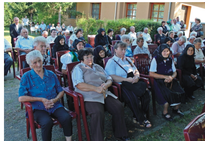
Az ünnepi szentmisén résztvevők