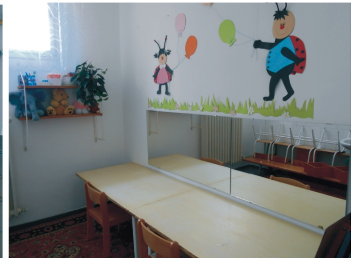
Az óvodai fejlesztő szobánk is megszépült a nyáron