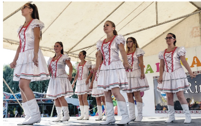
Csini-Tini Mazsorett Csoport