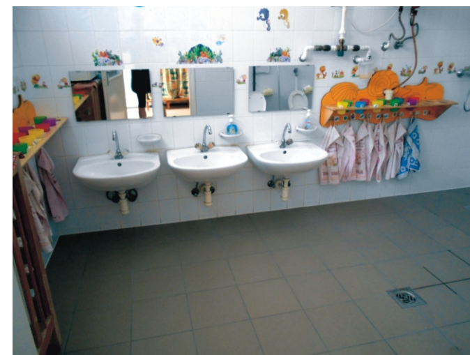
Tágas és higiénikus mosdó várja a „cseresznye”, nagycsoportos gyerekeket