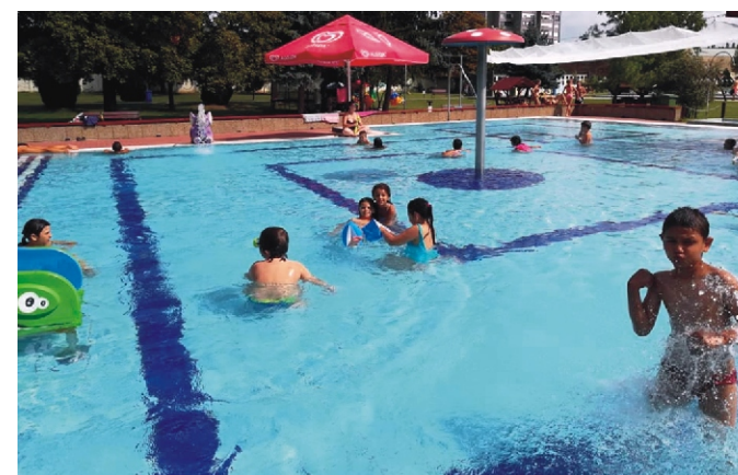
A gyöngyösi strandon