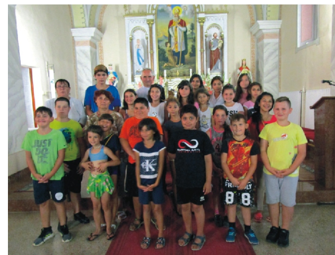
Akik végig kitartottak