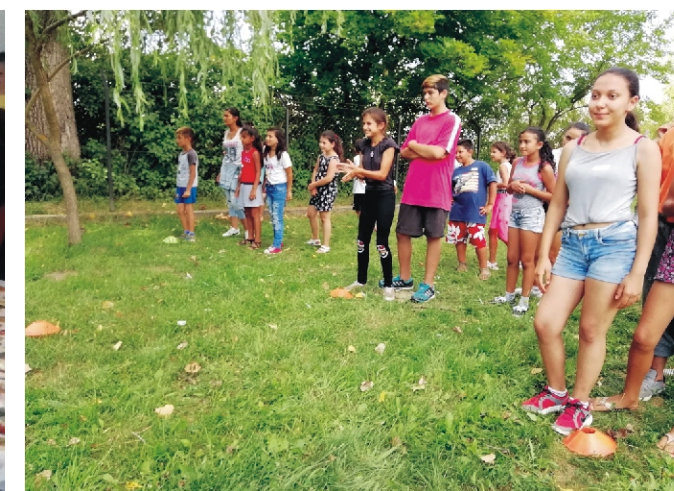
Készülnek a csapatok a versenyre