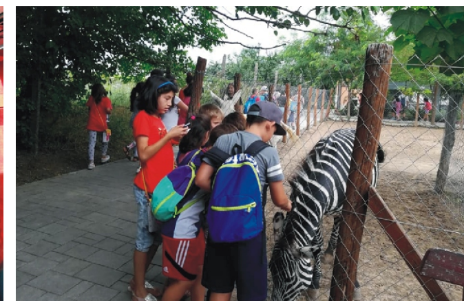
A gyöngyösi állatkertben