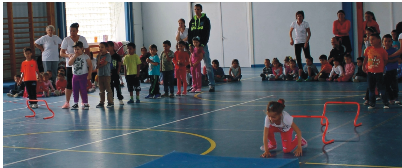
Együtt mozogni jó!

A Nyulacska Óvoda nagycsoportos óvodásai 2018. június 8-án pénteken 15 órakor búcsúznak óvodájuktól. Ballagási ünnepélyünkre sok szeretettel várjuk.