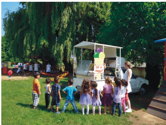
Eper, csoki, vanília fagy

A Nyulacska Óvoda nagycsoportos óvodásai 2018. június 8-án pénteken 15 órakor búcsúznak óvodájuktól. Ballagási ünnepélyünkre sok szeretettel várjuk.