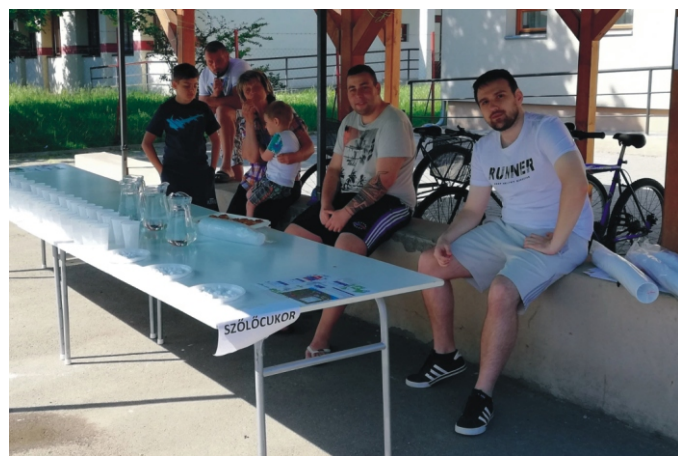
Helyi rendezők egy része