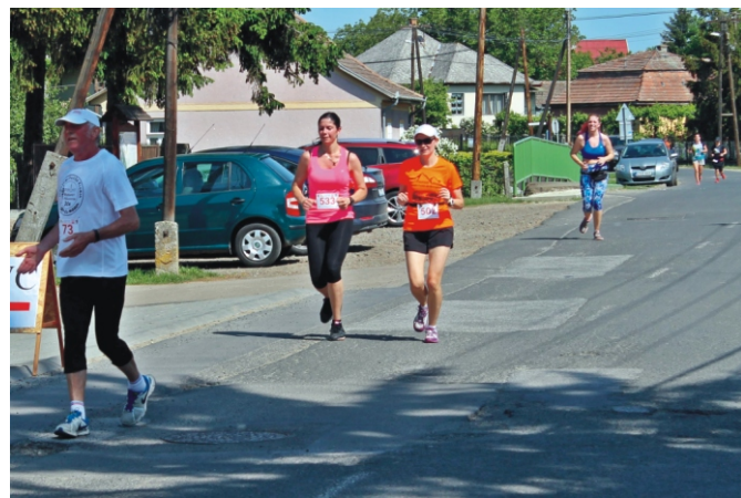
Két Vár Futás résztvevői