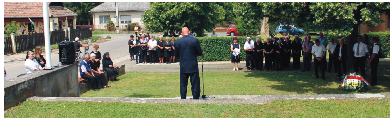
A résztvevő közösség