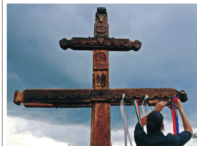
A rimóci szalag is felkerül a Határkeresztre