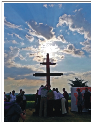
A Határkereszt Ipolytarnóc és Kalonda között került felállításra