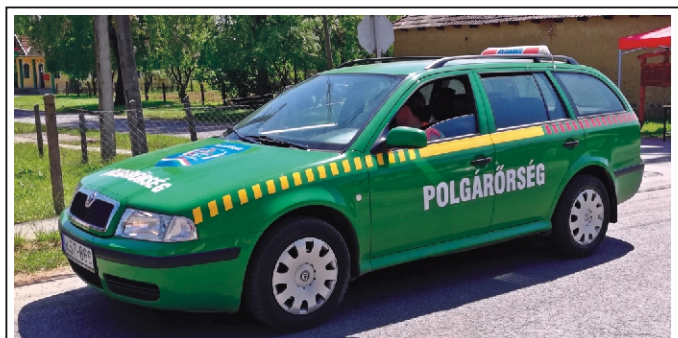
A Rimóc Polgárőr és Önkéntes Tűzoltó Egyesület a Nógrád Megyei Polgárőr Szövetségnek köszönhetően márciusban lecserélhette a szolgálati autóját.

érkezett meg erre a szakaszra. Köszönjük azoknak, akik elkerülték a verseny útvonalát. Valószínűleg – ebből tanulva – legközelebb a forgalom elől el kell zárunk az érintett útszakaszokat.