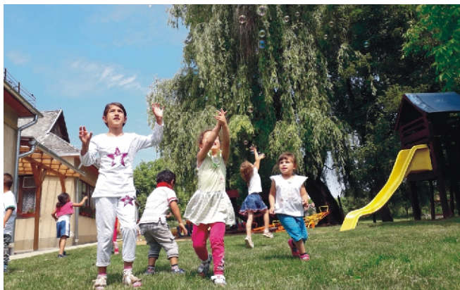
Móka és kacagás