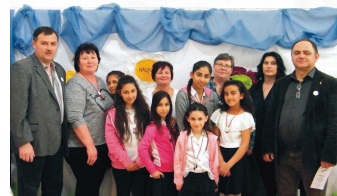
Diákok és felkészítő tanáraik