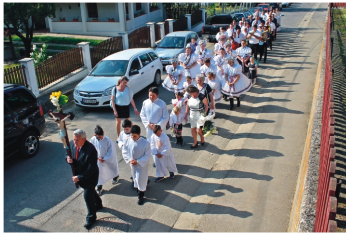
Felvonulás a plébániáról