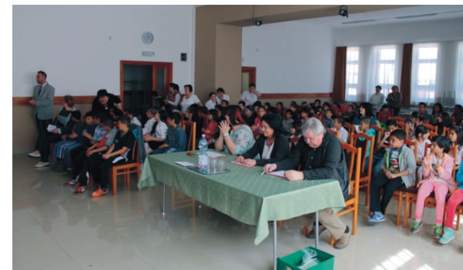
A zsűri munkában