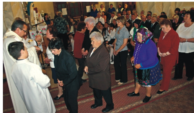
Áldozásra sorakoznak a hívek