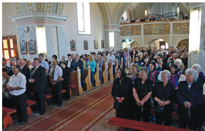
A jelenlévő hívek