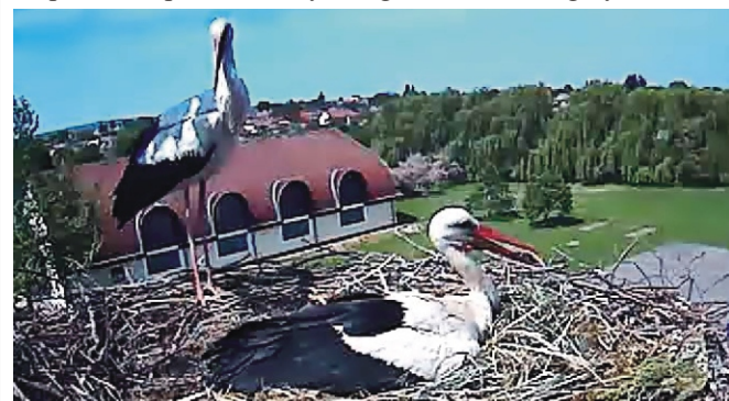
Ismét két gólya a fészeken

Jelenleg 5 tojást költenek a szülők, a közösségi oldalon többen aggodalmukat fejezték ki, hogy tudnak-e majd etetni ennyi fiókat, de bízunk benne, hogy minden rendben lesz majd, s szépen felcseperednek a nyár végére a rimóci kiscigolyák. BVÁ