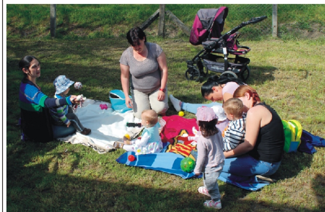
Baba-mama klub a Közösségi Ház mögött