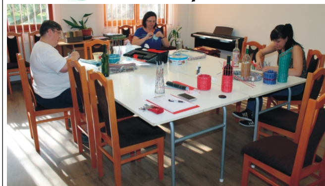
Már negyedszerre hirdettük meg a papírfontást