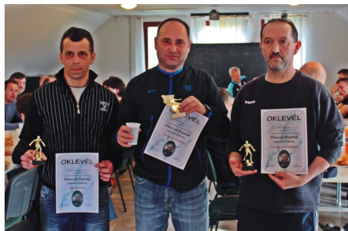
Az Emléktorna különdíjasai