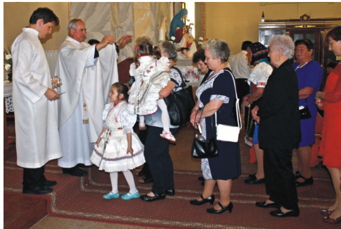
Az Aranymisés áldás