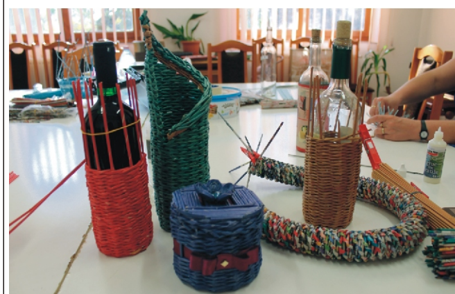
A kész és félkész alkotások