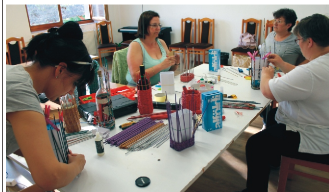
Az ötödik alkalom - új projektbe fogtunk