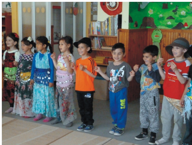
Az ovisok, mint kígyószzerű sárkány kapcsolódnak be a mesébe

Minden év áprilisának első hétvégéjén rendezik Magyarországon a Roma Kultúra Napját. Óvodánkban is szerveztünk programot ebben az időszakban. A hét folyamán többször elénekeltük a gyerekekkel a cigány himnuszt, a „Zöld az erdő, zöld a hegy is...” kezdetű dalt, meghallgatunk régi és új hangszerelésű cigányzenét, melyekre az ovisaink bátran táncolhattak is. Képekről való beszélgetés során felelevenedtek az ősi mesterségek, a vándorlással kapcsolatos életmód, a népviselet. Az esemény lezárásaként összegyűlt mindhárom csoport, a nagycsoportos gyerekek táncos bemutatót tartottak, melynek végén mindenki bekapcsolódhatott a mulatozásba. Meglepetésként pedig cigány bodagot is kaptak a gyerekek, mint egy igazi vendégségben.