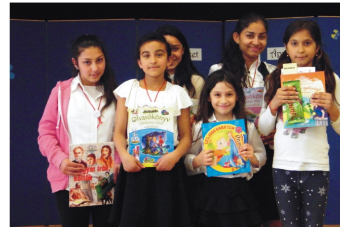
A díjazott tanulók