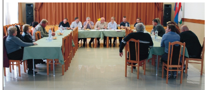
A Nyilvánosság napi résztvevők