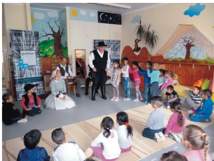
Felkészültek a táncrea a nagycsoportosok