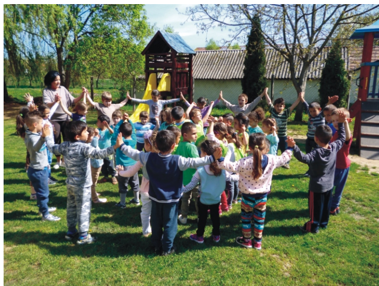
A Föld az otthonunk, védjük meg együtt

Április 22-én van a világon a Föld Napja. Talán nem véletlenül került a tavasz közepére ez a környezetvédelmi jeles nap, hiszen olyan gyönyörű ilyenkor a természet. Ám ezt a szépséget nekünk, embereknek kell megőriznünk, és ezt igyekszünk a gyerekekkel megértetni. Megmutatjuk a kicsiknek, hogy mi is sokat tehetünk, ha nem dobjuk el a szemetet akárhová, csakis a kukába, vigyázunk a környezetünk növény- és állatvilágára, úgy, hogy megfigyeljük, de nem bántjuk azokat. Csoportonként virágokat ültettünk a gyerekekkel egy-egy ládába, ezeket az ovisok bevonásával gondozzuk, vigyázzuk. Idén is csatlakoztunk a „Jobb Veled a Világ! Énekelj a Földért!” kezdeményezéshez, Bagdi Bella Gyűjts egy gyertyát a Földért című dalának közös meghallgatásával.