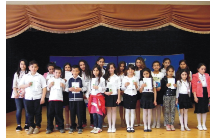
A résztvevő tanulók