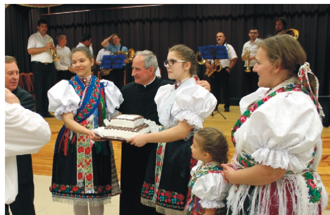
Tortával köszöntötték az atyát