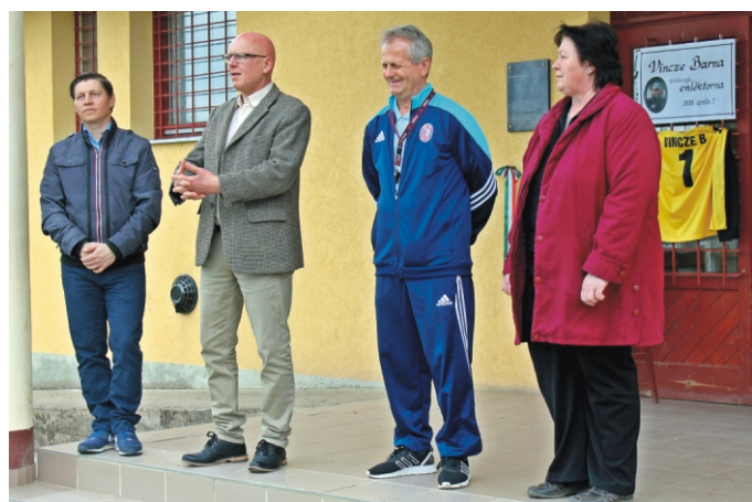
Megemlékezéssel kezdődött a torna