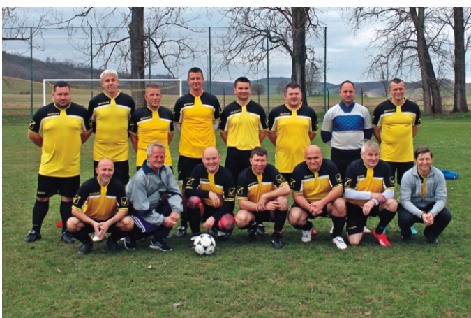
Rimóc Öregfiúk csapata