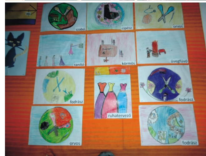
Pályaeorientációs nap az iskolában