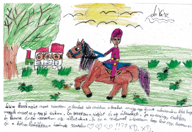
Mi leszek 5. osztályos rajz