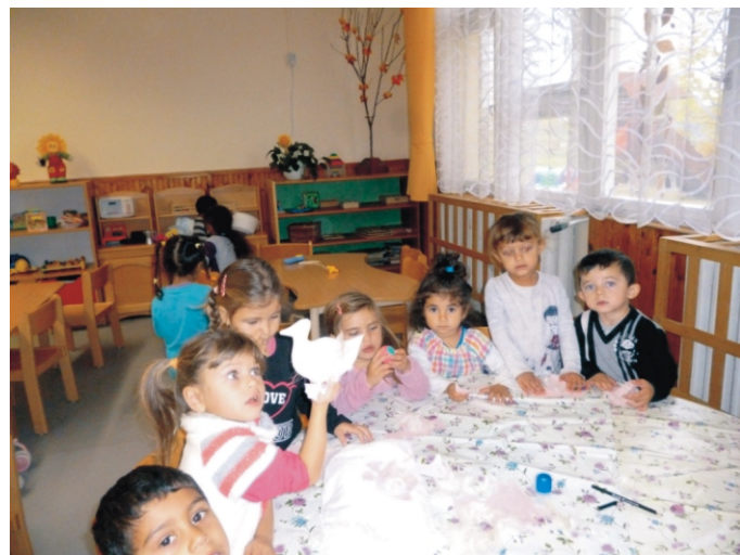
Készülnek a Márton napi kislibák

Ez a történet nagyon jó alkalmat ad arra, hogy elbeszéljünk a gyerekekkel arról, miért is jó dolog másoknak segíteni. Felidézünk olyan eseményeket, amikor a gyermekek ügyesek voltak és segítettek valakinek. A képek alapján történő mesélés által fejlődik a gyerekek emlékezete, gondolkodása, beszédalkotása, gyarapodik szókincsük, a jó példa közvetítése által Szent Márton legendájából tanulva is egy kicsit a „jót tenni jó” irányába tereljük a gondolataikat.