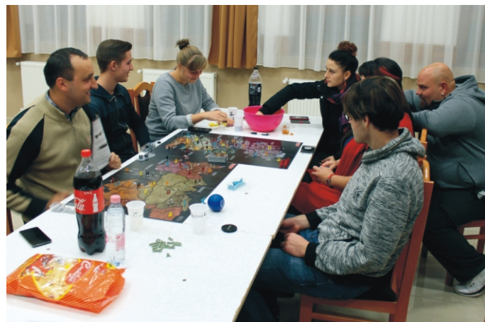
A nagy házak elfoglalták területeiket