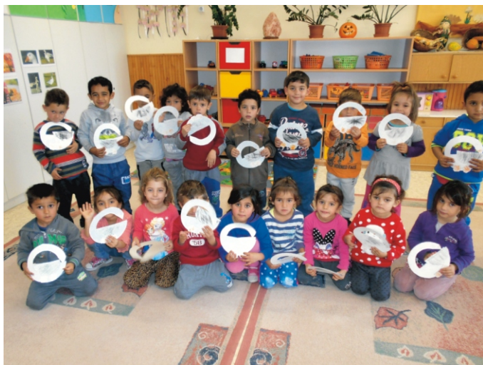
Márton napja a cseresznye csoportban