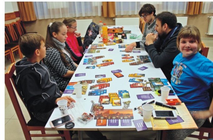
A 7 csoda maximum létszámmal

Már most tervezgetjük a téli szünetre a játék délutánt, reméljük, hogy a karácsonyi készülődés mellett többeknek lesz idejük az ilyen jellegű szórakozási, kikapcsolódási lehetőségre is.