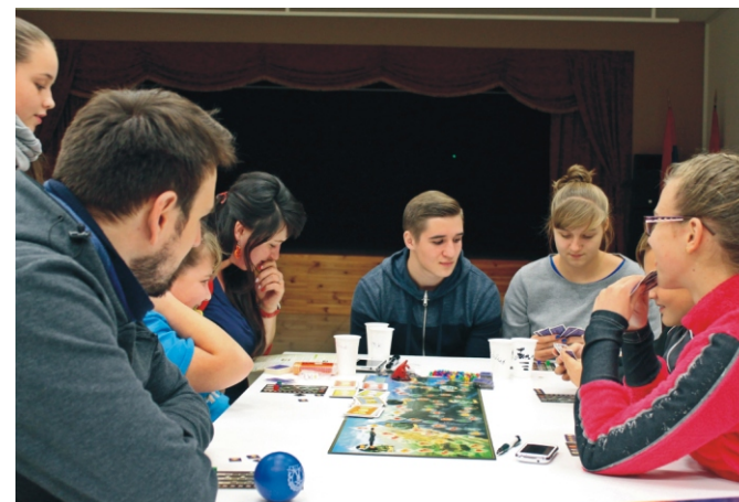
Megmentettük Tóvárost a Hobbitban