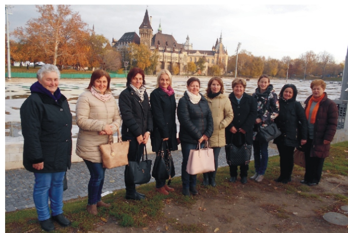
Csapatépítő kirándulásunk egyik állomása a Vajdahunyadváránál