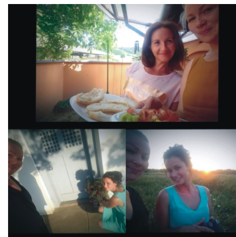
Nyársalás - Kápolna - Naplemente