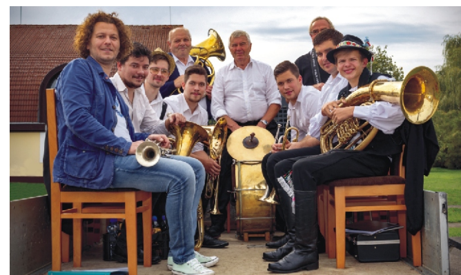
A Szüreti nélkülözhetetlen résztvevője a Rimóci Rezesbanda