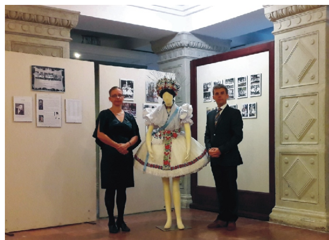
A Palóc Múzeumban