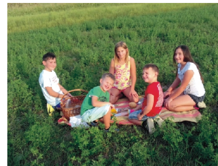
Kirándulás a rimóci határba