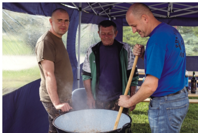
Fő a birkapörkölt a katlanban