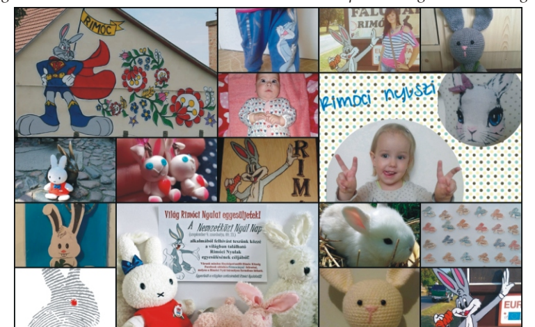
Az „egyesült” Rimóci Nyulak