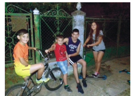
Kerítésalapon beszélgetni sötétedésig