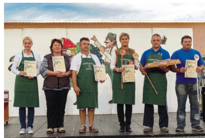
A X. Szüreti Főzőverseny csapatkapitányai