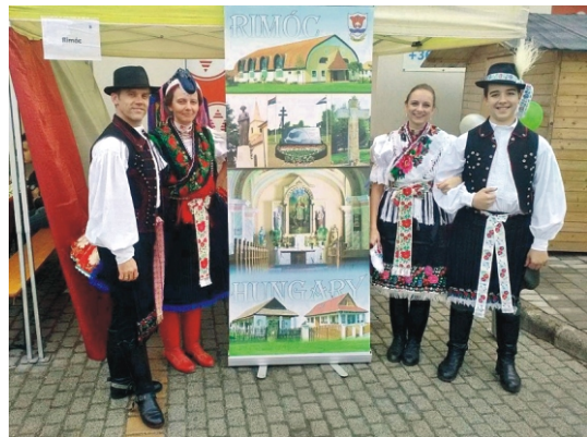
Rimóciak a Megyenapon