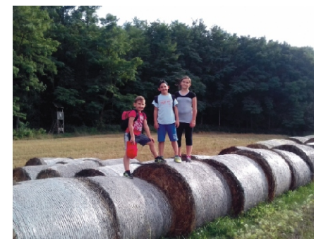
Ugrálás a szalmabálákon