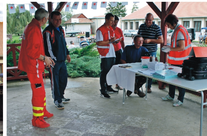
Egészségügyi szűrés a Pavilon alatt