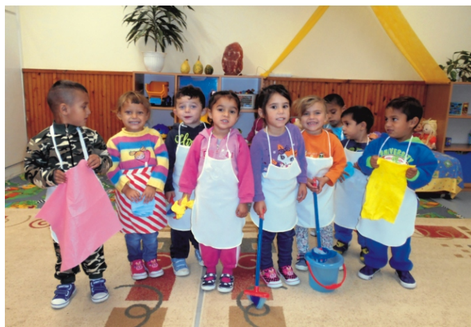
A legkisebbek is kötenyt kötöttek a takarításhoz