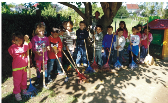
Ezen a napon még az udvarunkon is takarítottunk