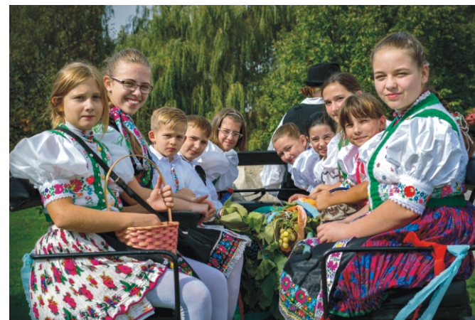
Szőlőslányok és népviseletes fiatalok