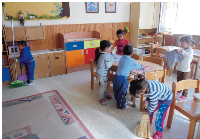
„Dolgozni szaporán...” munka közben a középsősök