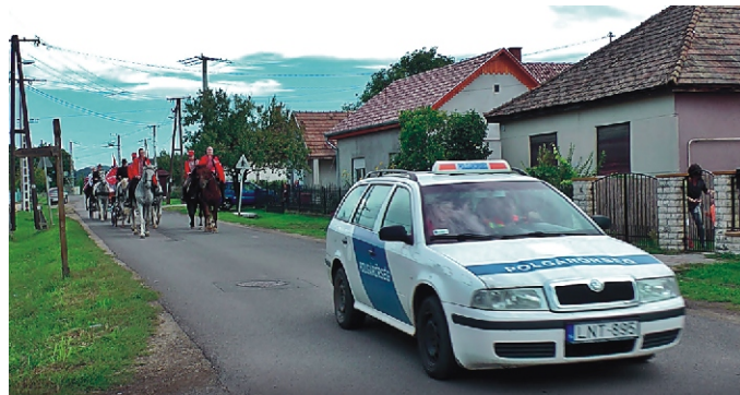
Polgárőr autó a Szüreti menet elején