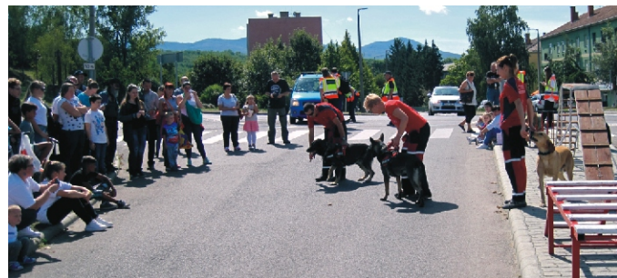
Nógrád Megyei Polgárőr Nap - kutyás bemutató