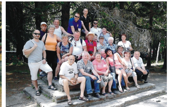
Az ország tetején - Kékestetőn