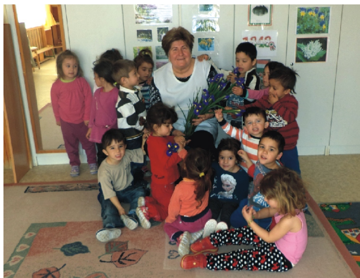
Utolsó nap a „cseresznye” csoportos gyerekekkel