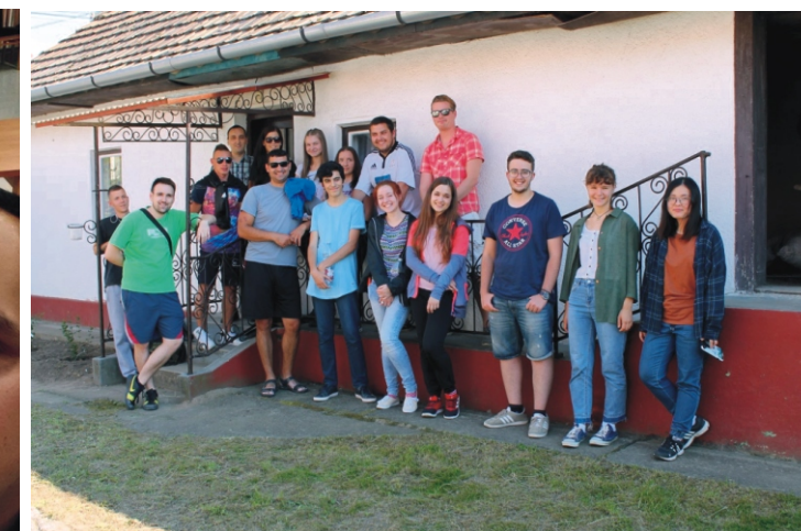
Csoportkép a Babamúzeumnál