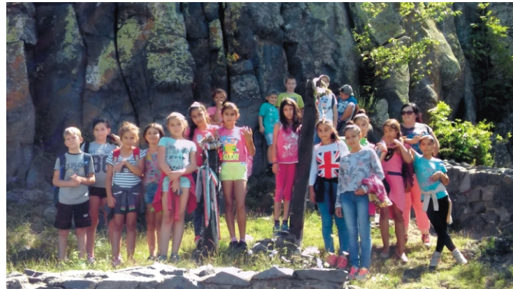
A salgói vár