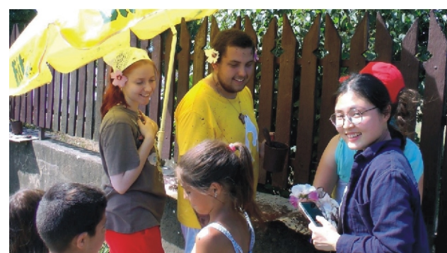
Vidáman telt a munka