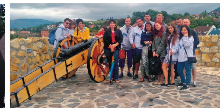
Egerben is jó volt