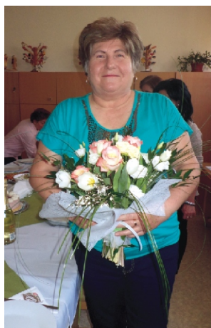
Eltelt 40 év!

„Kedves óvodám, sok vig nap után, Itt a búcsúnap....”