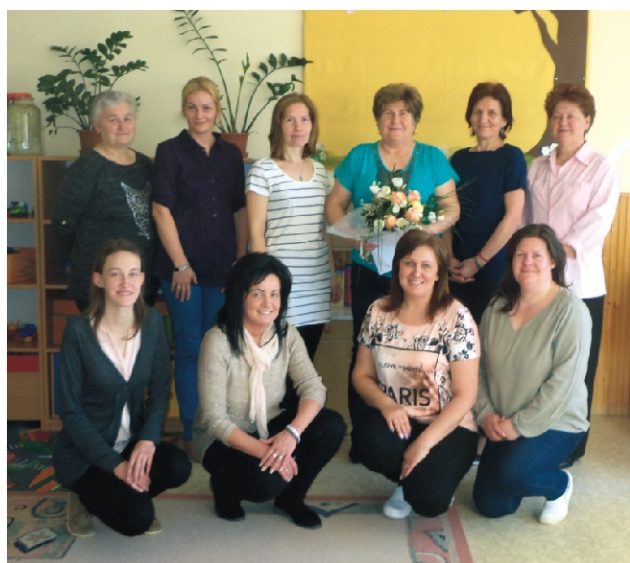
Búcsú az óvoda dolgozóitól