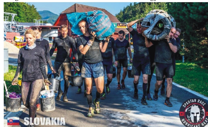
A Hurricane Heat-en a felszerelést 6 órán keresztül vittük magunkkal