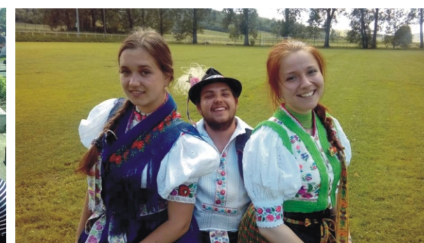
Felpróbálták a rimóci viseletet