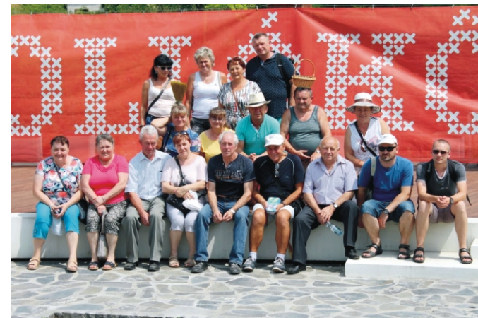
Hollókőben a szabadtéri színpadnál