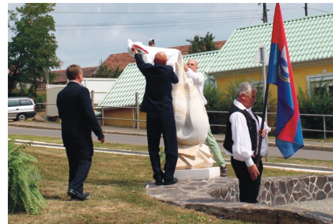
Az 56-os Emlékmű leleplezése