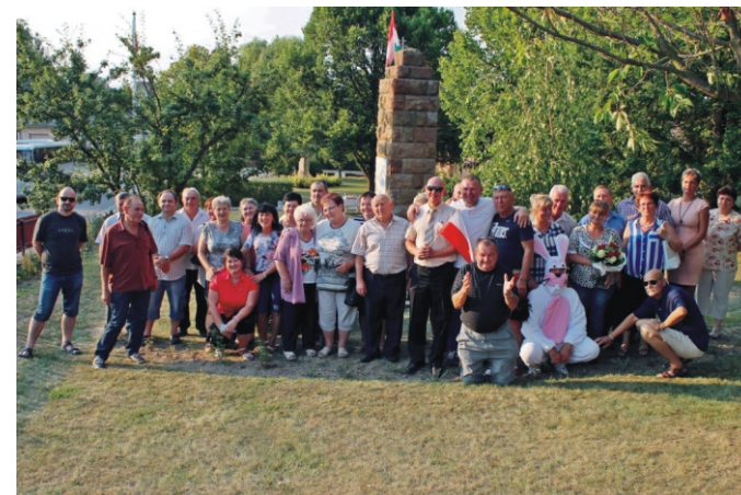
Lengyel barátainkkal a tőlük kapott fa előtt