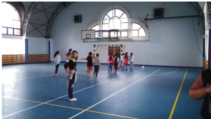
Foci a sportsarnokban