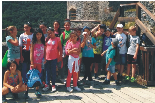
A somoskői várnál