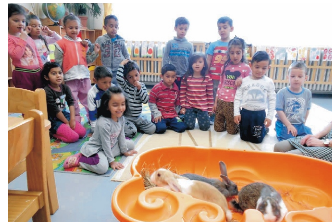
Nagy élmény volt a nyuszi simogatás