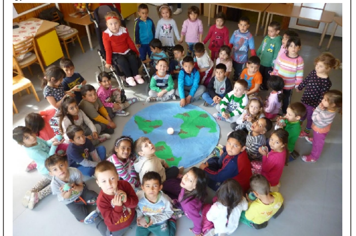
Együtt vigyázunk a Földünkre!

Az ének által a dalban megfogalmazott információk remélhetően tartósabban rögzülnek, bíznunk abban, hogy egy tisztességes világkép követésére irányítja a figyelmet. „LEGYÜNKA JEL, A REMÉNYSÉG, KIK VÁLTOZÁST HOZUNK!”