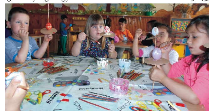
Készülnek a hímestojások