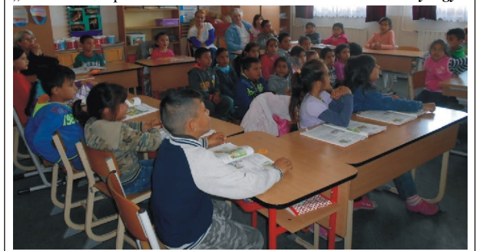
Az iskolai órán nagyon figyeltünk