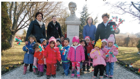
Kiscsoportosok első megemlékezése