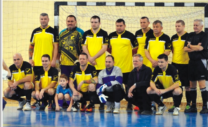
Rimóc Öregfiúk csapata a Pálmai József Emléktornán

Április 22. 15:00 SKSE - Rimóc Öregfiúk mérkőzés