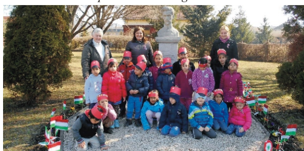
Így emlékeztek a nagycsoportosok