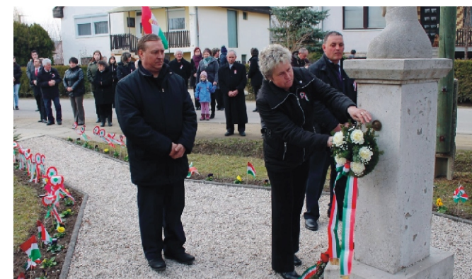
Rimóc Község Önkormányzata és az Óvoda képviselői koszorúzás közben