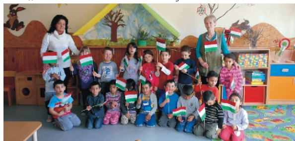
Középső csoportosok az ünnepre hangolódva