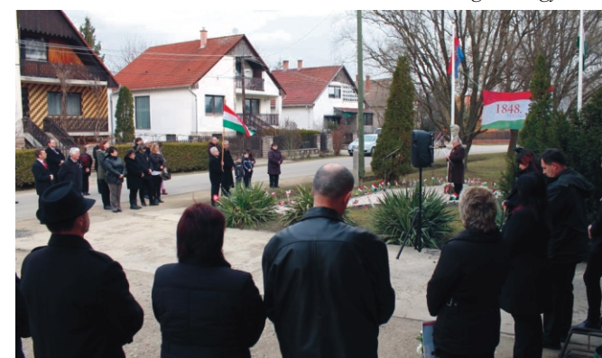
Az összegyűlt megemlékezők egy része