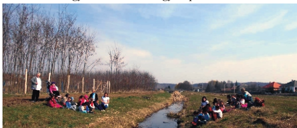
„Patak, hova fut a vized...”

„Zászlót készítettem rajzoltam, festettem, ahogyan csak tudtam legjobban, legszebben.”