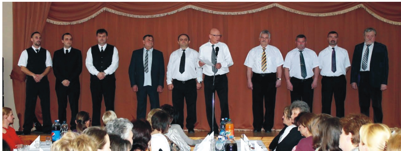
A Férfiak idén is kedveskedtek a településen dolgozó hölgyeknek