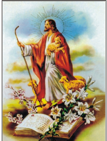
Kellemes húsvéti ünnepeket kíván a Rimóci Újság szerkesztősége!

S a másik vasárnap úgy pirkadat tájba \ kivirult a világ valamennyi fája, északi fenyőktől délszaki pálmáig mind üdén kizöldell, lombot hajt, virágzik, mert halottaiból Jézus im feltámadt ezen a Vasárnap!