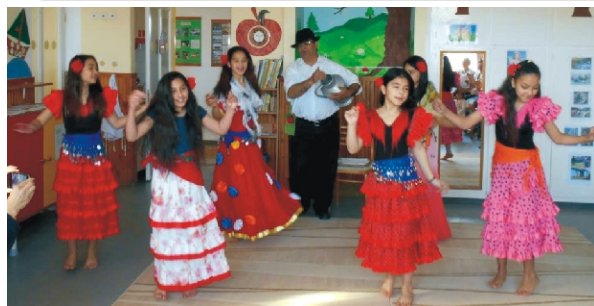
A „Verhetetlen Roma Tánccs Csajok” táncoltak nekünk