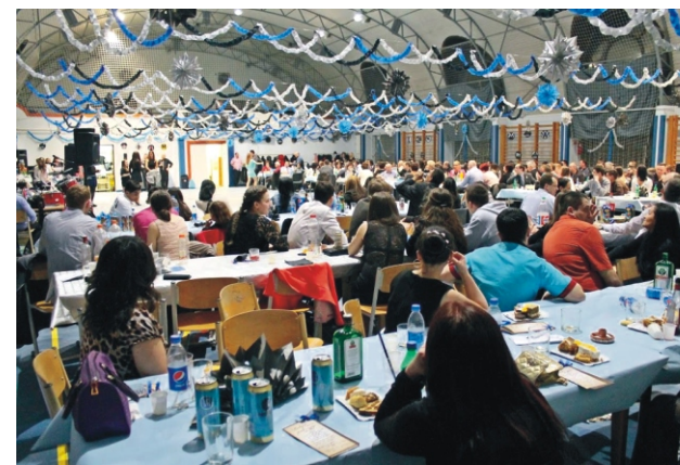
A szép számú vendégsereg