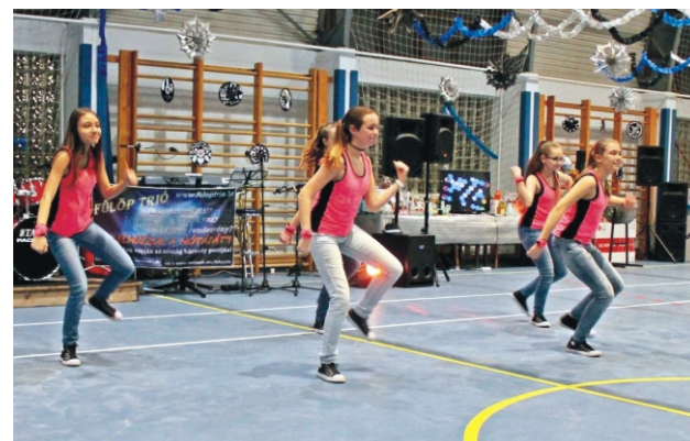
Fellépett a Savaria Táncgyűttes