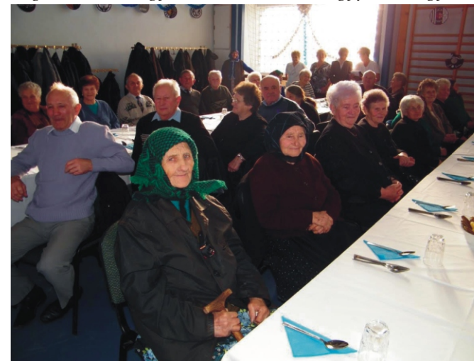
Vendégeink kíváncsian várták a műsort

Nagyon köszönöm a sok fáradságos munkát és a sok-sok finomságot, amivel elláttak és a színvonalas kiszolgálást. Nagyon jól éreztem magam. Minden nagyon tetszett. Kívánom, hogy jövőre is együtt tölthessük az Idősek Napját. Köszönöm szépen!