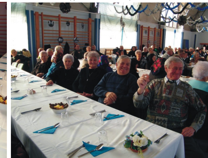
Farsangkor van ideje a vidámságnak