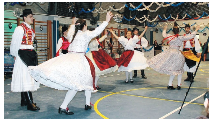
A Palóc Néptáncgyűttes rimóci és rábaközi táncokat hozott a bálba