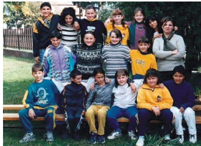
Az első osztályom