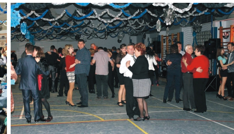
A bálozók sokat táncoltak