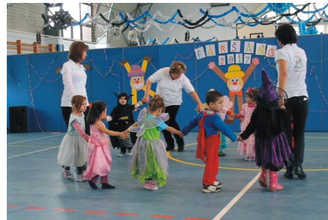
A kiscsoportos gyerekek is ügyesen járták a táncot