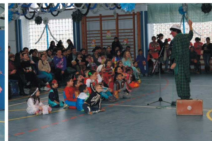
Lala bohóc a szabadidejében Bohócdoktorként járja a kórházakat