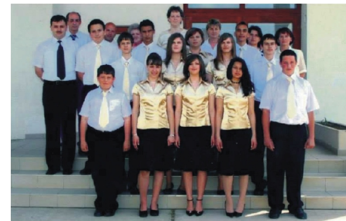
A második osztályom