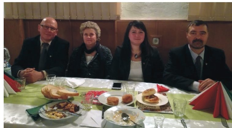
A rimóci küldöttség a koncertet követő vacsorán