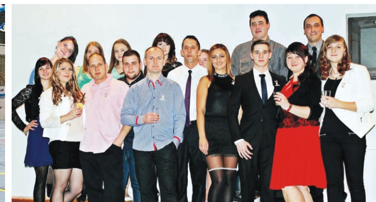
A Rimóci Ifjúsági Egyesület szervezőcsapata