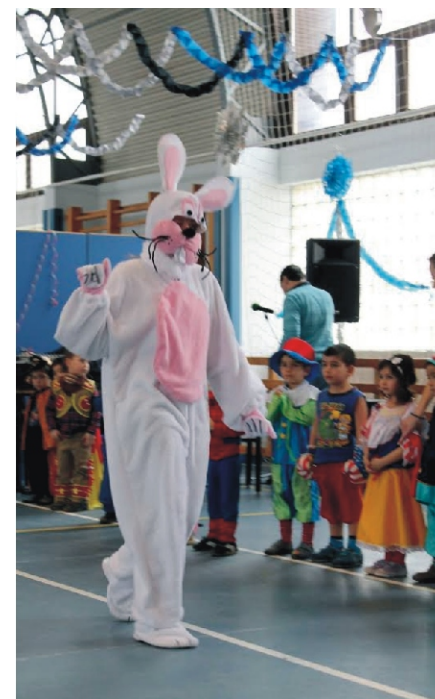
Másnap találgatták a gyerekek, hogy ki lehetett a nyuszi