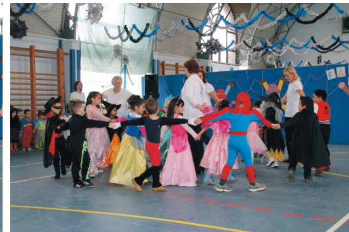
A nagycsoportosok jövőre már az iskolában farsangolnak