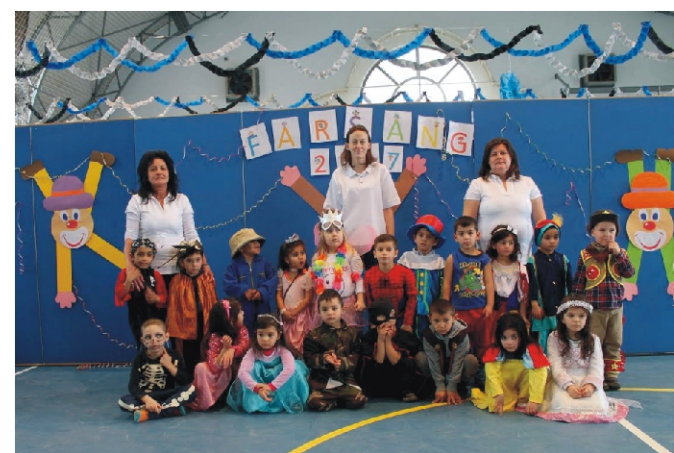
„Kergessük el a telet, farsangoljuk gyerekek!”