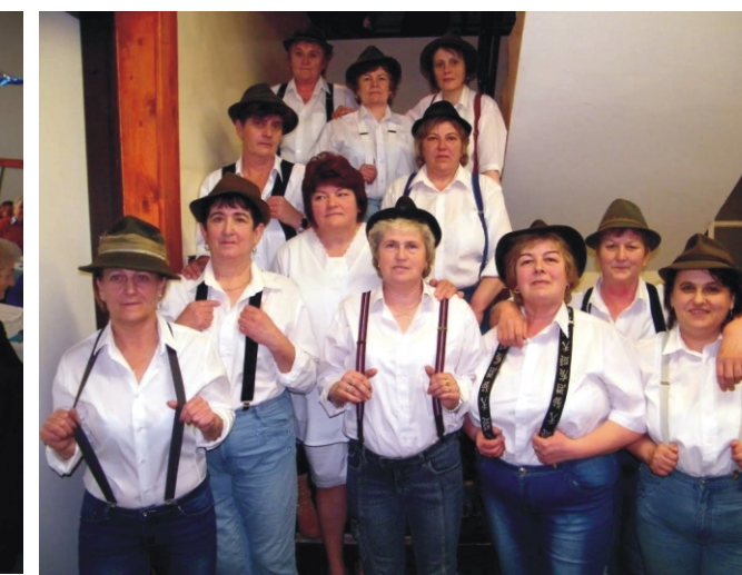
A Gondozási Központ dolgozói ismét színvonalas műsort adtak elő „le a kalappal”