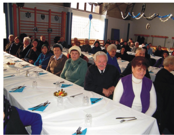
A szépkorúak az idén is jól érezték magukat