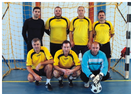
Amatőr Rimóc Kupa 3. helyezett XXX