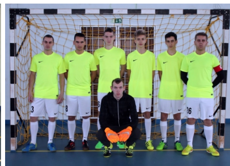
Tapsi-Hapsi Kupa 3. helyezett Duracell