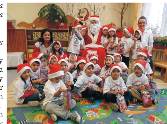
A középsős ovisok csoportképe a Mikulással