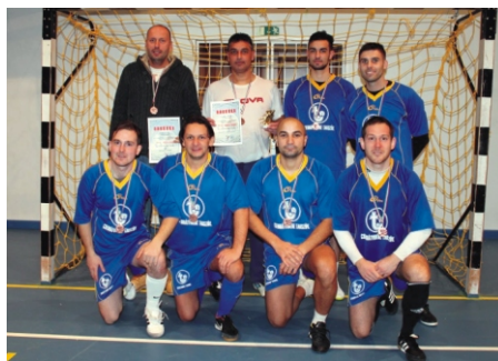
Profi Rimóc Kupa 3. helyezett Dolce Vita