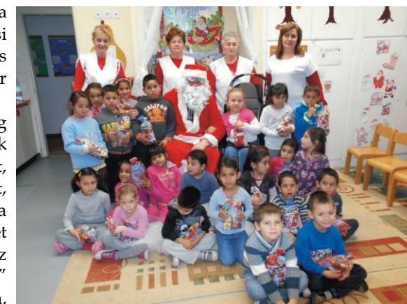
A legnagyobbak csoportképe a Mikulással