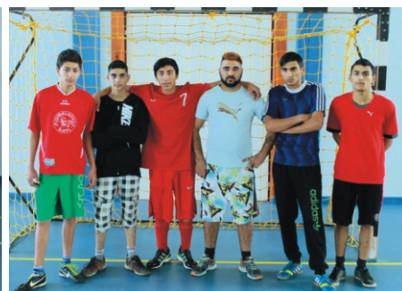
Tapsi-Hapsi Kupa 4. helyezett Roma csapat