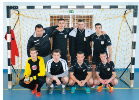
Tapsi-Hapsi Kupa 1. helyezett Nyúl York