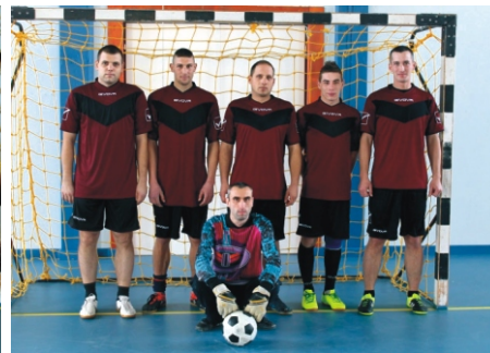
Tapsi-Hapsi Kupa 2. helyezett Number One