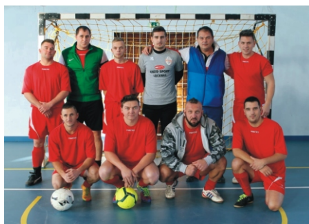
Profi Rimóc Kupa 4. helyezett Orosházi és Barátai