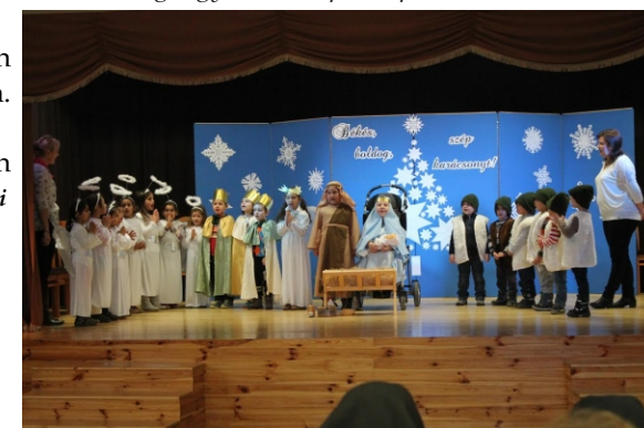
A „körte” nagycsoportosok előadás közben