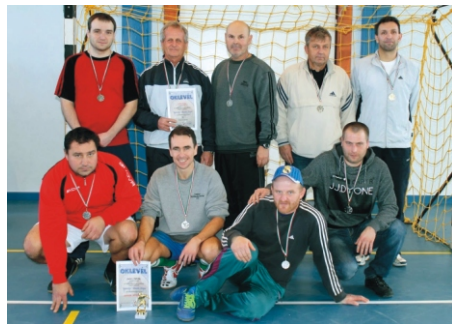
Amatőr Rimóc Kupa 2. helyezett Uni-Cum