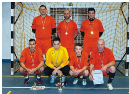
Profi Rimóc Kupa 1. helyezett Favorit