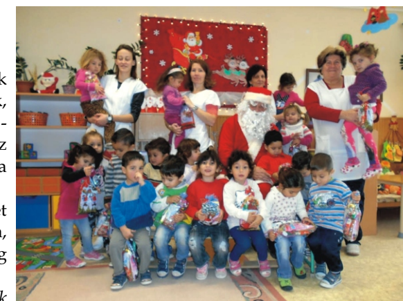
A legkisebb ovisok a Mikulással