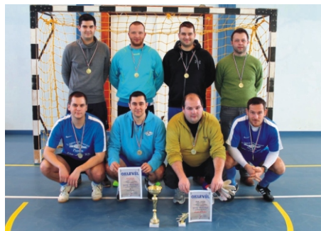
Amatőr Rimóc Kupa 1. helyezett Szécsény