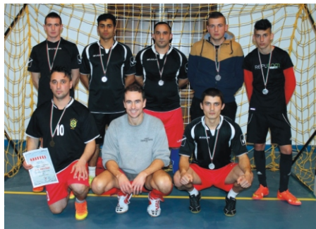
Profi Rimóc Kupa 2. helyezett Bacs SE