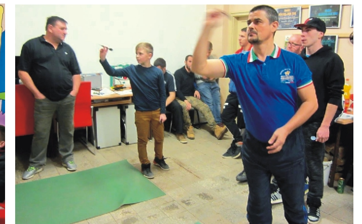
A Dartsban az ifjú tehetségek is megmutatták magukat