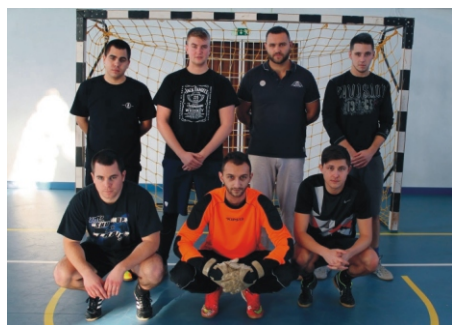
Amatőr Rimóc Kupa 4. helyezett NB1