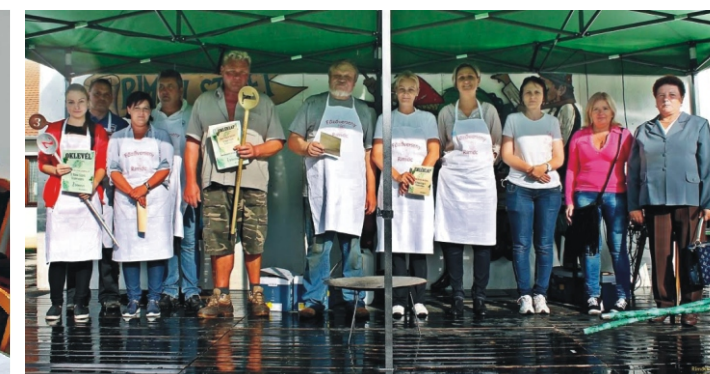
A főzőverseny indulói, a győztes a Polgárórség