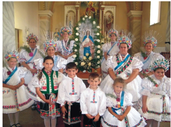
Népviseletbe öltözött gyerekek a Máriás lányokkal a szentmise után