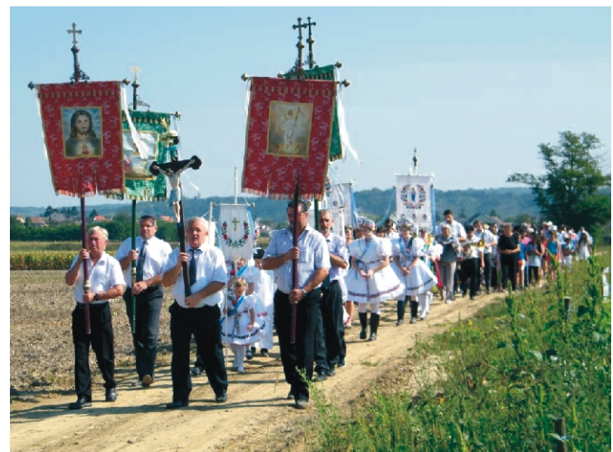
Szép idő volt búcsúsokra