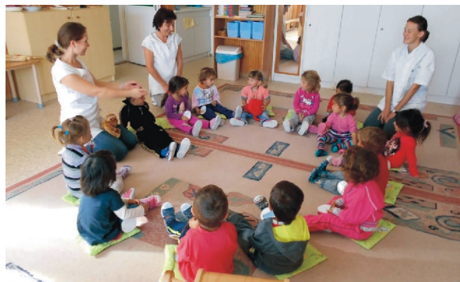
A beszkotatás folyamatát is megkönnyíti a közös mondokázás, éneklés

szeressék a felnőtteket, megismerjék és elfogadják a csoport szokás- és szabályrendszerét. Emellett a szülők bizalmának elnyerése és a megfelelő partnerkapcsolat kialakítása is lényeges és elengedhetetlen ahhoz, hogy a gyermekek könnyen vegyék az érzelmi leválást és azt a változást, amellyel az óvodai élet megkezdése jár.