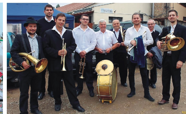
A Rimóci Rezesbanda idén is kísérte a menetet