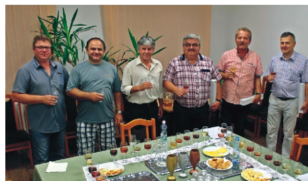
A bor és pálinkaverseny zsűrije