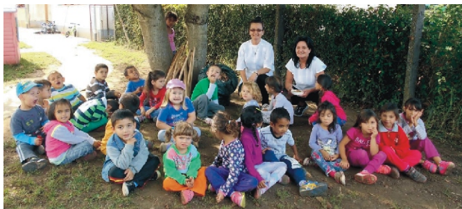
A középsős gyerekek is kivették a részüket az udvar gereblyezésében a Takarítási világnapon

A középső csoportban már ismerősként üdvözölték egymást a gyerekek és az új óvónéit is nagy kíváncsisággal és szeretettel várták. Elmesélték nyári élményeiket és újra visszarázódtak az óvodai mindennapokba. Ez nem könnyű feladat a gyerekek számára, mivel az otthoni szabályrendszer és az óvodai sok esetben eltér egymástól. Sok figyelemmel, beszéddel és példamutatással tudunk eredményt elérni ezen a területen.