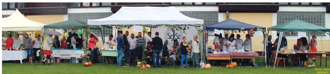
A főzőversenyre készülő csapatok sátrai