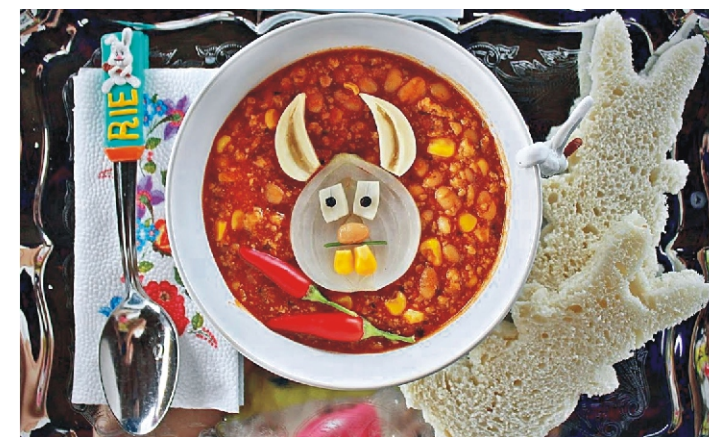
Ifjúsági chilis bab az IKSzT-ben az érdeklődők megtekinthetik