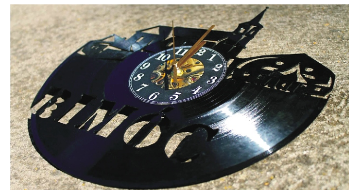
Bakelit „Rimóci óra”