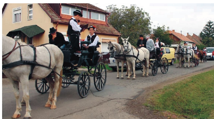
A menet még szárazon elindult