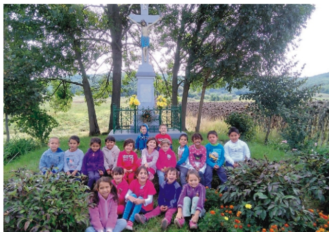
Sokat sétálunk, kirándulunk a nagyokkal Rimóc értékeit felfedezve

Nagycsoportos gyerekek közül 21-en tanköteles korúak, tehát ők, 2017. szeptemberében már kezdenek az iskolát. (Tanköteles korú az a gyermek, aki augusztus 31.-ig betölti a 6. életévét.) Ennek ismeretében a legfontosabb feladatunk a csoport megfelelő felkészítése az iskolai életre az iskolaérettségi követelmények figyelembe vételével. Ez csakis a család támogatásával és együttműködésével tud megvalósulni, ezért erre már most felhívtuk a szülők figyelmét. Virágné Csábi Adrienn