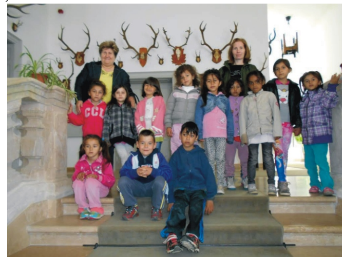
Sok látnivaló várt minket a múzeumban