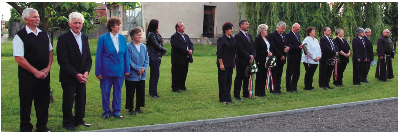
A megemlézők és koszorúzók egy csoportja