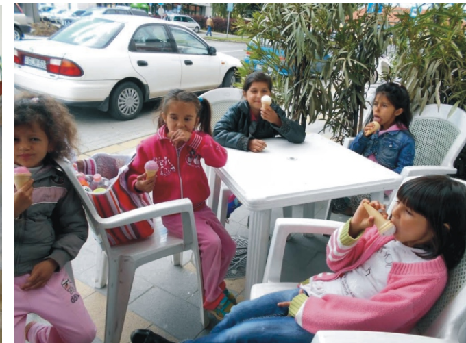
Megadtuk a módját a fagyizásnak!