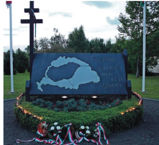
Az emlékmű az emlékezés koszorúinak és mécseseinek