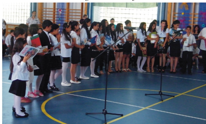
A jutalmazott tanulók