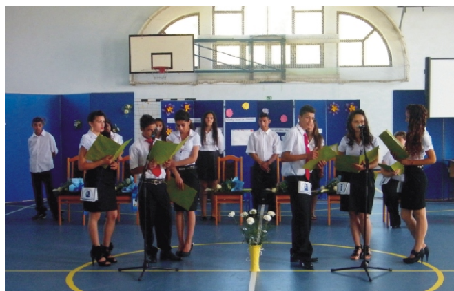
Ballagó 8. osztály