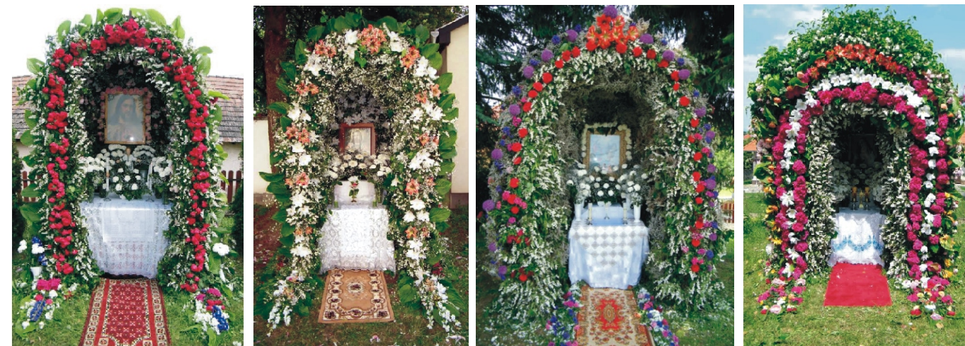
Köszönjük minden családnak, segítőnek, virágot adóknak, díszítőknak, hogy ezekkel a gyönyörű úrnapi gulyibákkal szebbé tették az Úrnapját!