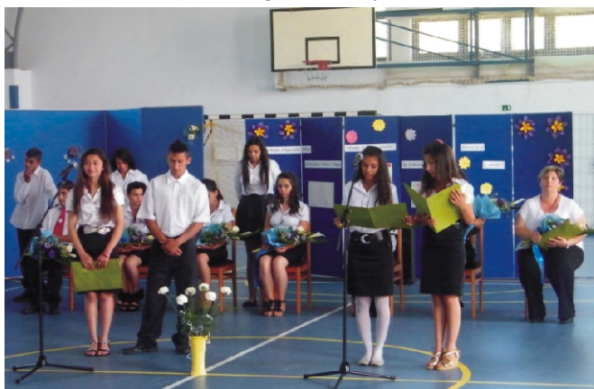
Ballagató 7. osztály