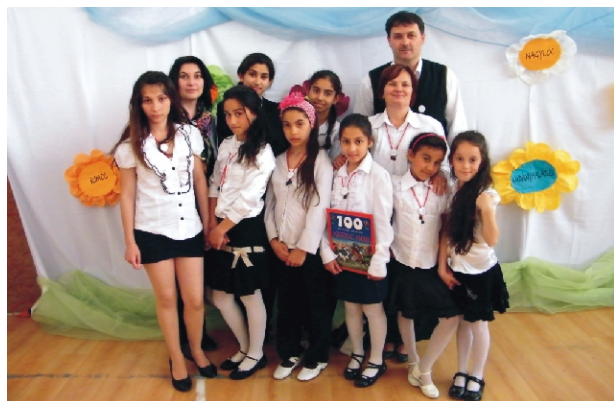
Szavalóverseny rimóci résztvevői