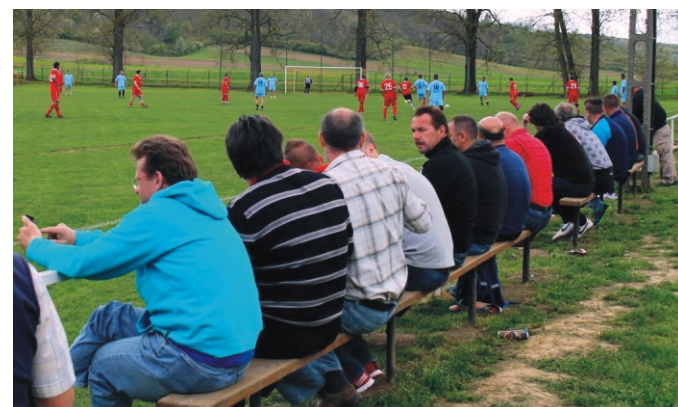
A torna szurkolói a döntő mérkőzésen