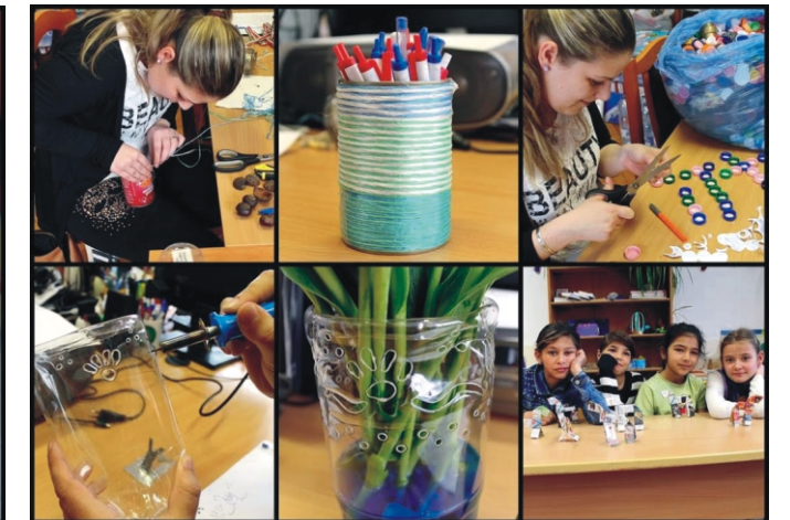
Hulladékból kreatív tárgyat

Az Óvjatok meg egy helyi értéket! feladat megővésánál megkértük az önkormányzat közfoglalkoztatottjait, segítsenek nekünk, így ők a Lóci úti kápolna és a Sipek felé vezető földút mentén található „Girind” keresztjének környékét tisztították meg.