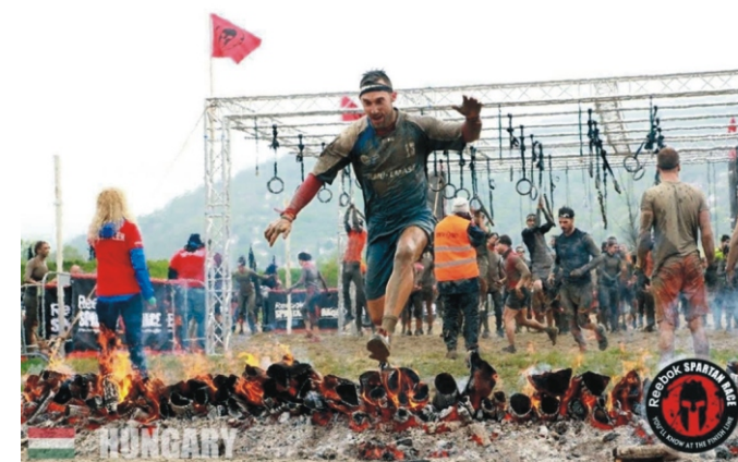
A célbaérkezés pillanata

Köszönöm neked, hogy válaszoltál a kérdéseimre! Még egyszer gratulálok a sikeres szerepléshez és sok erőt és kitartást kívánok a következő megmérettetéshez! BVÁ