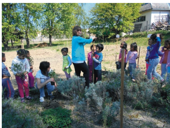
„Beültettem kiskertemet a tavasszal”