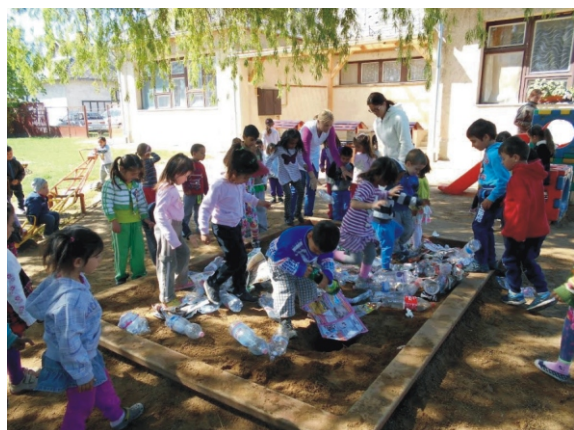
Jó móka volt a palacktaposás