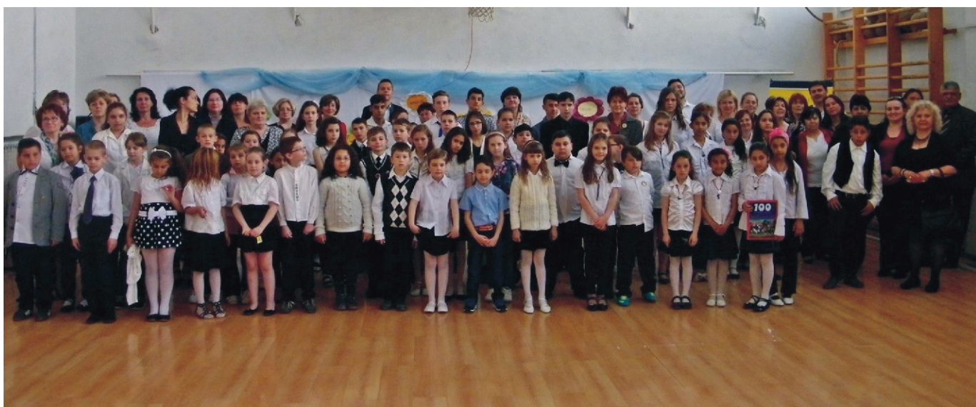
Szavalóverseny összes résztvevője

- Milyen eredményt értél el egyénileg, illetve csapatban?