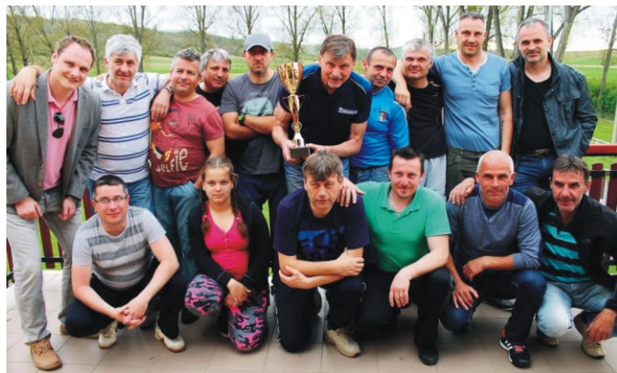
A tornagyőztes Lukanénye csapata a vándorkupával