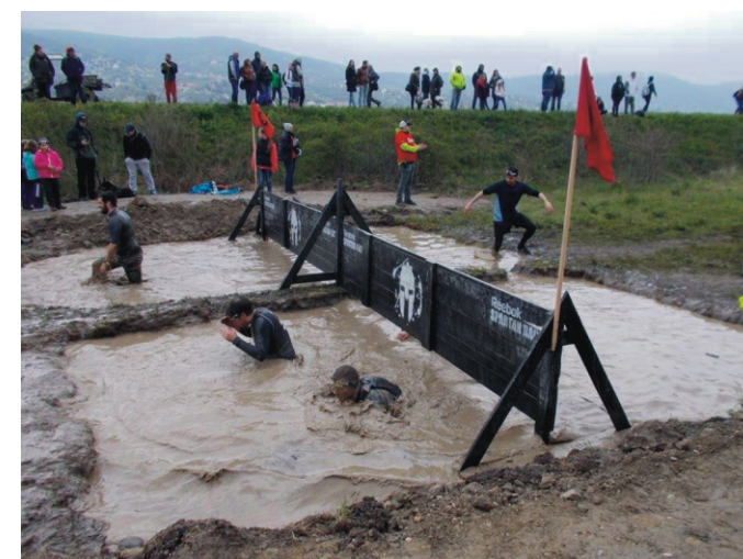
Egy akadály a sok közül. Jéghideg felfrissülés...