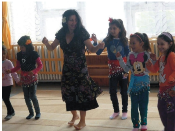
Kezdődik a tánc!