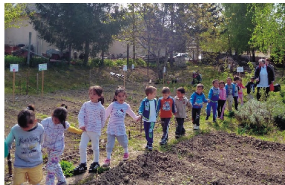
Figyelmesen sétáltunk a kiskertben