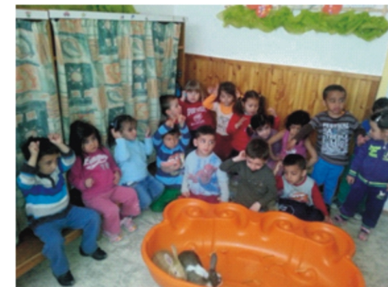
Nyuszi simogatás a kiscsoportban