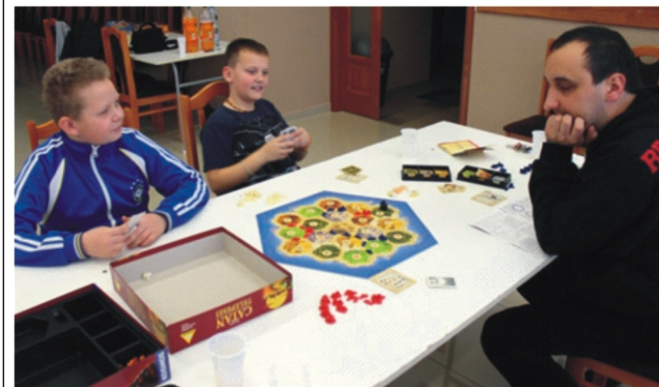
A Catan telepesei nevű társasjáték már egyre jobban megy mindenkinek

Az őszi és a téli tanítási szünethez hasonlóan a tavaszi szünet első napján is társasjáték délutánt szerveztünk a Községi Házban. A létszám most elmaradt az előzőektől, de a jelenlévők így is jól érezték magukat azon a pár órán. Mindenképpen pozitívan nyilatkozhatunk a délutánról: megtanultunk egy új társasjátékot, gyakoroltuk a ping-pong-ot, sokat nevtünk, együtt voltunk, beszélgettünk, egymásra figyeltünk, nem a számítógépre vagy a mobilra, elfelejtettük az iskolát, a munkát, kikapcsolódtunk és jól éreztük magunkat. Mint mindig az ilyen alkalommal. Reméljük, legközelebb többen jönnek el, a gyerekek hozzák szüleiket, a szülők hozzák gyerekeiket. BVÁ