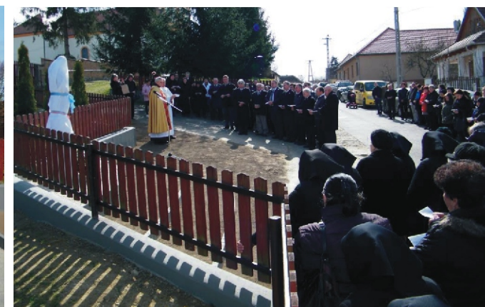
Az idei Szent József nap bizonyára mindenkinek emlékezetes lesz