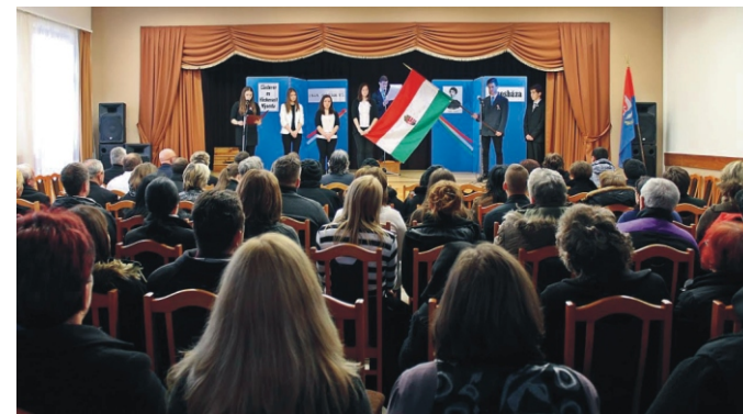
Az ünnepi műsorban közreműködő fiatalok és a közönség