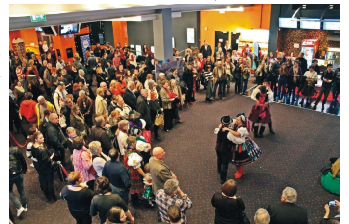
Táncbemutató a MOM Parkban