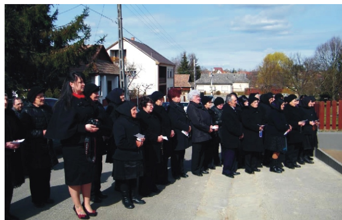
Egyházközségünk hívó népe is szép számmal vett részt az ünnepségen