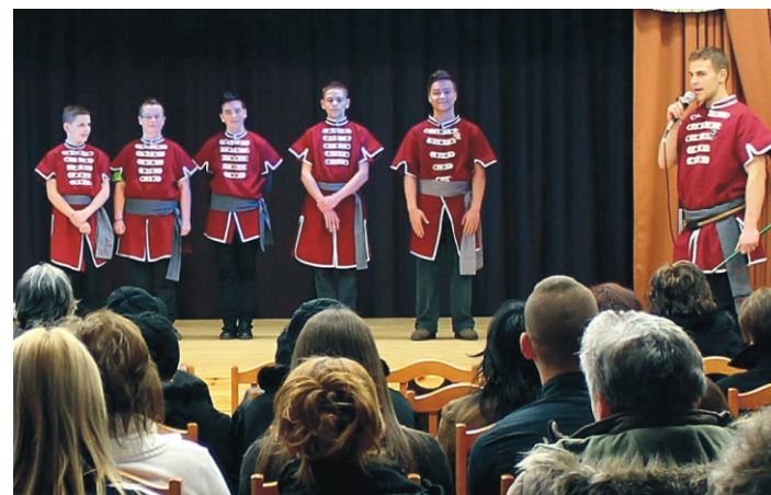
Barantások bemutató közben