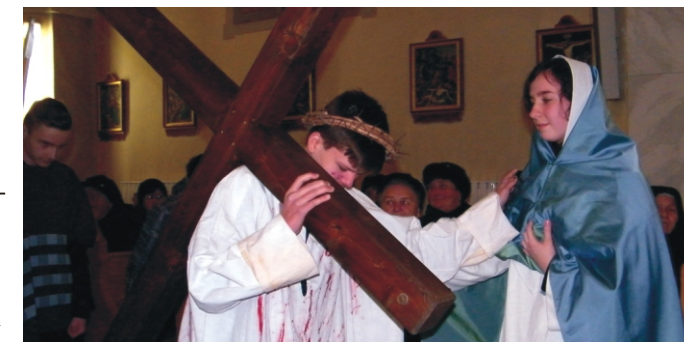
Jézus Máriával találkozik