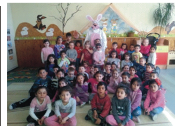
Nyuszi pajtás és az ovisok