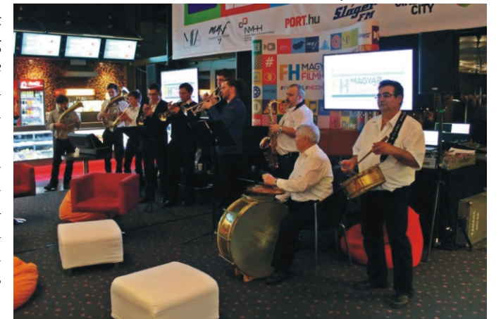
A rezesbanda húzza a talpalávalót