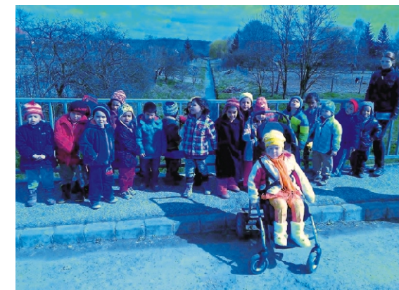
A körte csoportos gyerekek a Körtvélyesi-pataknál