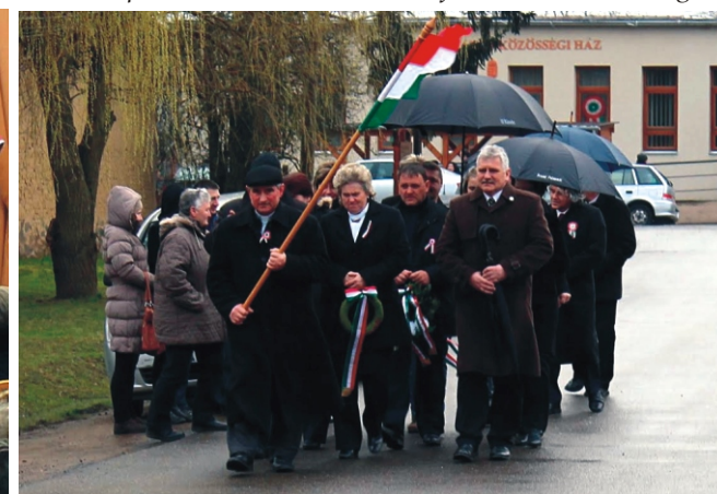
Koszorúzásra vonulás a Petőfi szoborhoz