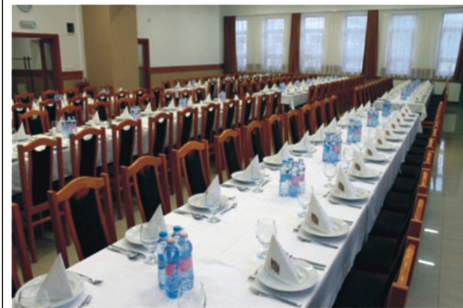
A teljesen berendezett nagyerem

Március közepén sokan kérdezték a faluban, hogy mi az a sok autó a Községi Ház előtt, hogy még a Szocinál sem lehetett megállni. Pedig ez alkalommal az iskola mögötti aszfaltpálya is tele volt parkoló autókkal. A „felfordulás” oka, hogy a Farmmix Kft. Szécsényből nálunk tartotta összejövetelét partnerei számára. A Kft. már bére vette a Községi Házat múlt év decemberében is, amikor kb. 150 fős évzáró rendezvényét tartotta. Akkor meg voltak elégedve a Községi Ház adottságaival és felszereltségével, ezért úgy döntöttek, hogy ismét nálunk tartják céges rendezvényüket. Most is hasonló létszámban került megrendezésre az a konferencia, melyet a mezőgazdasági területen dolgozó partnereik számára tartottak meg a Községi Házban. A rendezvény alkalmával az egész nagyerem berendezésre került asztalokkal és székekkel, a rendelkezésre álló tér maximálisan kihasználásra került. A bérlők ez alkalommal is elégedetten távoztak, s bízunk benne, hogy legközelebb is helyet biztosíthatunk az ilyen jellegű rendezvényeknek is.