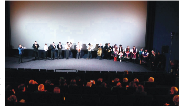
A mozi teremben a rezesbanda és a népviseletesek

Kellemes húsvétot minden rimócinak és a jó szomszédoknak, akár a tót atyafiaknak is. :)