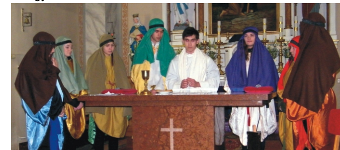
Az utolsó vacsora

Köszönjük a fiataloknak, a szülőknek és minden segítőnek, hogy felelevenítették nekünk Jézus szenvedéstörténetét.