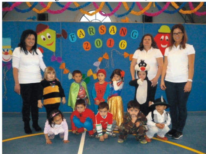
Együtt a jelmezes kiscsoportosok