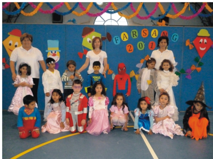
A nagycsoportosok az utolsó óvodás farsangi báljukon vettek részt