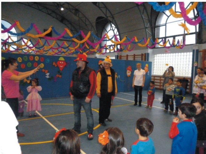
Bátor apukák is szerepet vállaltak Orsi műsorában