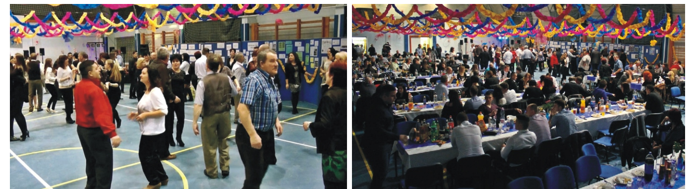
Sokan „ropták” a táncot