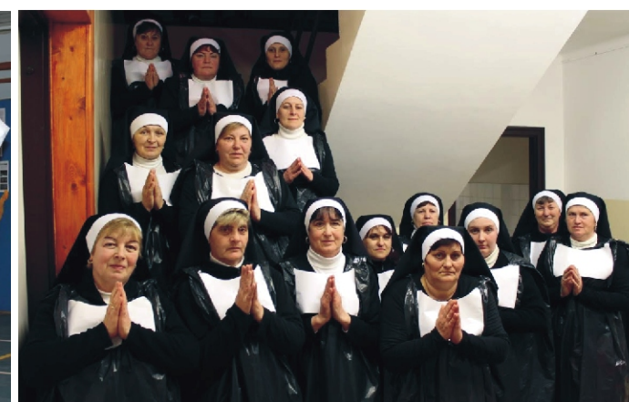
A Gondozási Központ dolgozói „jelmezben”