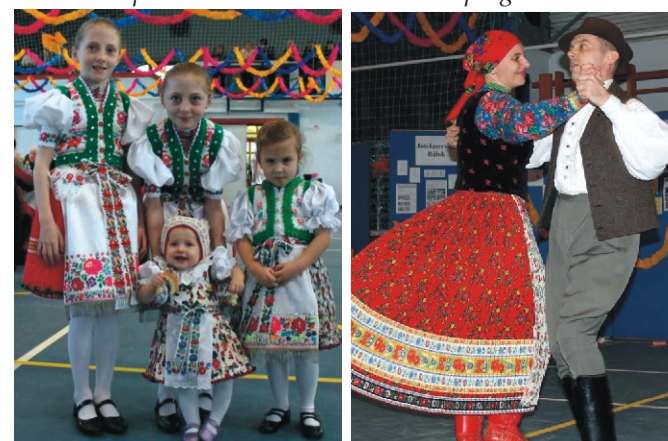
A Haraszi ikrek a Paluch lányokkal