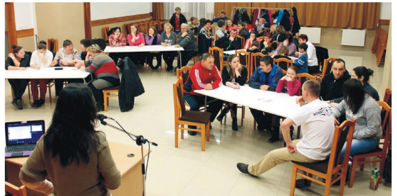
A vállalkozó kedvű csapatok a KVÍZ vetélkedőn