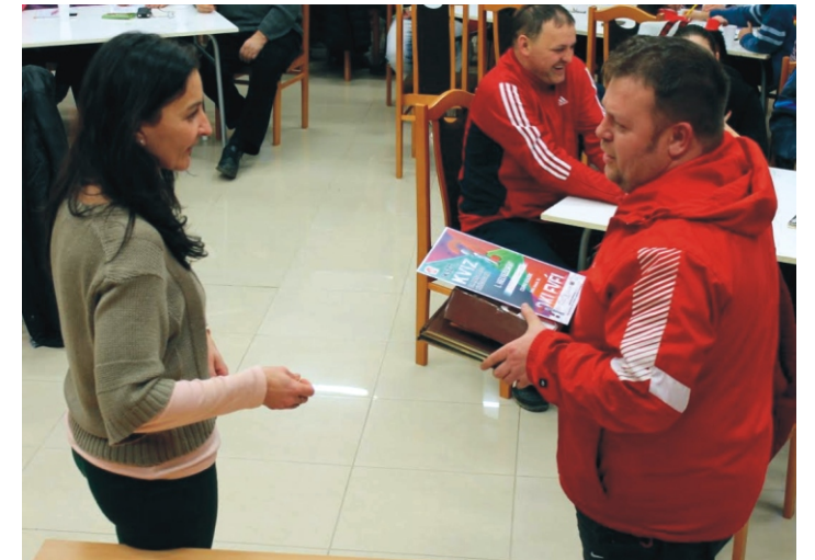
A győztes csapat kapitánya átveszi a nyeresiményt

Reméljük, akik eljöttek, jól érezték magukat, s élményekkel teli tértek haza otthonaikba. A kvíz vetélkedő után még sokan kedvet kaptak a további játékhoz, így csapat-átrendezés után Activity-vel zártuk az estét, ahol szintén nagyokat neveltünk az ötletes rajzokon, megfogalmazásokon és bemutatókon. A tervek szerint a Kvíz vetélkedő következő alkalommal is kitelepel majd Rimócra, a tervek szerint májusban. Gratulálok a győztes csapatnak és köszönöm még egyszer a részvételt! BVÁ