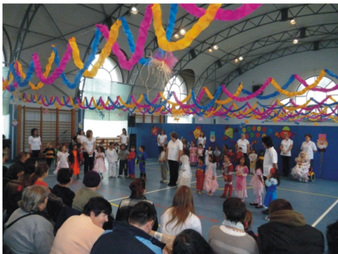
A gyerekek már nagyon várták, hogy a műsorukat a bemutathassák