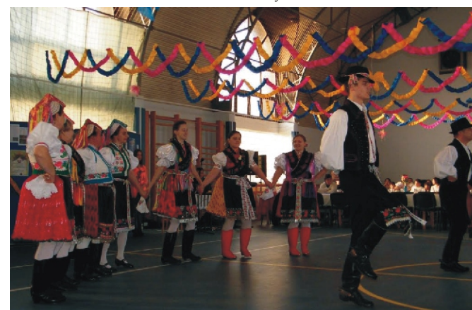
Néptánc is színesítette a délutáni programot