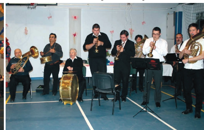
A Rimóci Rezesbanda