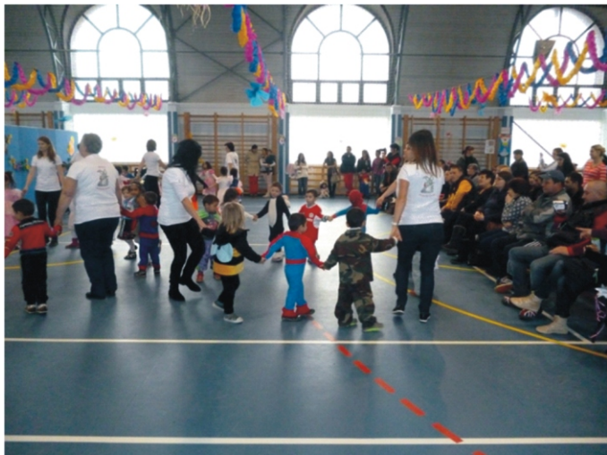
Kezdetét vette a „mesebeli karnevál”