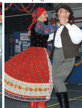
A Paluch házaspár