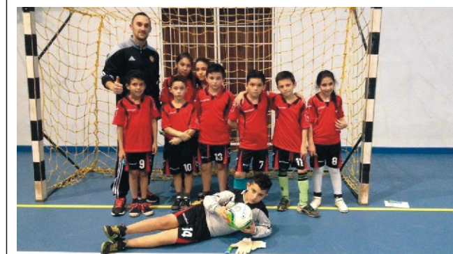
Az U-11-es csapattal a mérkőzések után