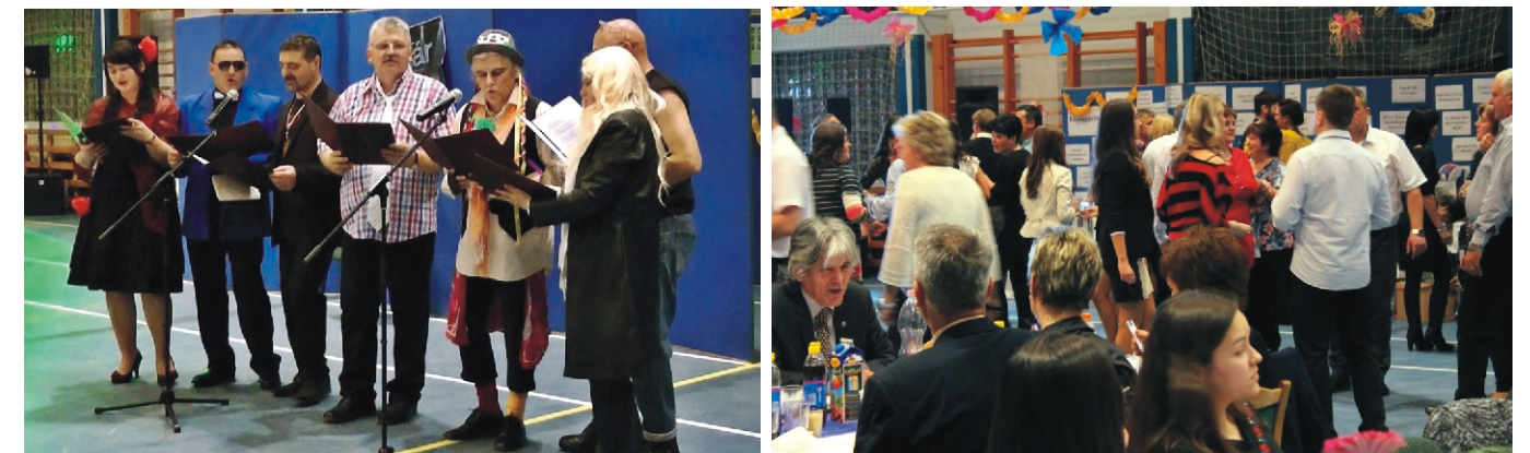
A képviselő-testület meglepetés műsora