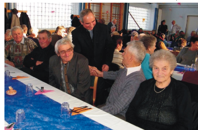
József atya az idős emberek között