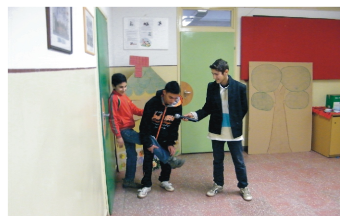
Az egyéb kategória győztesei