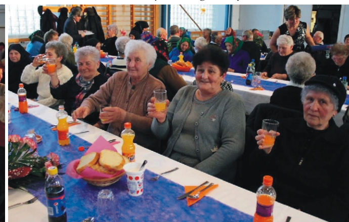
Az „alvégi” asszonyok egy csoportja