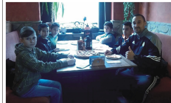
Az U-13-as csapattal a balassagyarmati Corleone pizzériában. Sportolás után kell egy kis kalóriapótlás.