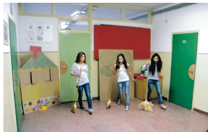
A tánc kategória győztesei