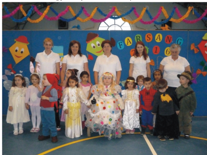
A középső csoportos gyerekek is jelmezebe bújtak