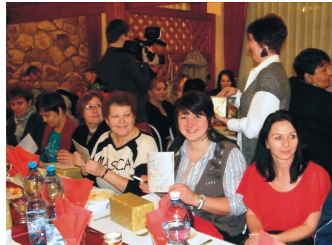
A jubiláló véradók közül páran egymás mellett