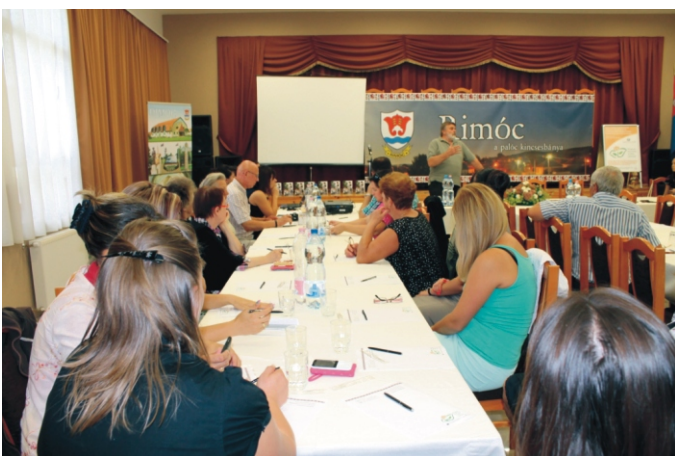
Sokan eljöttek, és majdnem mindenki kitartott a program zárásáig

"A projekt a Magyar Nemzeti Vidéki Hálózat Elnökségének javaslata alapján, az Európai Mezőgazdasági Vidékfejlesztési Alap társfinanszírozásában megvalósuló intézkedések Irányító Hatóságának jóváhagyásával készült."