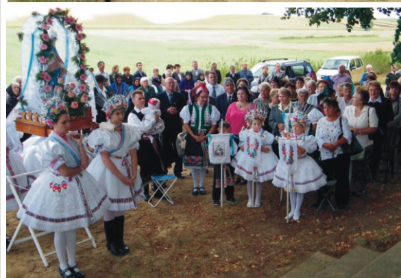
Együtt köszöntöttük a Szűzanyát születésnapján