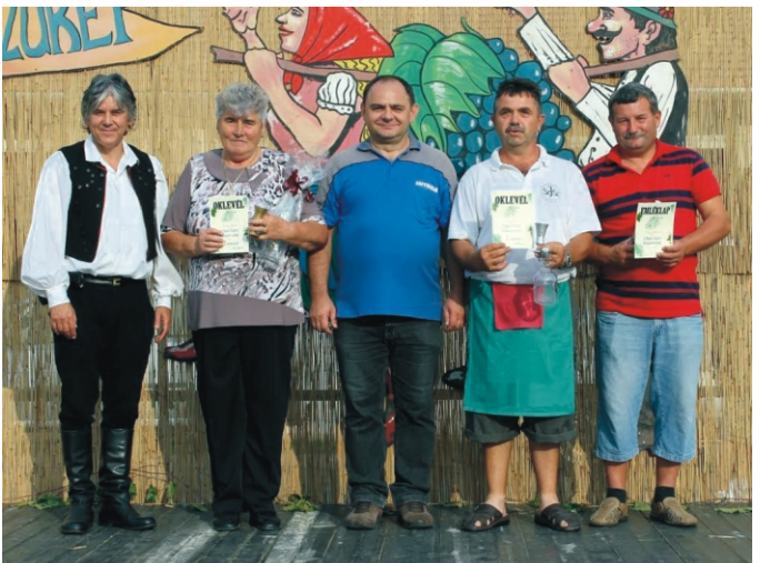
A pálinkaverseny résztvevői a polgármesterrel és az egyik pálinkabíróval