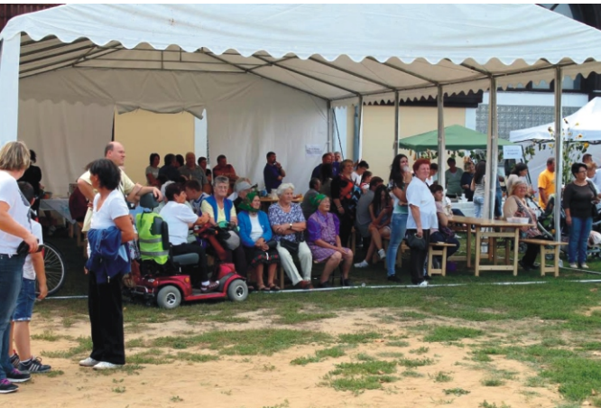
A nézőközönség egy része, akik már nagyon várták az eredményhirdetést