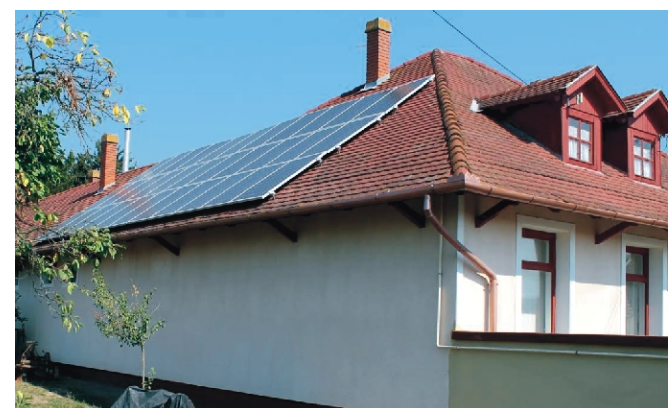
Napelemek a Rimóci Közös Önkormányzati Hivatal épületén