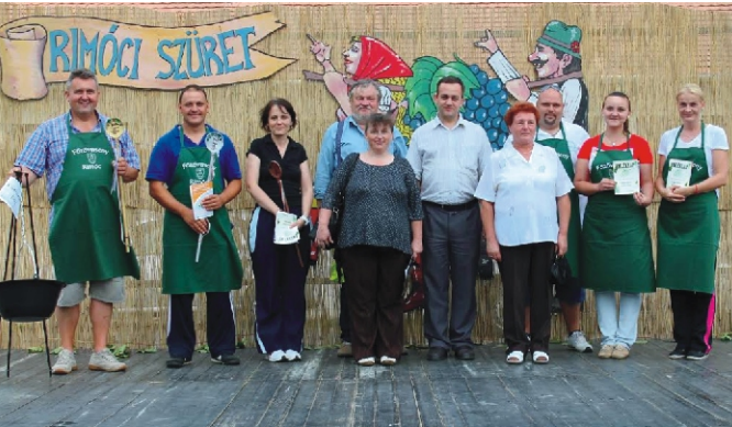
A főzőverseny résztvevői a zsűritagokkal