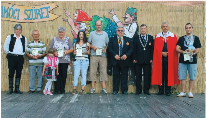
A borverseny résztvevői a polgármesterrel és a borlovagokkal