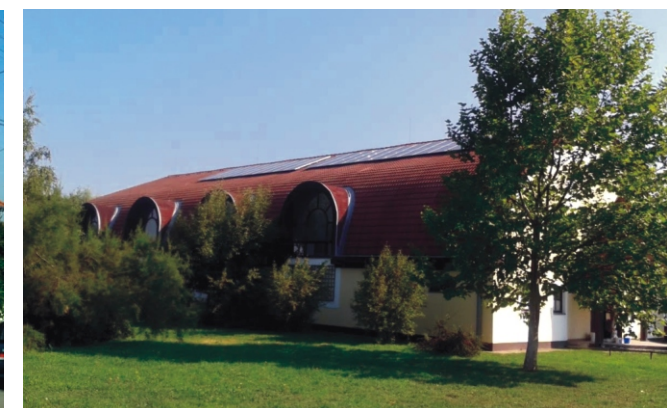
Napelemek a Sportcsarnok tetején