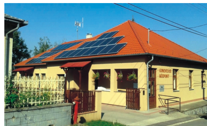
Napelemek a Gondozási Központ épületén