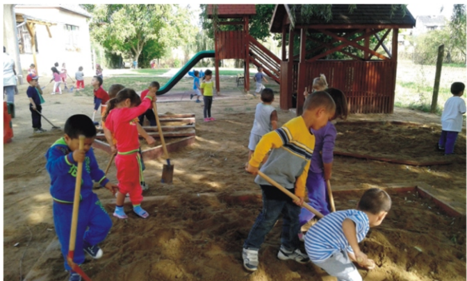
Kicsik és nagyok együtt dolgoztak