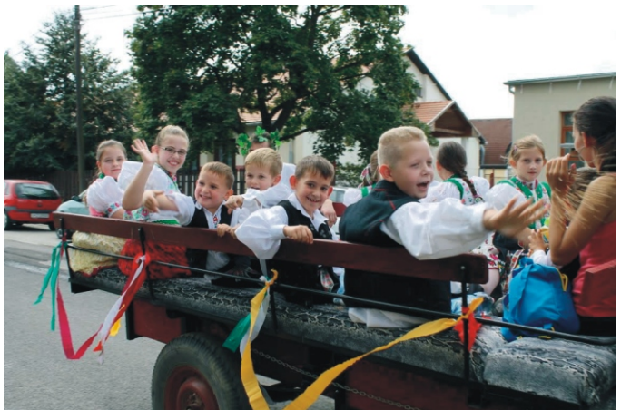
Jókedvű gyerekek népviseletben