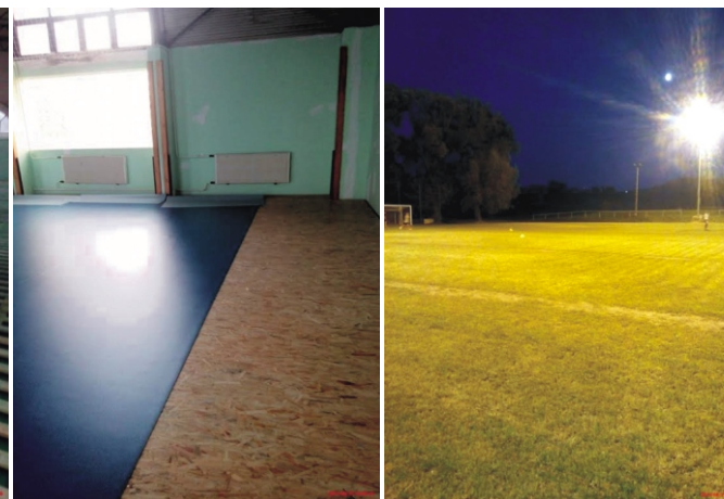
A Sportcsarnok padlózata