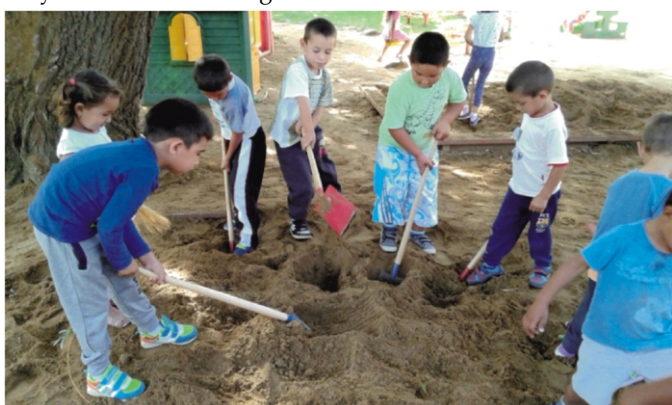
Sok szorgos kéz hamar végez

-énekeltük szeptember 18-án a Takarítási világnap alkalmából szervezett programunkon. Igyekszünk minden jelentősebb világnapról megemlékezni, valamilyen formában közel hozni az óvodásaink számára. Így történt ezen a délelőttön is, amikor a gyerekek kiskötényt kötöttek magukra, rongyot, seprűt kaptak és indult a takarítás. Fiúk, lányok egyaránt kivették a részüket a munkából és lelkesen törölgették a polcokat, a játékkonyhát, az asztalokat. A csoportok után az óvoda udvarát vették birtokba és kisgereblyével, lombseprűvel, lapátokkal tették szebbé a környezetüket. A mindennapokban is többször felhívjuk a figyelmüket arra, hogy ne szemeteljenek, óvják a környezetük tisztaságát. Egy-egy ilyen esemény, közös program elősegíti a helyes viselkedés- és magatartásforma kialakulását.