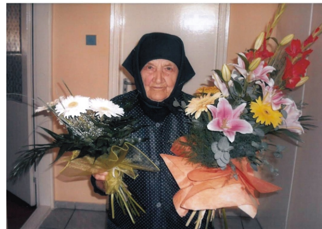
Bözsi néni 90 évesen