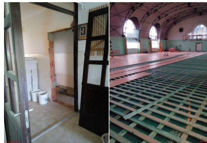
A Sportcsarnok mosdói