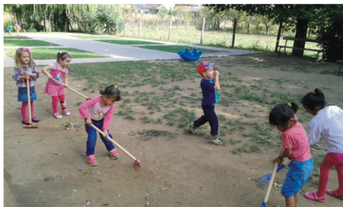
„Gyűlnek a falevelek!”