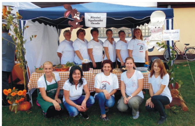
„Kezdődhet a munka együtt a csapat!”