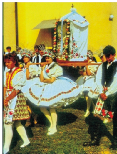
Máriás lányok és legények a Szent Mihály ünnepi búcsús körmenetben Varsány, 1990

Még voltak csapatbemutatók, seregszemlék, amelyeken táncol, énekel, verssel szerepeltünk. Nagyon szép időszak volt, örömmel csináltuk.