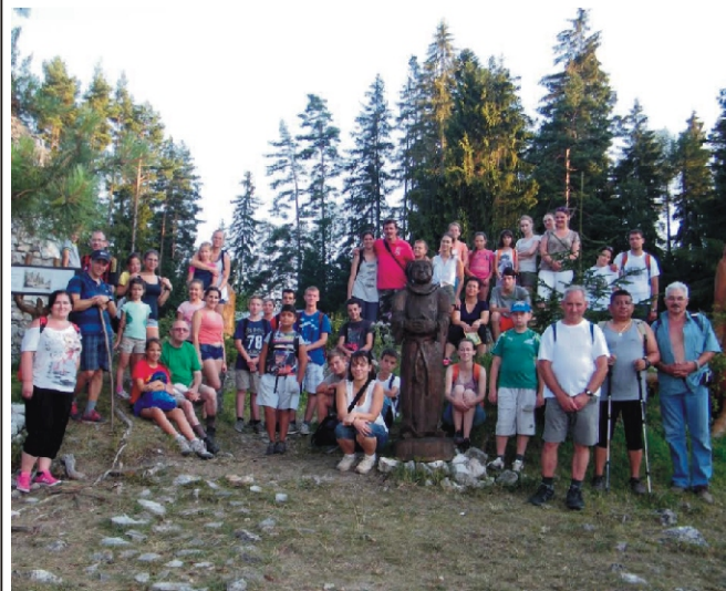
A Szlovák Paradicsomban a túrázók két csoportja a romkolostornál találkozott