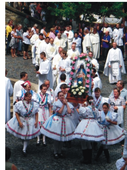
A lányok váltják egymást