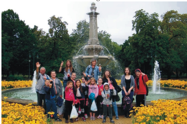
Érsekkertből már a strandra vezetett az út, amit mindenki nagyon várt