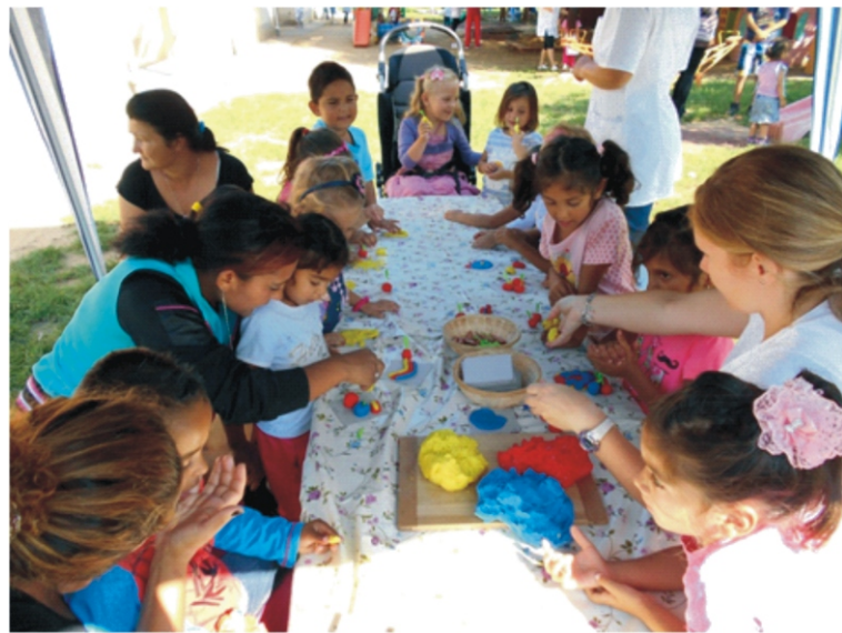
A gyurmázásnak mindig nagy sikere van