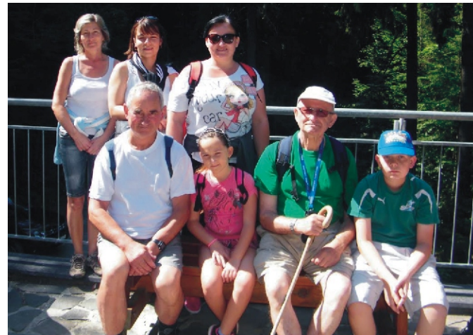
A rimóci résztvevők egyik fele a Dobsinai-jégbarlang előtt a két József atyával

Jelige: „Élni jó, élni szép!” A következő hónapban folytatjuk a 10 napos tábor további leveleivel.