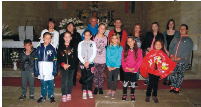
Belpátfalván a monostorban