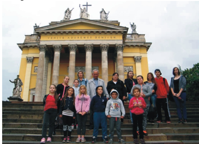
A kirándulók az egri bazilika előtt