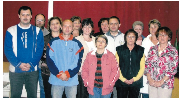
A tantestület 2008-ban

Elérkezett azonban június vége, amikor az igazgató a kezembe adta a lejárt szerződésemet, mondván, ha szükség lesz rám, majd értesít. Nagyon elszomorodtam, mert már annyira megszerettem a falut, a kollégákat, a gyerekeket, hogy nem akartam innen elmenni. Szerencsére augusztus közepén jött a levél, hogy szeretettel várnak, jöjjenek. Ez így ment a határozatlan időre való kinevezésemig. A nyaraim nem voltak felhőtlenek a bizonytalanság miatt. Közben elvégeztem a főiskolát, férjhez mentem, két gyermekem született. Ide kötött minden, már sokkal jobban éreztem magam itt, mint a szülőfalumban. Rimóci lettem.