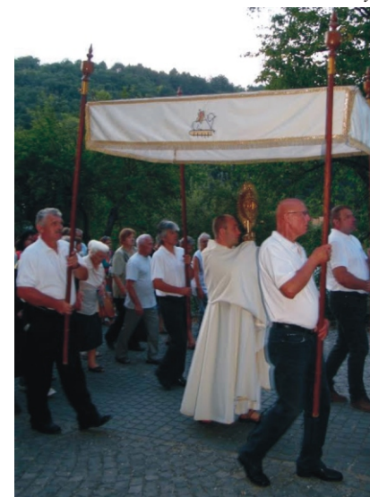
A szolgálatot vállaló SZJFSZ tagjai