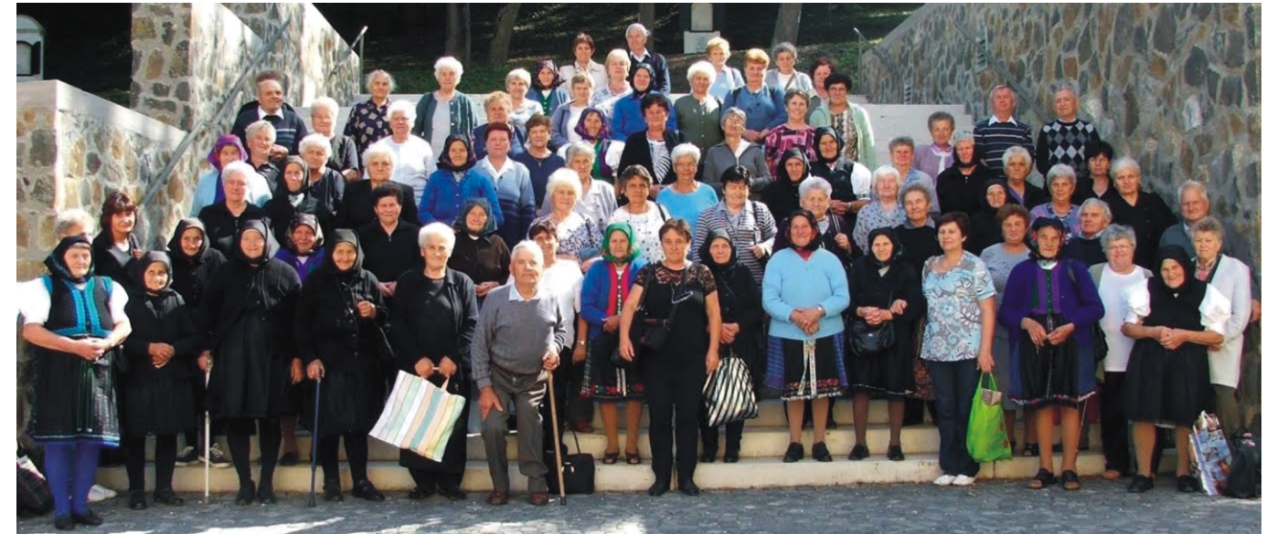
Az idősek egy csoportja a szentkúti lépcsőn hazaindulás előtt