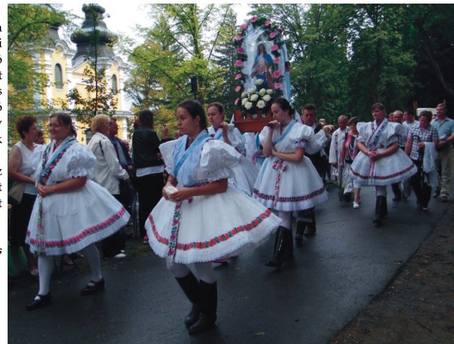
Máriás lányok a körmenetben

„Legyen mindig munkád, kezeid ne legyenek tétlenek. Erszényedben mindig rejtőzzön néhány pénzdarab. A napsugár találja meg mindig ablakodat! Légy biztos abban, hogy minden eső után kiderül az ég, és szívároány köszönt majd téged. Legyen közel hozzád mindig egy jó barát keze. És Isten töltse be szívedet derűvel és örömmel!”