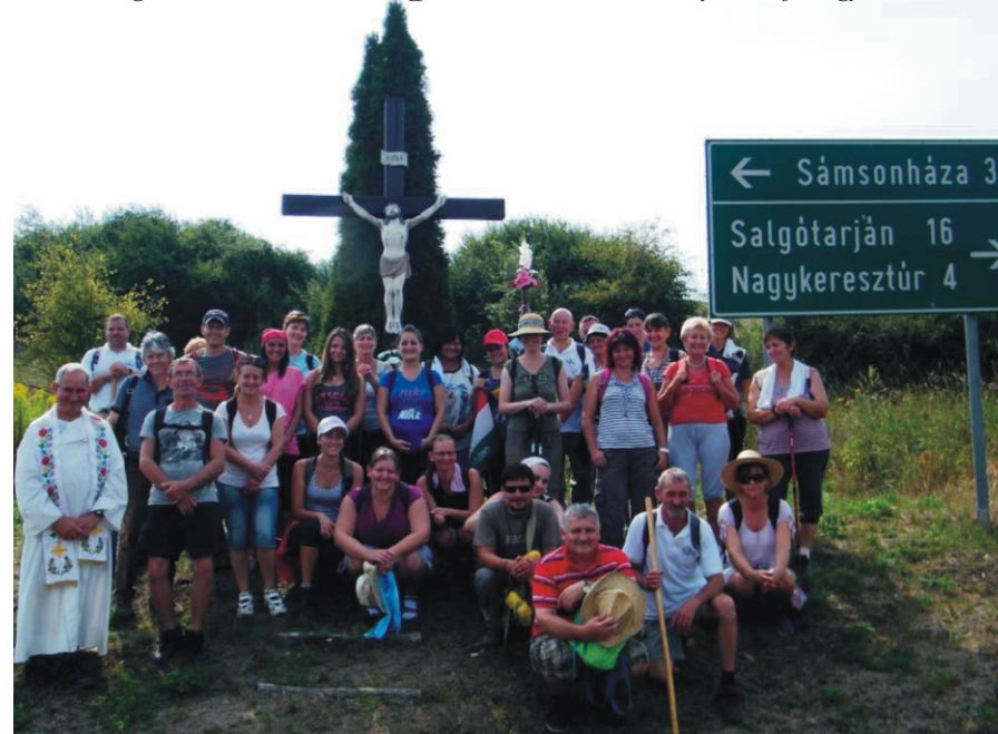
A gyalogzárándokok hazafelé Márkháza után és a „nagy hegy” előtt