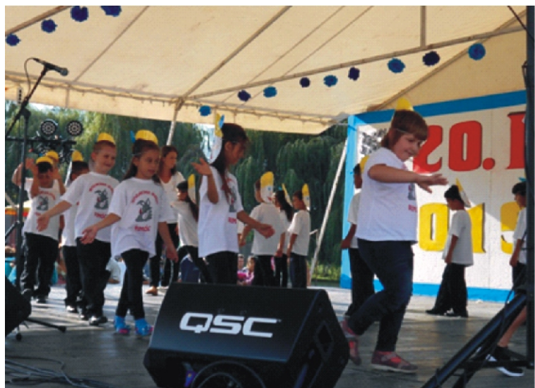
A fellépő gyerekek bátran vették birtokukba a színpadot