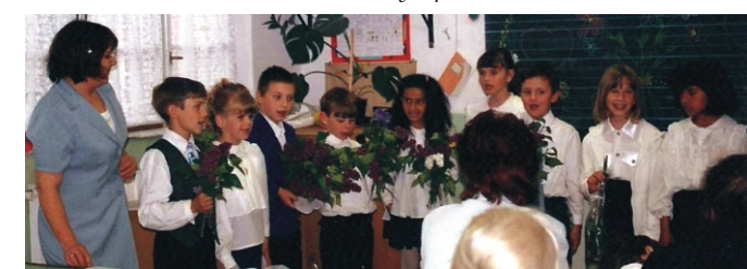
Anyák napi ünnepségen