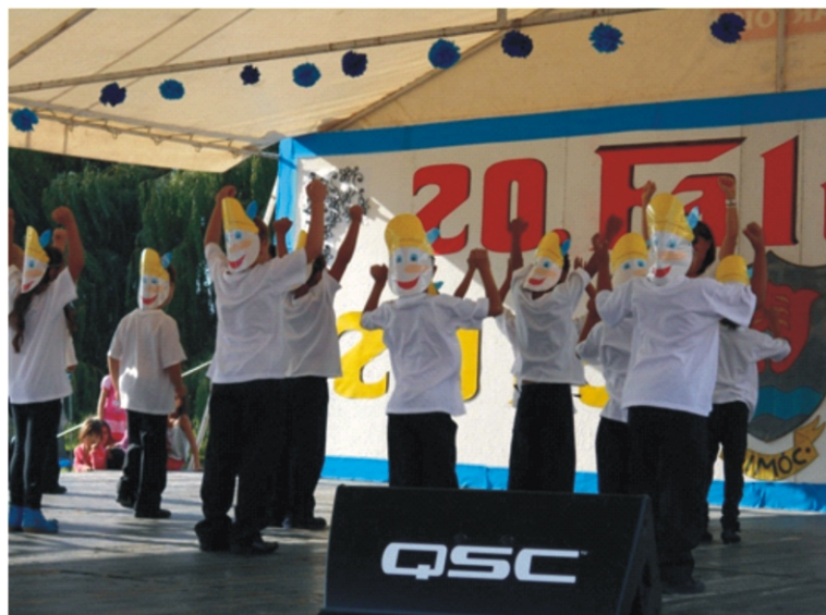
Büszkén viselték a Pinokkió álarcot