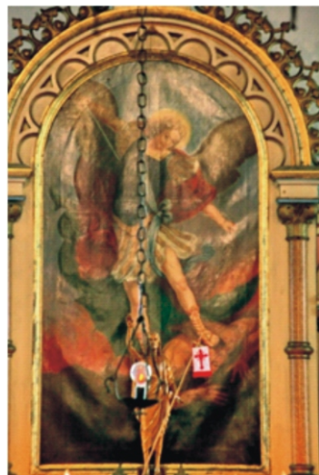
Szent Mihály főoltár róm. kat. templom Varsány

Szent Mihály-i asszonyok, férfiak, Szent Mihály-i családok, Szent Mihály-i ifjak tradicionális viselet bemutató a Kubinyi Ferenc Múzeumban, Szécsényben, 2015. október 3.-án, szombaton 14-18 óra között. A Szent Mihály ünnepén a Kárpát-medence bármely etnikuma által bármely településen hagyományosan hordott viseletek bemutatására az alábbi kategóriákban tesszünk fölívást: 1./ asszony kategória 30-60 éves korig 2./ idős asszony kategória a 60 fölöttiek számára 3./ férfi kategória 35-60 éves korig 4./ idős férfi kategória 60 év fölött 5./ leány kategória körülbelül 30 éves korig 6./ legény kategória 35 éves korig 7./ család kategória (szülők, gyermekek és/vagy unokák, dédunokák együtt)