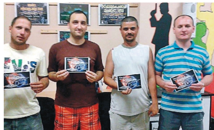
A képen a döntősök szerepelnek

A díjazottaknak gratulálunk az újság hasábjain keresztül is! A jövőben folytatjuk a versenyek szervezését, kicsit színesítve a programot asztali tenisz, rómi és egyéb játékokkal is, amikre szintén mindenkit várunk szeretettel minden fiatal és idősebbet.