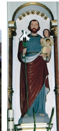
A Szent József szobor kezébe újra lilium került.