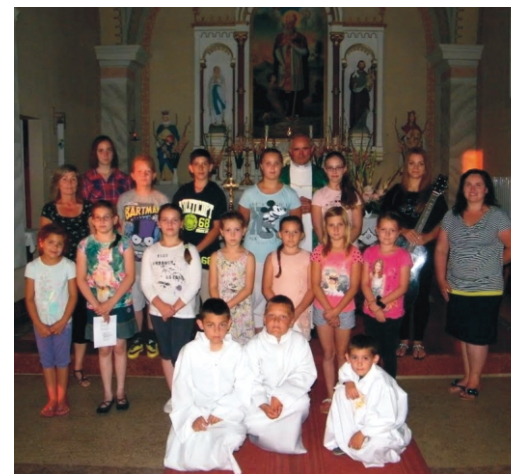
A Plébániai Játsszoház napok részeként 2015. július 18-án, szombat este a gyerekek, fiatalok, a tábort szervezőkkel közösen gitáros énekekkel vettek részt a szentmisén. A kép a ministránsokkal a gitáros mise után készült.