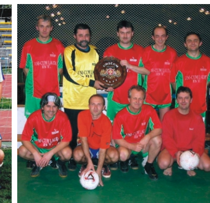
„Kell egy csapat!”