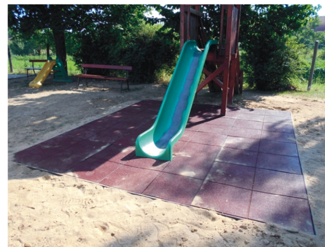
Az új burkolat meglepetés lesz a gyerekeknek