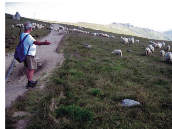
„Istenem add, hogy mindannyian jó pásztorok legyünk a magunk küzdelmes életfeladataiban.”