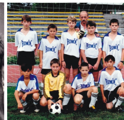
Focitornán Debrecenben 1996-ban