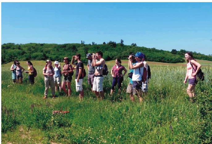
Tájséta Rimóc Varsány között