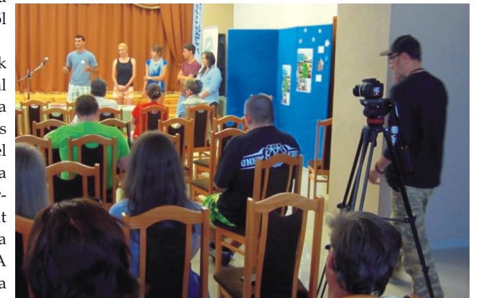
Az Egyesek bemutatása, közben készül a filmfelvétel