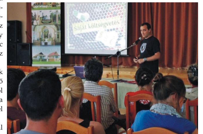
Az Ifjúsági Egyesület előadása