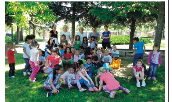
A varsányi Játékkuckó óvoda udvarán