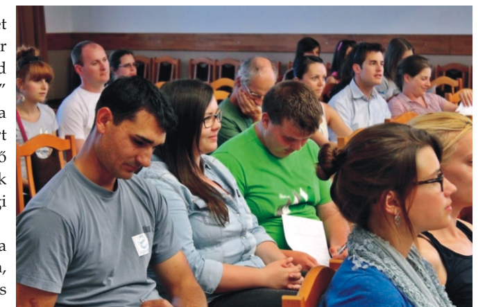
A résztvevő fiatalok egy része