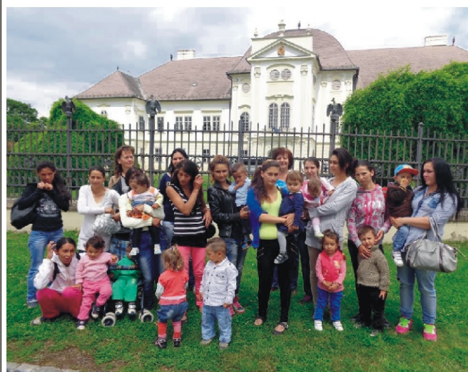
A múzeum előtt