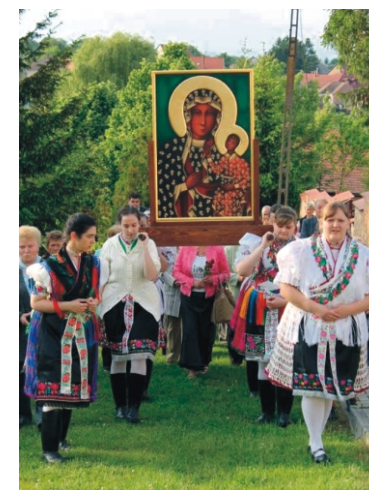
A kegykép megérkezése