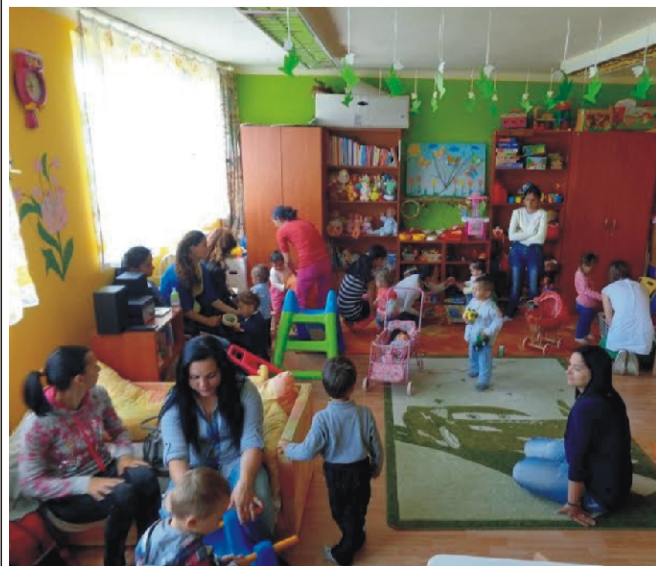
A szécsényi gyerekházban