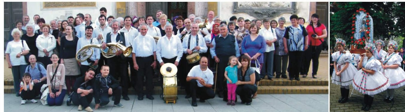
A kecskeméti nagytemplom előtt a búcsúsok