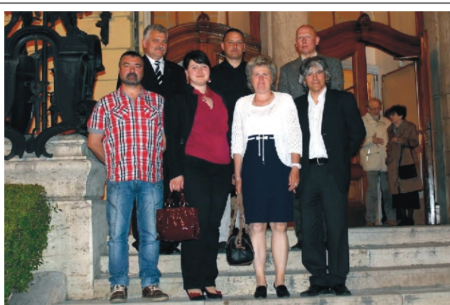
2015. május 10-én a rimóci képviselő-testület a Vígszínház lépcsőjén a Bertolt Brecht: Koldusopera című előadás után.