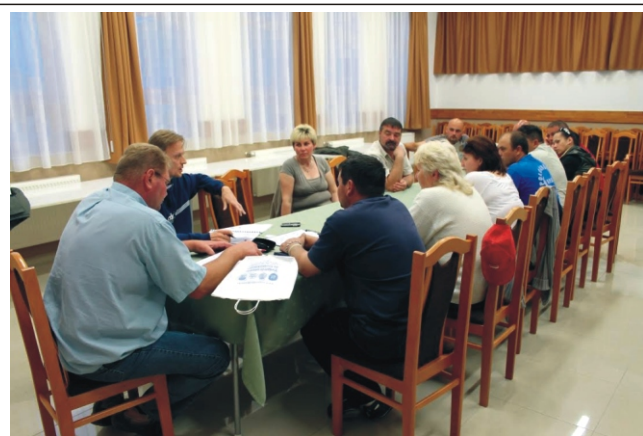
2015. május 17-én a Rimóc Polgárőr Egyesület a Rendőrséggel közösen a második szakmai oktatáson vett részt, melynek témája A 250x100 BIZTONSÁG bűnmegelőzési mintaprogram célkitűzéseinek megvalósítása.

A Rimóci Közös Önkormányzati Hivatalban a hatályos jogszabályoknak megfelelően 2015. július 6-tól július 31-ig