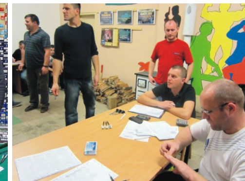
A versenyen komoly zsűrizés volt