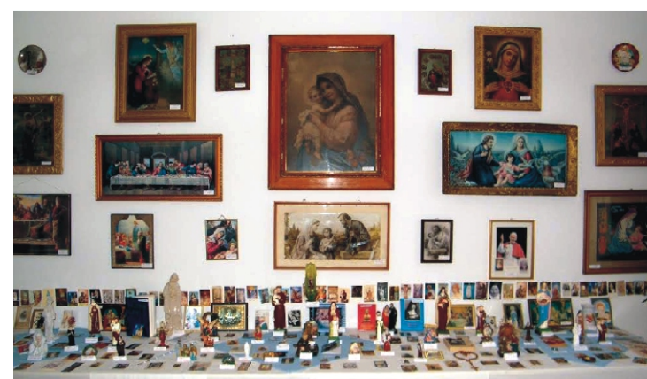
Több száz kiállított kép és tárgy várja az érdeklődőket