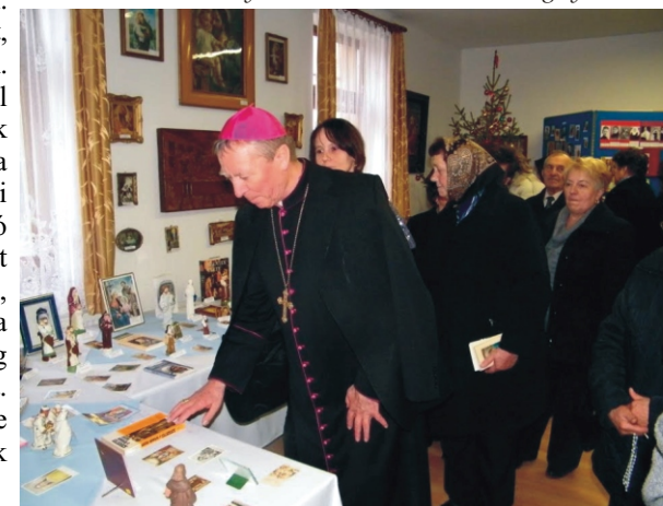
A püspök atya tetszését is elnyerte a kiállítás