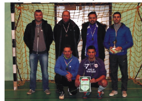
Profi Rimóc Kupa 3. helyezett - Real Magnum