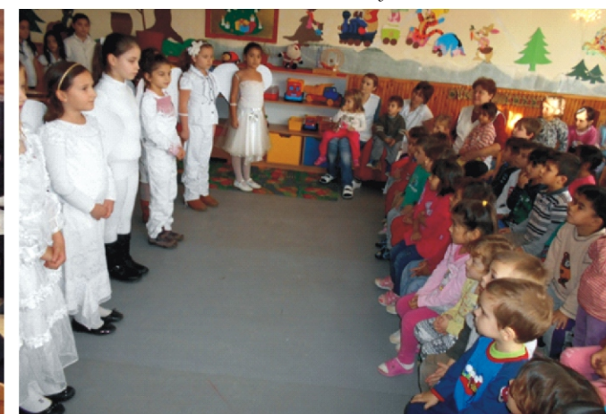
Az iskolások szereplését csendes izgalommal figyeltük