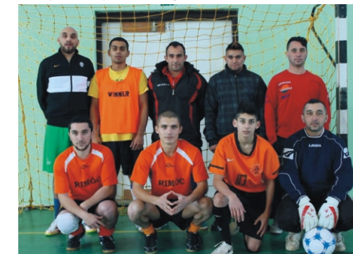
Profi Rimóc Kupa 2. helyezett - Rimóc