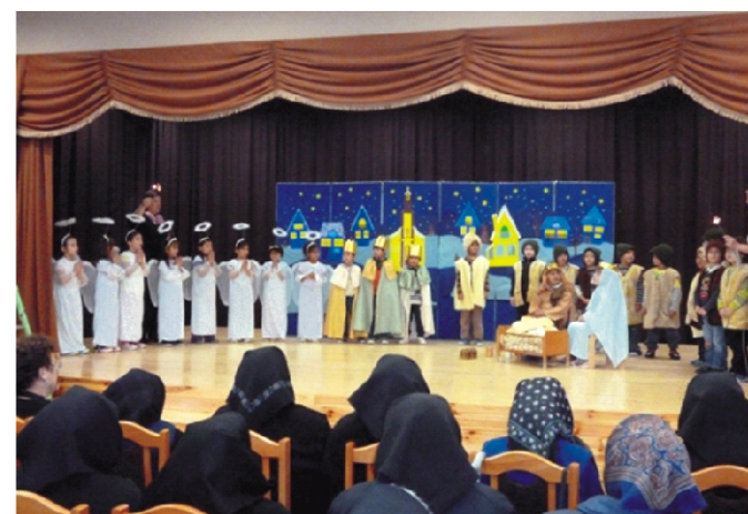
Nagycsoportosaink betlehemes műsora az idősök karácsonyát színesítette