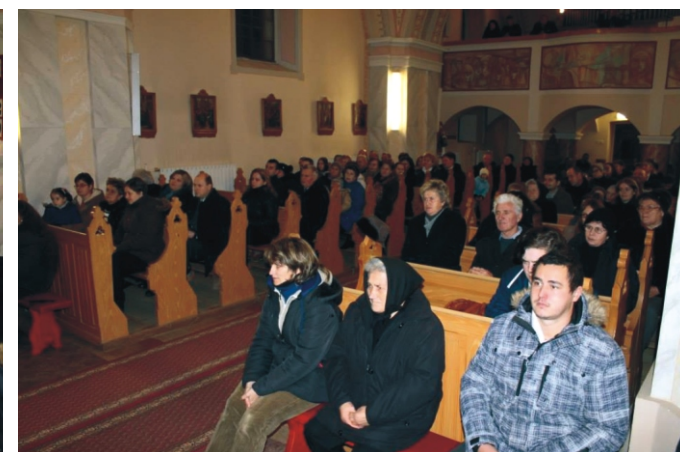
Az idén is sokan eljöttek a karácsonyi áhítatra