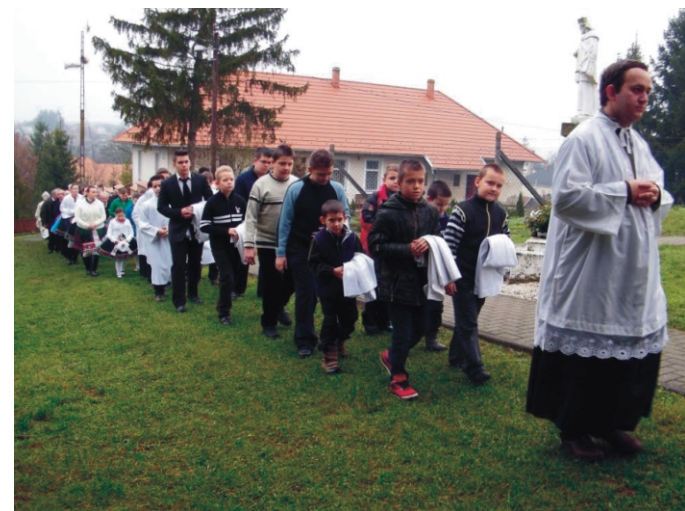
A ministránsok menete

Áldás után a résztvevők nagy része átment a templommal szemközti lévő Gondozási Központba, ahol immáron nyolcadik alkalommal nyílt vendégségi kiállítás ezúttal Katolikus szentek és