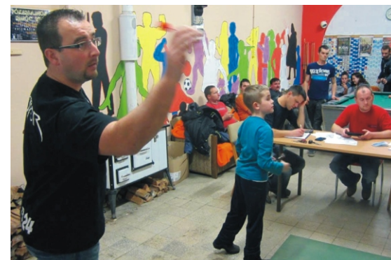
Összesen 17 nevező volt