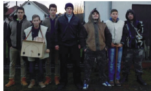
A rimóci betlehemesek