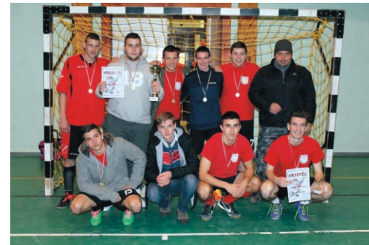
Tapsi-Hapsi Kupa 1. helyezett - Nyúl York