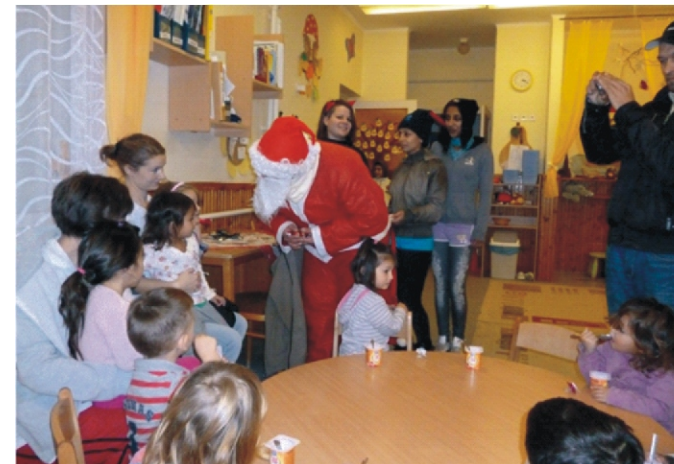
A Tanodából jött Mikulás meglepetés volt

A csoportszobák minden szegletéből a Mikulás-várás, készülődés köszönt ránk. A gyerekek a dalokat, verseket nagy örömmel tanulták, hiszen a Mikulást várni nagyon jó. Az óvónénik lerajzoltatták, hogy melyik gyerek mire vágyik, hogy ezzel is könnyebbé tegyék a Mikulás dolgát.