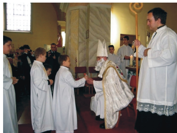
A Mikulás is meglátogatta a gyerekeket a szentmise végén