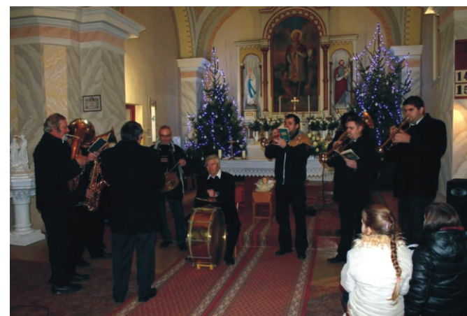
A Rezesbanda is karácsonyi dalokkal készült