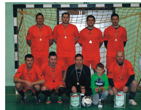
Profi Rimóc Kupa 1. helyezett - Favorit