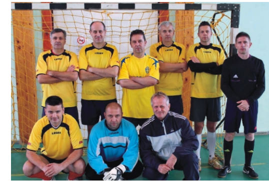
Amatőr Rimóc Kupa 2. helyezett - Uni-Cum