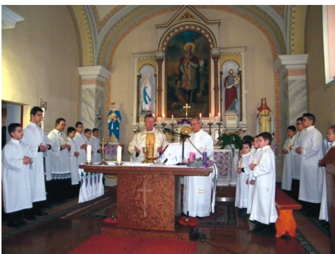
Itt már az új ministránsok is beöltözve