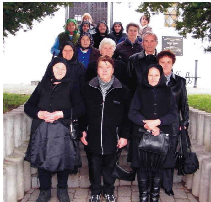
A szécsényi „Adventi várakozás”-on az idősek