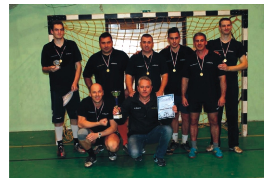
Amatőr Rimóc Kupa 1. helyezett - Vinex