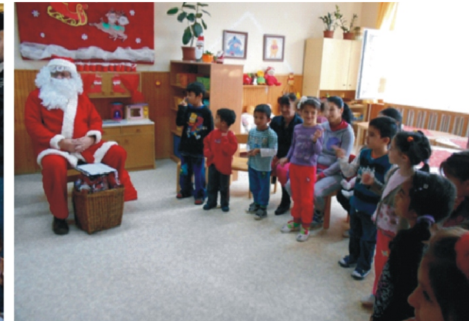
Anyuval együtt örültünk a Mikulásnak