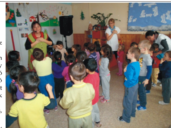
Orsi dalai a karácsonyt idézték