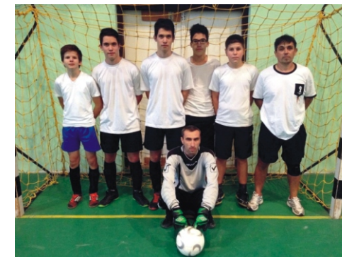
Tapsi-Hapsi Kupa 3. helyezett - Winchester United