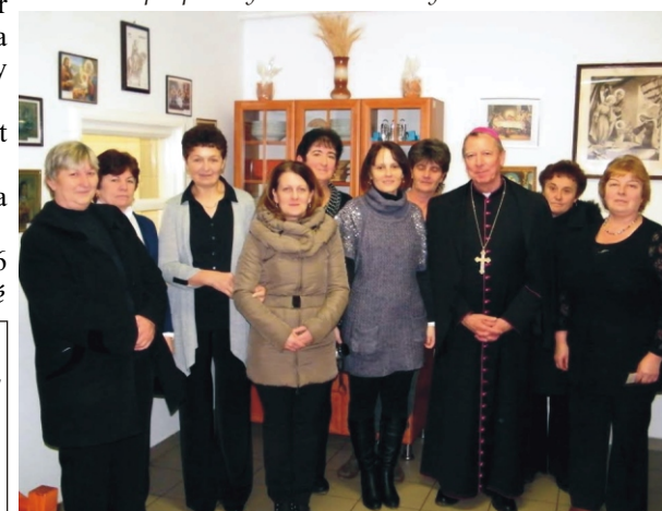
Püspök atya a szervezőkkel