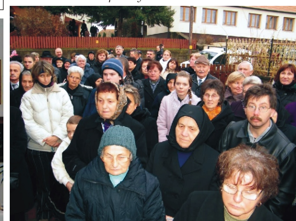
Sokan voltak kíváncsiak a kiállításra