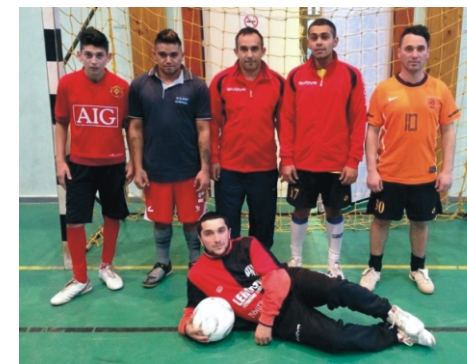
Tapsi-Hapsi Kupa 2. helyezett - Brazilok