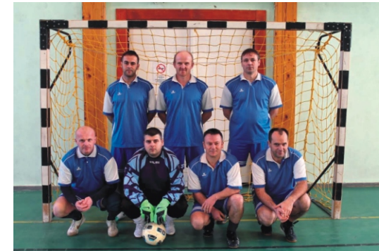
Amatőr Rimóc Kupa 3. helyezett - Nógrádsipek