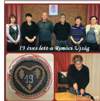
19 éves lett a Rimóci Újság