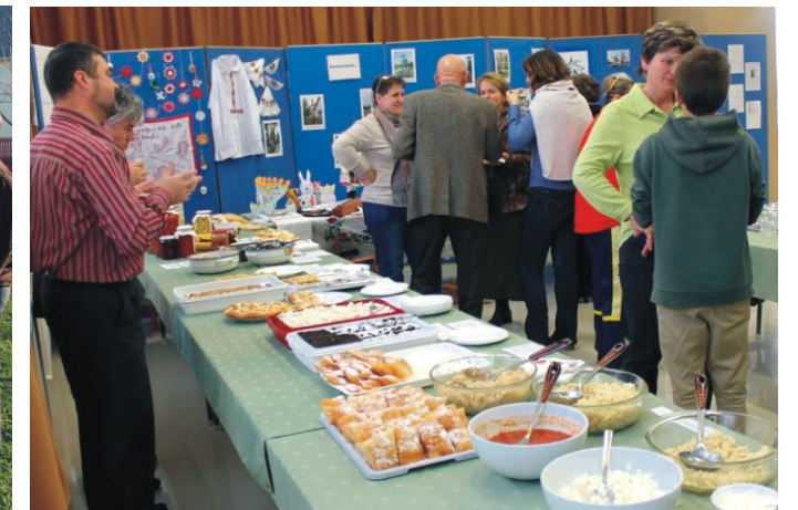
Hagyományos gasztronómiai bemutató