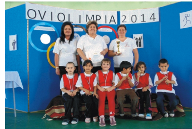
A Rimóci Nyulacska Óvoda csapata

Hosszas készülődés előzte meg a rimóci Oviolimpia létrejöttét, amelynek ötlete még tavasszal fogalmazódott meg bennünk. Szerettünk volna egy olyan programot szervezni, amely összehozza a környező település óvodáit, óvodapedagógusait, miközben a gyerekek együtt mozognak, játszanak. A felkészülésünket minden település óvodája örömmel fogadta és 6 fős csapattal vállalkozott a versenyszámok teljesítésére. A projekt-napunk költségeit az IPR-es pályázati forrásból biztosítottuk. A november 20-án megrendezésre kerülő Oviolimpiát a csapatok bemutatásával és egy közös Vitamin-tornával kezdtük, amelybe minden jelenlévő bekapcsolódott. Majd következtek a csapatok közti sorversenyek: ugráló labdán való ugrálás, zsákban futás, futóbiciklivel akadálykerülés, labda átadás, medicin labdagurítás és vonatozás. A pihenés ideje alatt banánt, szőlőcukrot és ásványvizet kaptak a gyerekek és a felnőttek egyaránt. Ezen a napon mindenki nyertes volt, helyezések nélkül. A versenyző ovisok egy-egy éremmel lettek jutalmazva illetve a csapatok hazavihettek egy emléklapot és egy kupát, a rimóci Oviolimpia emlékére. Nagyon jó hangulatban telt el ez a délelőtt, csak pozitív visszajelzést kaptunk a vendégeinktől. Abban mindenki egyetértett, hogy ennek a programnak legyen folytatása és váljon hagyománnyá az intézményeink között. Köszönjük mindenki segítségét, aki hozzájárult a programunk megszervezéséhez és lebonyolításához!