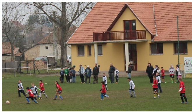
2014.11.22. Bozsik Egyesületi Torna U11/U13 - Rimóc sportpálya