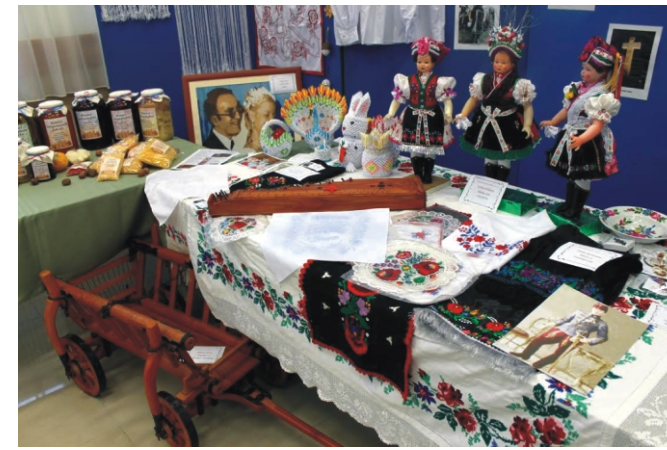
A kiállítás egy része