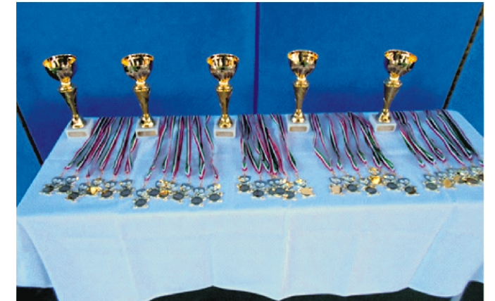
Mindenki egyformán részesült az elismerésben és a díjazásban