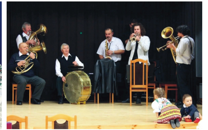
Közreműködött a Rimóci Rezesbanda