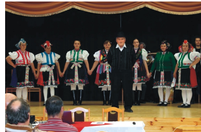
A Rimóci Hagyományörző Együttes műsora