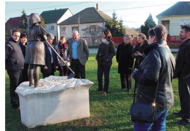
Értékeinket saját környezetünkben is megnéztük