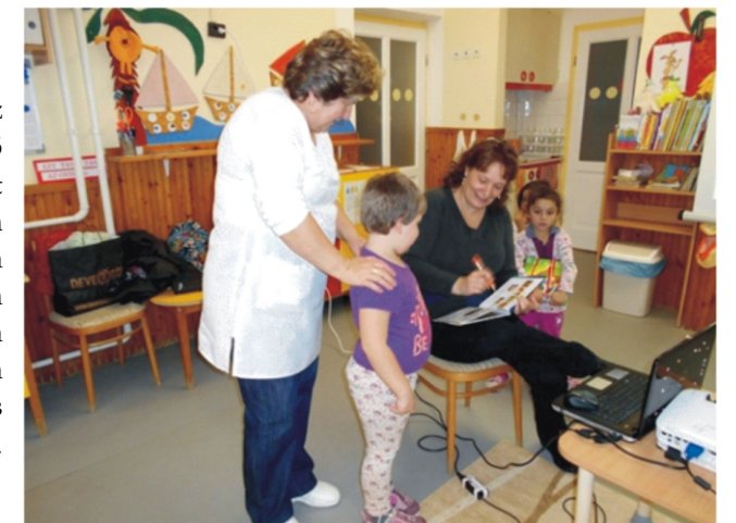
Az író nő a mesekönyve dedikálása közben