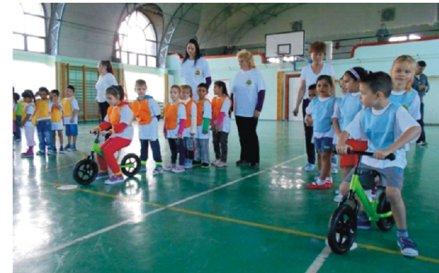
„Elkészülni, vigyázz, rajt!”