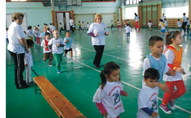
A közös futás előzte meg a Vitamin-tornát